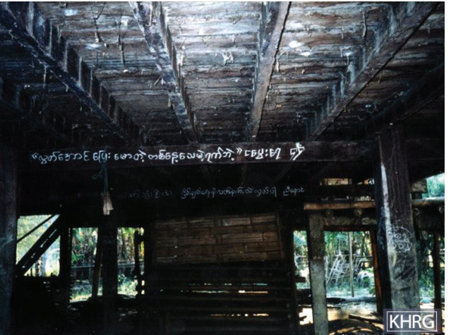
မူကြော်ခရိုင် အရှေ့ဘက်တွင် နအဖ တပ်မ (၄၄) လက်အောက်ခံ၊ ခလရ (၂)၊ စစ်သားများမှ မီးမလောင်သောနေအိမ်များတွင် ရွာသားများအတွက် အောက်ပါစာများ ချန်ထားခဲ့သည်။ “လွတ်အောင်ပြေး၊ မောတုံ တစ်နေ့သေမဲ့ရက်ဘဲ။ ငပွေးရေ။ [ခမရ] ၄၄”။

- ၁၉၇၅ ခုနှစ်တွင် မြန်မာစစ်တပ်မှ နှစ်ရက်ကြာ နှိပ်စက်ညှဉ်းပမ်းခဲ့သည့် မူကြော်ခရိုင်မှ စောအဝ---