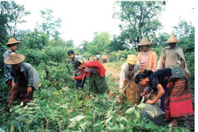
၂၀၀၂ ခုနှစ်၊ နိုဝင်ဘာလတွင် ခမရ ၄၄ မှ [မင်းအောင်လှိုင် အမိန့်အောက်ရှိ] နအဖစစ်သားများသည် ၎င်းတို့၏တပ်သားများအား လမ်းမကြီးတစ်လျှောက်လှည့်လည်စဉ် ခြံခိုတိုက်ခိုက်ခြင်းမှကာကွယ်ရန် ဘီးလင်း-ဖာပွန် လမ်းမကြီးတစ်လျှောက် ပေ ၅၀ [၁၅ မီတာ] အကွာအဝေး အတွင်းရှိသစ်ပင်များ၊ ခြံများနှင့် အပင်အားလုံးကိုခုတ်ရှင်းရန် ရွာသားများအားခိုင်းစေခဲ့သည်။