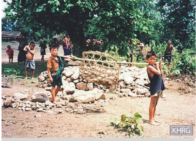
၂၀၀၄ ခုနှစ်၊ မေလတွင် အသက် ၇ နှစ်မှ ၁၃ နှစ်အရွယ် ကလေး များသည် ကျိုက်ကော် (သိမ်ဆိပ်) မှ ဝင်းရောကျေးရွာသို့လမ်းဖောက် ရန်အတွက် ကျောက်တုံးအပုံ ၃၀၀ ကို စုဆောင်းကြရသည်။