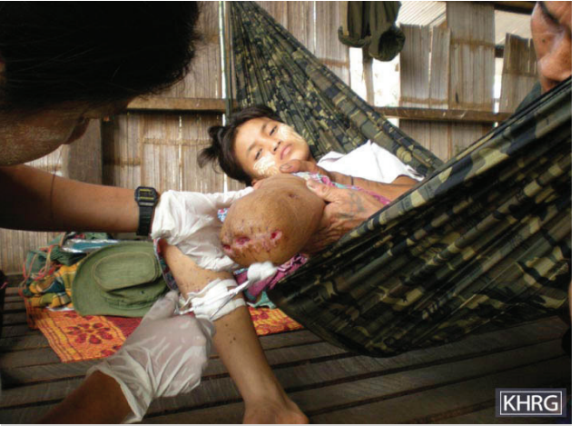
မူကြော်ခရိုင်၊ စောမူပလောကျေးရွာအုပ်စုမှ အသက် ၁၆ နှစ်အရွယ် နော်ဒ--- သည် ၂၀၀၈ ခုနှစ်၊ မတ်လ ၁၅ ရက်နေ့တွင် သူမ၏ မိသားစုဝင်များဖွက်ထားသည့် ဆန်များအား ရယူရန် သူမ၏ကျေးရွာသို့ သွားရောက်စဉ် နအဖ စစ်တပ်၏ မြေမြှုပ်မိုင်းနှင့် မိခင်သောကြောင့် ဒဏ်ရာရရှိခဲ့သည်။ ဆေးမှုများမှ ညာခြေထောက်အောက်ပိုင်းကို ဖြတ်တောက်ပေးထားရာမှ ပြန်လည်ကောင်းမွန်လာခဲ့ပါသည်။