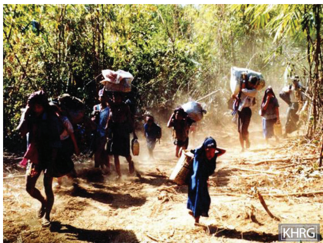
၁၉၉၇ ခုနှစ်၊ ဖေဖော်ဝါရီလလယ်တွင် ဒူးပလာယာခရိုင်မှ ကရင်ရွာသားများသည် ၎င်းတို့ သယ်နိုင်သည့် ပစ္စည်းများကို သယ်ယူ၍ အသက်ရှင်လွတ်မြောက်ရန် ထွက်ပြေးနေပုံကို ဖော်ပြထားသည်။ ဤရွာသားများ ထွက်ပြေးကြသည့်အချိန်တွင် မြန်မာစစ်တပ်မှ ခြေလျှင်ဖြင့် နာရီဝက်အကွာအဝေးတွင် ရောက်ရှိနေပြီဖြစ်သည်။

- ၁၉၉၇ ခုနှစ်တွင် တွေ့ဆုံမေးမြန်းခဲ့သည့် မူကြော်ခရိုင် မှ ရွာသားတစ်ဦး