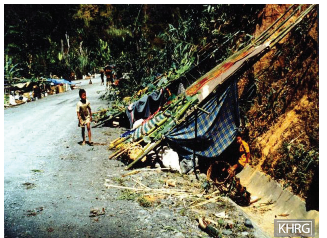
၁၉၉၇ ခုနှစ်၊ ဖေဖော်ဝါရီ လလယ်တွင် ထိုင်းနိုင်ငံ ကဟီးပလယ်လမ်းဘေးနှင့် ရေနုတ်မြောင်းများတွင် စခန်းချနေထိုင်ကြသည့် ဒူးပလာယာခရိုင်မှ အသစ်ရောက်ရှိလာသော ကရင်ဒုက္ခသည် ၆၀၀၀ ခန့်ဖြစ်သည်။ ထိုင်းအာဏာပိုင်များမှ ၎င်းတို့အား လမ်းဘေးတွင်သာ တဲထိုးနေရန် ခွင့်ပြုပေးခဲ့ကြသည်။