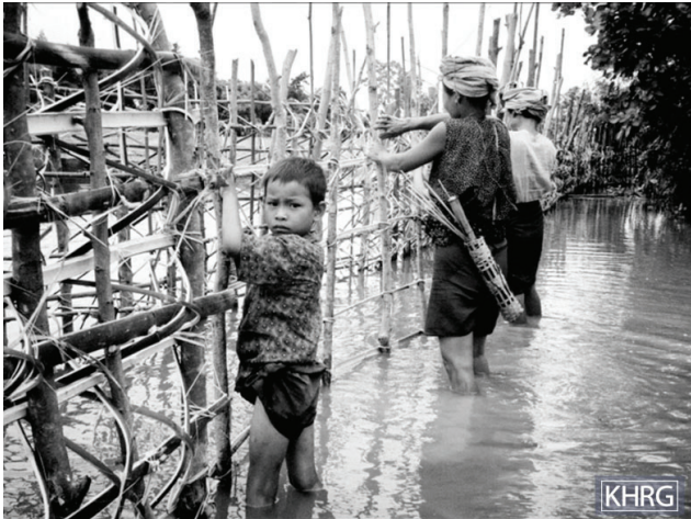
၂၀၀၆ ခုနှစ်တွင် ခလယ်လွှဲထူခရိုင်၊ မူးမြို့နယ်ရှိ ကျေးရွာအားလုံးနှင့် နိုင်ငံတော် အေးချမ်းသာယာရေး နှင့် ဖွံ့ဖြိုးရေး ကောင်စီ (နအဖ) လက်အောက်တွင် ရှိသော ရွှေ့ပြောင်းစခန်းအားလုံးကို ၎င်းတို့ကျေးရွာ ပတ်ပတ်လည်တွင် ခြံစည်းရိုးခတ်ရန် ခြေမြန်တပ်ရင်း (ခမရ) ၅၉၉ က အမိန့် ပေးခဲ့သည်။