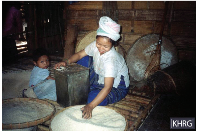
မူကြော်ခရိုင်မှ အမျိုးသမီးသည် နအဖစစ်သားများ သူမ၏ ရွာထဲသို့ နောက်တစ်ကြိမ် ဝင်လာလျှင် အသုံးပြုရန် သူမ၏ဆန်အား သံပုံး အတွင်းသို့ ထည့်ပြီး ဖွက်ထားသည်။ နအဖ တပ်သားများသည် ယခင် ကရွာအတွင်းသို့ တစ်ရက် နှစ်ရက်ခန့် ဝင်ရောက်ပြီး ရွာသားများ၏ ဆန်များ၊ အဝတ်အစားများနှင့် အခြားပိုင်ဆိုင်မှုများကို ယူဆောင် သွားကြသည်။