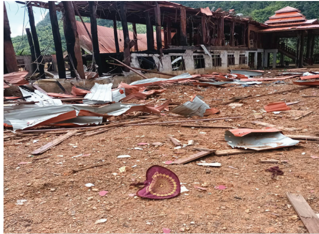
၂၀၂၂ ခုနှစ်၊ အောက်တိုဘာလ ၆ ရက်နေ့ နံနက် ၂ နာရီ ၁၅ မိနစ်တွင် SAC ၏ တိုက်လေယာဉ်မှ ဂူးပလာယာခရိုင်၊ နို့တကောမြို့နယ်၊ မွဲကသာကျေးရွာအုပ်စု၊ မွဲကသာကျေးရွာအား ဗုံးကျဲတိုက်ခိုက်မှုပြုလုပ်ခဲ့သည်။ ဤလေကြောင်း တိုက်ခိုက်မှုကြောင့် ပျက်စီးဆုံးရှုံးမှု အလွန်များပြီး ရွာသားပေါင်း ၂၀၀၀ ခန့် အနီးအနားရှိ သစ်တောများနှင့်ဂူများတွင် ရွှေ့ပြောင်းနေထိုင်ခဲ့ကြရသည်။

များအား နိုင်ငံတကာအဆင့်တွင်ကိုင်တွယ်ဖြေရှင်းသည့် နည်းလမ်းများအပြောင်းအလဲဖြစ်စေရန် အထောက်အကူပြုမည်ဟု KHRG မှမျှော်လင့်ပါသည်။ မြန်မာနိုင်ငံရှိ တိုင်းရင်းသားလူနည်းစုအပေါ် ရာစုနှစ်တစ်ဝက်ကျော် စစ်တပ်၏အကြမ်းဖက်မှုများကိုတုံ့ပြန်ရန် နိုင်ငံတကာအသိုင်းအဝိုင်းမှ ကြိမ်ဖန်များစွာကျရုံးမှုက ၎င်းတို့၏ဖြေရှင်းမှုနည်းလမ်းများကိုပြောင်းလဲရန်လိုကြောင်း သက်သေပြနေသည်။ ထို့ကြောင့် ဤအစီရင်ခံစာတွင် ပါရှိသောရွာသားများ၏အသံများအား နားထောင်ရန်နှင့် အနာဂတ်အတွက် လမ်းကြောင်းသစ်များအား ဖော်ဆောင်ရာတွင် ၎င်းတို့နှင့်အတူတကွလုပ်ဆောင်ရန်အတွက် ဤအစီရင်ခံစာမှ ဖိတ်ခေါ်လျှက်ရှိသည်။ မြန်မာပြည်တွင် ရာစုနှစ်တစ်ဝက်ကျော်အတွင်း မြန်မာစစ်တပ်မှတိုင်းရင်းသားလူနည်းစုများအပေါ် ကျူးလွန်ခဲ့သည့် အကြမ်းဖက်မှုများကို နိုင်ငံတကာအသိုင်းအဝိုင်းများမှ လက်တွေ့ကျသည့် အရေးယူဆောင်ရွက်မှုများလုပ်ဆောင်ရန် အကြိမ်ကြိမ်ပျက်ကွက်ခဲ့သည့်အကြောင်းများကိုလည်း ဤအစီရင်ခံစာတွင်ထည့်သွင်း ဖော်ပြထားပါသည်။