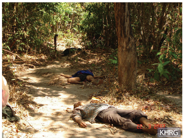
၂၀၀၇ ခုနှစ်၊ မတ်လ ညနေ ၃ နာရီခွဲခန့်တွင် မူကြော်ခရိုင်၊ သဒါဒဲဒေသမှ ရွာသားများသည် အစားအသောက်ရှာဖွေနေစဉ် နအဖ စစ်တပ်ဖြစ်သော ခြေလျင်တပ်ရင်း (ခလရ) ၅၀၁ ၏ပစ်သတ်ခြင်းခံခဲ့ရသည်။ စစ်တပ်မှ ရွာသားများ၏ နေအိမ်များနှင့် လယ်မြေများအား မီးရှို့ဖျက်ဆီးပြီးနောက် ရွာသားများအနေဖြင့် အစားအသောက် ပြတ်လပ်ခြင်းအားကြုံရပြီး အစားအသောက်ရှာဖွေရန် ရွှေ့ပြောင်းသွားလာကြရသည်။

အစိတ်အပိုင်းတစ်ခုအဖြစ် ကျယ်ကျယ်ပြန့်ပြန့် အသုံးပြုခဲ့သည်။