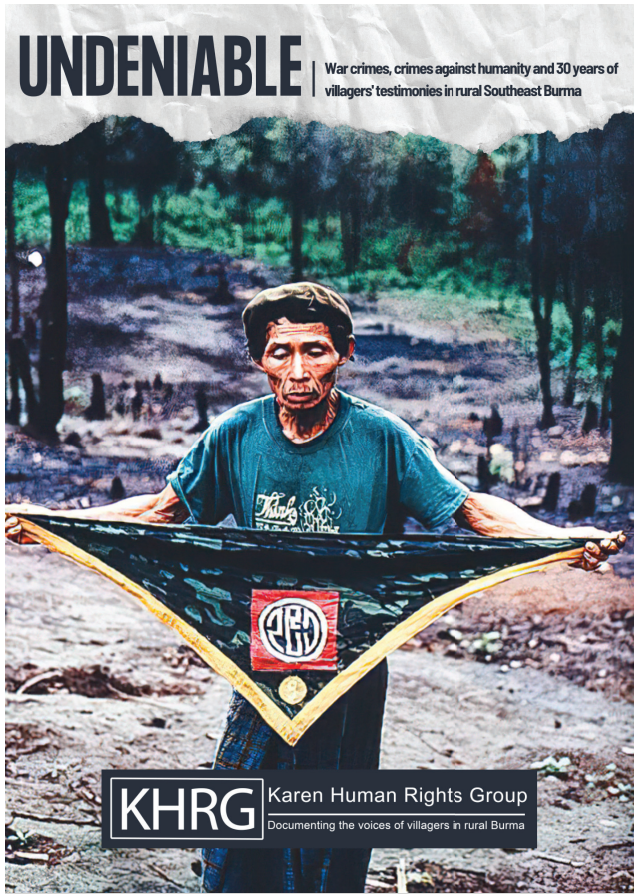
အစီရင်ခံစာအပြည့်အစုံကို အင်္ဂလိပ်ဘာသာတစ်ခုတည်းသာလျှင် ဖတ်ရှုနိုင်မှာဖြစ်ပြီး၊ အစီရင်ခံစာအကျဉ်းချုပ်ကိုမူ အင်္ဂလိပ်ဘာသာ၊ မြန်မာဘာသာနှင့် ကရင်ဘာသာဖြင့် ဖတ်ရှုနိုင်ပါသည်။ အစီရင်ခံစာအားလုံးကို www.khrg.org တွင်ရယူနိုင်ပါသည်။

ဤအစီရင်ခံစာတွင် လက်ရှိဖြစ်ပေါ်နေသည့်အကြမ်းဖက်မှုများကိုကြုံတွေ့ခံစားနေရသည့် ဒေသခံရွာသားများ၏ဘဝအခြေအနေများကိုလည်း ဖော်ပြထားပါသည်။ ထို့အပြင် မြန်မာစစ်တပ်အား အတိုက်အခံပြုသူမှန်သမျှကို အမြစ်ပြတ်ချေမှုန်းရေးလမ်းစဉ်ဖြင့် ကာလကြာရှည်စွာ ဖိနှိပ်ခံမှုကို ရင်ဆိုင်ကျော်ဖြတ်လာရသူများသည် ထိုဒေသခံရွာသား