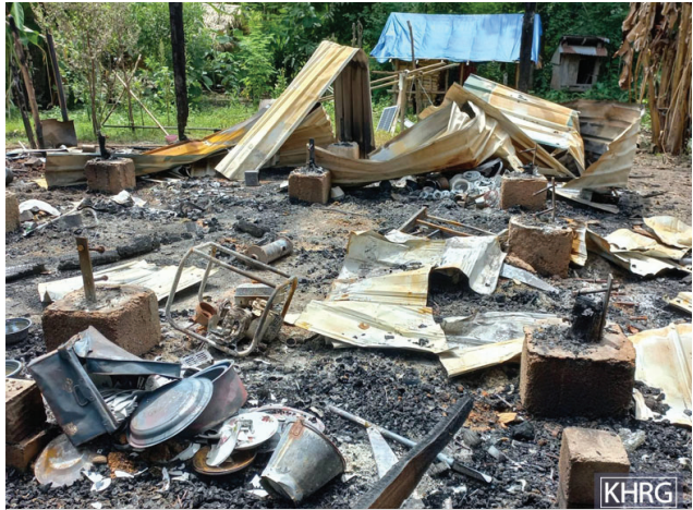
၂၀၂၂ ခုနှစ်၊ ဇူလိုင်လတွင် စစ်ကောင်စီ၏ စစ်ကွပ်ကဲအခြေစိုက် (စကခ) အမှတ် ၃၊ အမှတ် ၈၊ အမှတ် ၁၅ နှင့် ခမရ အမှတ် ၆၀ တို့မှ ခလယ်လွှဲထူခရိုင်၊ လယ်ဒိုမြို့နယ်၊ လယ်မူပယ်ကျေးရွာအုပ်စု၊ ဘလ--- ကျေးရွာတွင် နေအိမ် ၁၂ လုံးကိုမီးရှို့ပြီးမိလောင်ပျက်စီးခဲ့သည်။ SAC စစ်သားများမှ လူနေအိမ်နှင့်ဈေးဆိုင်တွင် ပစ္စည်းများနှင့် ဆန်များကို လုယက်ခိုးယူခဲ့သည်။