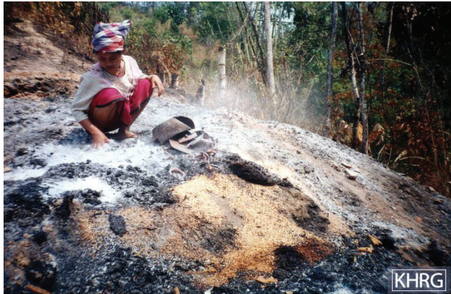
ဤပုံကို ၂၀၁၂ ခုနှစ်၊ ဇန်နဝါရီလတွင် မူကြော်ခရိုင်၊ လူသောမြို့နယ်တွင် ရိုက်ယူခဲ့သည်။ ပုံတွင် နော်စ--- သည် နအဖ စစ်သားများမှ မ--- ကျေးရွာတွင် မီးရှို့ဖျက်ဆီးခဲ့သော သူမ၏စပါးကျိုအတွင်းတွင် မီးမလောင်ပဲ ကျန်ရှိနေသေးသောစပါးအနည်းငယ်ကို သိမ်းဆည်းနေခြင်းဖြစ်သည်။ ထိုစပါးကျိုတွင်ဆန် ၅၀ တင်း ရှိသည်။ (ဓာတ်ပုံ - KHRG)