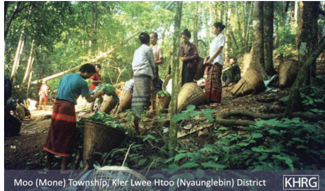
Moo (Mone) Township, Kler Lwee Htoo (Nyaunglebin) District KHRG

၂၀၀၂ ခုနှစ်၊ အောက်တိုဘာလတွင် ဘားအံခရိုင် သစ်တောထဲတွင် နယ်လှည့်ဆေးကုအဖွဲ့ ဆေးမှူးများမှ IDP များအား ဆေးကုသပေးနေခြင်းဖြစ်သည်။ တောင်ပေါ်ဒေသတွင် နေထိုင်သောရွာသားများကို ဖယ်ရှားရန်ကြိုးစားနေသော စစ်တပ်၏ပစ်မှတ်ထားတိုက်ခိုက်မှုများကို ရှောင်ရှားနေကြရင်း ဤကဲ့သို့သော နယ်လှည့်ဆေးကုအဖွဲ့များထံမှ ကျန်းမာရေးစောင့်ရှောက်မှုများကို ရယူကြရသည်။