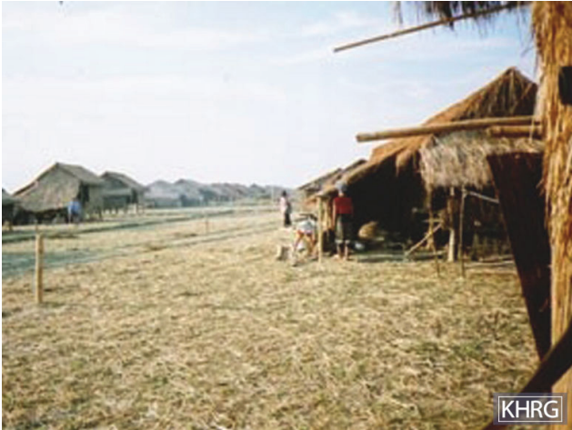
၂၀၀၆ ခုနှစ်တွင် စစ်သားများမှ ရွာသားများအား ရွှေ့ပြောင်းနေထိုင်စေသည့် ခလယ်လွှဲထူခရိုင်၊ ပလောဘောဒဲနေရပ် ရွှေ့ပြောင်းစခန်းမှ လုပ်ကိုင်စိုက်ပျိုး၍မရသော မြေဖြစ်သည်။ ပလောဘောဒဲမှ ရွာသားများက ရေရှားပါးမှု၊ စိုက်ပျိုးမြေမရှိခြင်းနှင့် လှုပ်ရှားသွားလာမှုကန့်သတ်ခံရခြင်းများနှင့်ပတ်သက်၍ တိုင်ကြားခဲ့သည်။