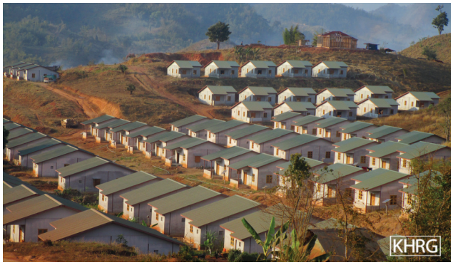
တံာ်ဂါအံာ်ဘဉ်တံာ်ဒီးန့န့အိဉ်လဲမုမုကြူအါဂါ ၆သီ, ၂၀၂၀ န့န့ ဝဲန့ပုဉ်ယံာ်ကီရုဉ်, ကီးတရးကီဆဉ်, ကီလှသဝီန့န့လီ။ ကီလှမုဝဲတံာ်ကွေးသုဉ်ထီဉ်ဆီလီသးအလီအိဉ်အကျဲတတီလှပှကွေးကွေးကွေးတဖန်အိဉ်ဆီး အဂီန့န့လီ။ တံာ်ဂါအံာ်ဟ်ဖျါဝဲဟ်သဂါတံာ်လီဝဲပှပှသုဉ်ထီဉ်န့န့ ပှဘဉ်ကီဘဉ်ခဲ ဒီးထံလီကီပှပှယှာ်အိဉ်ကမ့လှအကွေးဆိဉ်ကွေးတဖန်အဂီန့န့လီ။