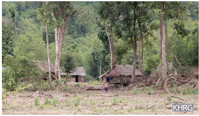
တံာ်ဂါအံာ်ဘဉ်တံာ်ဒီးန့န့အိဉ်လဲ လှပူ ၁၄သီ, ၂၀၁၇န့န့ ဝဲချာဉ်လှထီဉ်ကီရုဉ်, မူကီဆဉ်, မယီပှသဝီ န့န့လီ။ တံာ်ဂါအံာ်ဟ်ဖျါဝဲဟ်လှ ထံလီကီပှပှယှာ်အိဉ်ကမ့တဖန်ကွေးသုဉ်လီဆီလီသးအလီ ဝဲမယီပှသဝီန့န့လီ။

လံာ်တံာ်ဟ်ဖျါတဘျီအံာ်ဟ်ဖျါထီဉ်တံာ်ကိတံာ်ခဲလှ ပှကွေးကွေးကွေးတဖန်ဘဉ်သဂါဝဲ ဒ်သီးတံာ်ကဟံးထီဉ်မူဒီးမေဂုထီဉ်န့န့ဝဲ ပှကွေးကွေးကွေးတဖန် အတံာ်အိဉ်ကအိဉ်ခိဒီးအသုဉ်အဂီန့န့လီ။ လှလံာ်တံာ်ဟ်ဖျါဒီးတဘျီအံာ်အပူ KHRG ဟ်ဖျါထီဉ်ဝဲ ပှကွေးကွေးကွေးသုဉ်တဖန် အကလှဒီးအတံာ်ဘဉ်ယိဉ်ဘဉ်ဘို့တဖန်န့န့လီ။ ကီပယီပဒိဉ်, ကလှဉ်န့န့ဖိဉ်စုကတဲတဖန်ဒီး ပှဟ့တံာ်ဆိဉ်ထွဲမေစာတဖန်ကြားဆိကမိဉ်ဟ်သုဉ်ဟ်သးဝဲဘဉ်လှပှကွေးကွေးကွေးတဖန်အကလှဒီးအတံာ်ဘဉ်ယိဉ်ဘဉ်ဘို့တဖန်န့န့လီ။