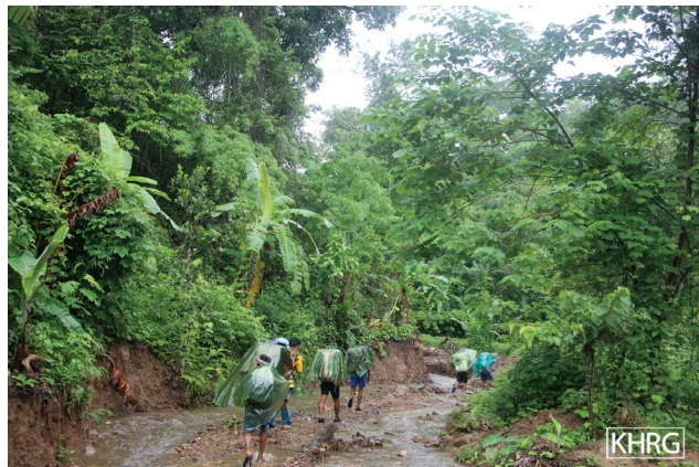
ဤပုံတို့အား ၂၀၁၇ ခုနှစ်၊ ဇွန်လ ၁၅ ရက်နေ့တွင် မူကြော်(ဗဟု)ခရိုင်၊ ဘူးသိုမြို့နယ်၊ အီးတူထာ IDP စခန်းနှင့် IDP စခန်း၏ အပြင်ဖက်ရှိ လမ်းကြားတစ်ခုတွင် ရိုက်ယူခဲ့ပါသည်။ ဤပုံသည် ခလယ်လွီထူ (ညောင်လေးပင်)ခရိုင်၊ မူး (မုန်း)မြို့နယ်ရှိ မရမ်းပင် ပြန်လည်နေရာချထားရေး နေရာသို့ မိမိအစီအစဉ်ဖြင့်ပြန်သွားခဲ့ကြသော IDP မိသားစုများ၏ပုံဖြစ်ပါသည်။