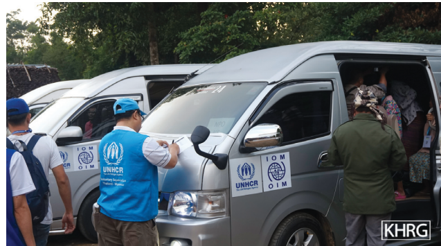
ဤပုံများအား ၂၀၁၈ ခုနှစ်၊ မေလ ၈ ရက်နေ့တွင် နို့ဖိုးယာယီဒုက္ခသည်စခန်းတွင်ရိုက်ယူခဲ့ပါသည်။ ထိုင်း-မြန်မာအစိုးရနှင့် UNHCR တို့မှဦးစီးဆောင်ရွက်ပြီး ဒုတိယအကြိမ်အဖြစ် ပြန်လည်နေရာချထားခြင်းဖြစ်ပါသည်။ ဤအကြိမ်တွင် စုစုပေါင်း ဒုက္ခသည် ၉၃ ဦးပြန်လာခဲ့ကြပါသည်။