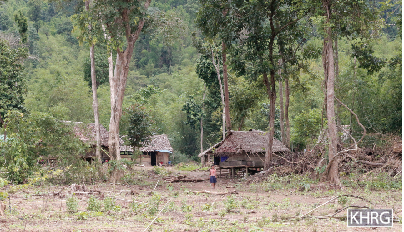
ဤပုံအား ၂၀၁၇ ခုနှစ်၊ ဇွန်လ ၂၄ ရက်နေ့တွင် ခလယ်လွီထူ (ညောင်လေးပင်) ခရိုင်၊ မူး (မုန်း) မြို့နယ်၊ မရမ်းပင်ကျေးရွာတွင် ရိုက်ယူခဲ့ပါသည်။ ဤပုံသည် မရမ်းပင်ကျေးရွာသို့ ပြန်လည်နေထိုင်ကြသော IDP များ၏အိမ်များပုံဖြစ်ပါသည်။