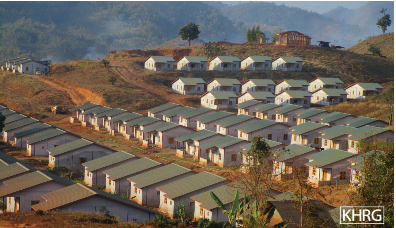
ဤပုံအား ၂၀၂၀ ခုနှစ်၊ ဖေဖော်ဝါရီလ ၆ ရက်နေ့တွင် ဒူးပလာယာခရိုင်၊ ကော်တရီ (ကော့ကရိတ်) မြို့နယ်၊ ကော်လားကျေးရွာကို ရိုက်ယူခဲ့သည့် ဗီဒီယိုထဲမှ ပုံကိုပြန်လည်ယူထားခြင်းဖြစ်ပါသည်။ ကော်လားကျေးရွာသည် နေရပ်ပြန်သူများအတွက် ချမှတ်ထားသည့် ပြန်လည်နေရာချထားရေး နေရာထဲတွင် တစ်ခုအပါအဝင်ဖြစ်ပါသည်။ ဤပုံသည် ဒုက္ခသည်များနှင့် IDP နေရပ်ပြန်သူများအတွက် အသစ်ဆောက်လုပ်ထားသော အိမ်အလုံး သုံးရာ၏ပုံ ဖြစ်ပါသည်။