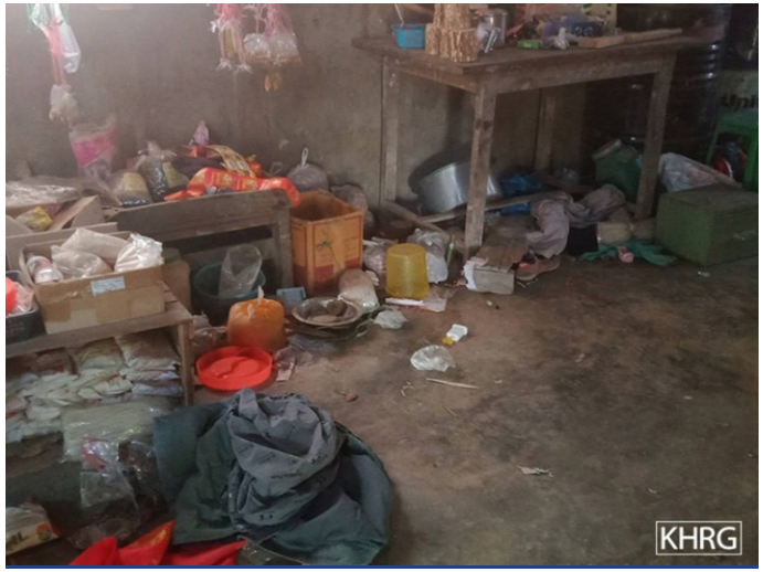
ဤဓာတ်ပုံအား ၂၀၂၄ ခုနှစ်၊ မတ်လ ၂ ရက်နေ့တွင် ခလယ်လွှီထူခရိုင်၊ မူးမြို့နယ်၊ အင်းနယ်ကျေးရွာအုပ်စု၊ အယ--- ကျေးရွာ၌ ရိုက်ယူခဲ့သည်။ ပုံတွင် တပ်မ (၇၇) မှ စစ်ကောင်စီစစ်သားများသည် အယ--- ကျေးရွာထဲသို့ ဝင်လာပြီးနောက် ရွာသားများ၏အိမ်ထဲတွင် ဝင်ရောက်၍ ပစ္စည်းများကိုသိမ်းယူပြီး မွေနှောက်ထားသောအခြေအနေကို ဖော်ပြထားသည်။

၂၀၂၄ ခုနှစ်၊ ဧပြီလ ၂၈ ရက်နေ့ ည (၇)နာရီ ဝန်းကျင်တွင် စစ်ကောင်စီ စစ်သားများသည် တောအူးခရိုင်၊ ဒေါ်ဖားခိုမြို့နယ်၊ ထီးဒေးဒေသ၊ အဘ--- ကျေးရွာအတွင်းသို့ ဝင်ရောက်လာပြီး ရွာသားများ၏နေအိမ် (၂) လုံးကို မီးရှို့ဖျက်ဆီးခဲ့သည်။ အခင်းဖြစ်ပွားပြီးနောက် ဒေသခံတော် လှန်ရေးတပ်ဖွဲ့သည် မီးရှို့ဖျက်ဆီးခံရသည့်အိမ် (၂)လုံး၏ ပိုင်ရှင်များနှင့် မိသားစုဝင်များကို ဆန်နှင့်စားစရာအချို့ ကူညီထောက်ပံ့ခဲ့သည်။ အချိန်တွင် ထိုအိမ်ပိုင်ရှင်များသည် ပျက်စီးသွားသည့်အိမ်နှင့် ၎င်းတို့ဘဝကို ပြန်လည်တည်ဆောက်ရန်အတွက် ကူညီထောက်ပံ့မှုများ မရရှိတော့ပါ။ မီးရှို့ဖျက်ဆီးခံရသည့်အိမ် (၂)လုံး၏ပိုင်ရှင်များနှင့်မိသားစုဝင်များသည် စားဝတ်နေရေးအတွက် ရုန်းကန်နေရပါသည်။