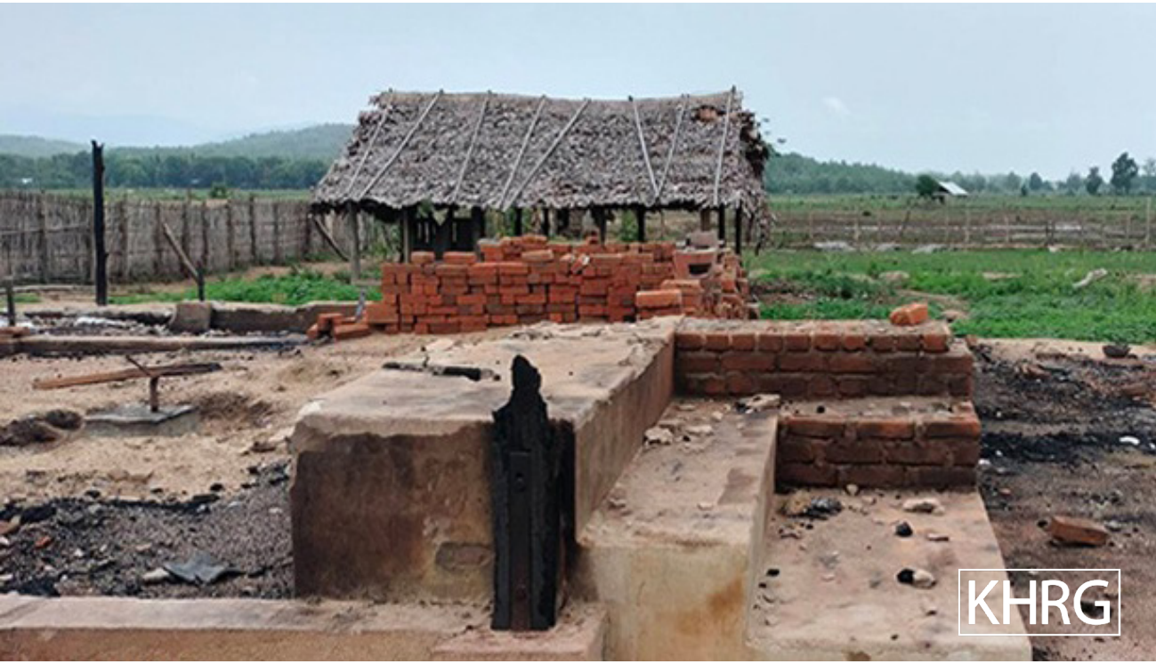
ဤဓာတ်ပုံကို တောအူးခရိုင်၊ ဒေါ်ဖားခိုမြို့နယ်၊ ထီးဒေးဒေသ၊ အဘ---ကျေးရွာတွင် ရိုက်ယူခဲ့ပါသည်။ ၂၀၂၄ ခုနှစ်၊ ဧပြီလ ၂၈ ရက်နေ့ ည (၇)နာရီ ဝန်းကျင်တွင် စစ်ကောင်စီ စစ်သားများသည် တောအူးခရိုင်၊ ဒေါ်ဖားခိုမြို့နယ်၊ ထီးဒေးဒေသ၊ အဘ---ကျေးရွာ အတွင်းသို့ ဝင်ရောက်လာပြီး ရွာသားများ၏နေအိမ် (၂)လုံးကို မီးရှို့ဖျက်ဆီးခဲ့သည်။