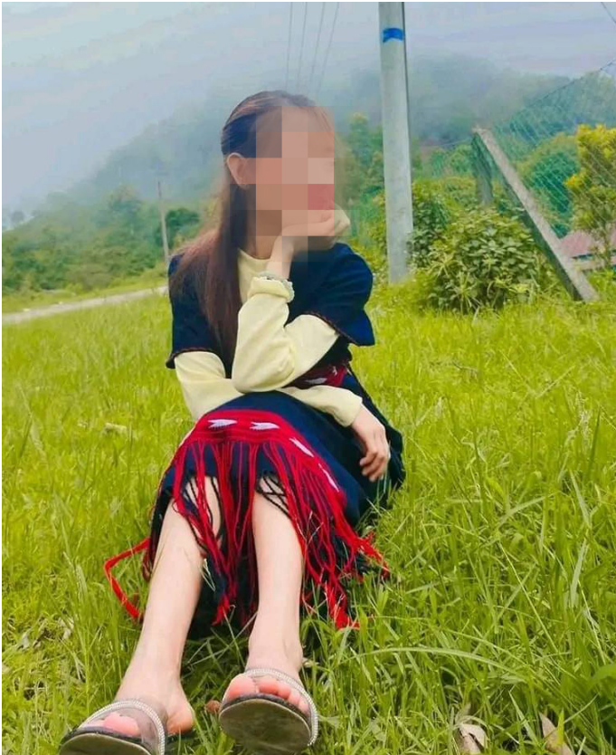
၂၀၂၄ ခုနှစ်၊ မေလ ၁၀ ရက်နေ့တွင် စစ်ကောင်စီ၏ ဖမ်းဆီးခြင်းကို ခံခဲ့ရသည့် တောင်ငူခရိုင်၊ ဒေါ်ဖားခိုမြို့နယ်၊ ဒေးလုံမုန့်အထက်ဒေသမှ နော်ကဆ---၏ ပုံဖြစ်သည်။

လုပ်ဆောင်ခြင်းကြောင့် ရွာသားများအနေဖြင့် ခရီးသွားလာခြင်း၊ အသုံးအဆောင်ပစ္စည်းများ ဝယ်ယူခြင်းနှင့် ရောင်းချခြင်းများပြုလုပ်ရန် စိတ်အနှောက်အယှက်ဖြစ်စေသည်။ ထို့ပြင် စစ်ကောင်စီ ရဲတပ်ဖွဲ့ဝင်များ၏ ခေါင်းပုံဖြတ် ငွေကြေးတောင်းခံမှုနှင့် ဖမ်းဆီးခြင်းခံခဲ့ရသည့် အချို့သောရွာသားများသည် ခရီးသွားလာခြင်းများ ထပ်မံမပြုလုပ်လိုကြတော့ပေ။