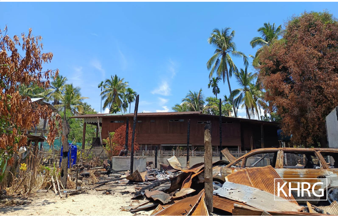
၂၀၂၄ ခုနှစ်၊ မတ်လ ၁၇ ရက် ညနေ ၄း၃၀ တွင် ခြေလျင်တပ်ရင်း (ခလရ-၂၇၅) ၏ လက်နက်ကြီးပစ်ခတ်မှုကြောင့် ဘားအံခရိုင်၊ တနေးဆာ(နဘူး)မြို့နယ်၊ ဝေရမ်းကျေးရွာ အုပ်စု၊ ဝေရမ်းကျေးရွာရှိ ထိုင်းလူမျိုး၊ စောစဆ--- အသက် (၄၅) နှစ် ၏ နေအိမ်နှင့် ဆိုင်ခန်း ထိမှန်ပျက်စီးသွားသည့်ပုံဖြစ်သည်။