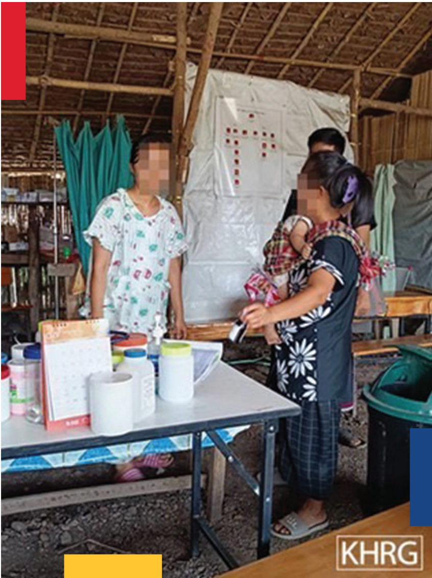
ဤဓာတ်ပုံသည် ၂၀၂၄ ခုနှစ်၊ မတ်လ ၁၃ ရက်နေ့တွင် ကော့ကရိတ် မြို့နယ် ဒူးပလာယာခရိုင် ၀၀---ကျေးရွာအုပ်စု ၀၀---ကျေးရွာတွင် KDHW မှ ၂၀၂၁ ခုနှစ် ကတည်းက စစ်ဘေးရှောင်ရသော ဒေသခံ များအတွက် တည်ဆောက်ပေးသည့် ဆေးပေးခန်း၌ ရိုက်ကူးခဲ့ခြင်း ဖြစ်သည်။ ဓာတ်ပုံတွင် စစ်ဘေးရှောင်များသည် KDHW ဆေးပေး ခန်းမှ ဆေးဝါးများအား အခမဲ့လာရောက် ရယူနေပုံဖြစ်သည်။