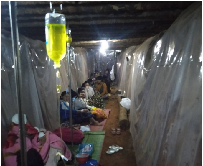
တၢ်ဂီၤတဘျီအံၤဘၣ်တၢ်ဒိန့ၣ်အိၣ် ဖဲလါဒိၣ်စဲဘၣ် ၁၃သီ, ၂၀၂၃နှစ် ဖဲ ၈၀--- တၢ်ဆါ ဟံၣ်, ဟးတရဲၤကရူၢ်, ဖၣ်အၣ်ကီၢ်ဆၢၣ်, ဒုသထူၣ်ကီၢ်ရဲၣ်ပူၤန့ၣ်လီၤ. တၢ်ဂီၤအံၤပာ်ဖျါထီၣ် ဝဲ ပယီၤကဘီယုၤဒုးဟဲးလဲၤတၢ်အပိ ပုၤဆါလၢအအိၣ်ဖဲ ၈၀--- တၢ်ဆါဟံၣ်သ့ၣ် တဖၣ် အိၣ်ဆူၣ်အသးဖဲတၢ်ပူၤတတီၢ်န့ၣ်လီၤ.

လိာ်တၢ်ကစိၣ်တဘျီအံၤ ပာ်ဖျါထီၣ်ဝဲ လါစဲးပထုဘၣ် ၂၀၂၃ နှစ် တုၤ လါဖျါအါရံၤ ၂၀၂၄ နှစ်အတီၢ်ပူၤ တၢ်အိၣ်ဆူၣ်အိၣ်ချ့အတၢ်ဂ့ၢ်ကိလၢ ကဗျါဖဲကညီကီၢ်စဲၣ်ပူၤသ့ၣ်တဖၣ်ဘၣ်ကွၢ်ဆၢၣ်မဲၣ်ဝဲန့ၣ်လီၤ. ကညီကီၢ် စဲၣ်လၢ KHRG ဟူးဂဲၤဝဲ ကီၢ်ရဲၣ် (၇) ဘျီအကျါ (၅) ဘျီ လၢအမ့ၢ် ဒုသ ထူၣ်ကီၢ်ရဲၣ်, ချါၣ်လွံၣ်ထူၣ်ကီၢ်ရဲၣ်, ဘျီး-ဒဝဲၣ်ကီၢ်ရဲၣ်, မ့ၢ်တြီၢ်ကီၢ်ရဲၣ် ဒီး ဒုပျံၣ်ယၢ်ကီၢ်ရဲၣ် အပူၤကဗျါသ့ၣ်တဖၣ် ဘၣ်ကွၢ်ဆၢၣ်မဲၣ်ဒီး တၢ်အိၣ်ဆူၣ် အိၣ်ချ့အတၢ်ဂ့ၢ်ကိ ဒိတၢ်ပာ်ဖျါလၢကီၢ်ရဲၣ် တဘျီဒုၣ်ဝဲစ့ၣ်စ့ၣ်အပူၤန့ၣ် လီၤ. လၢကီၢ်ရဲၣ်(၇)ဘျီအံၤအပူၤ ပုၤကွၢ်ပုၤဆါ, တၢ်ဟ့ၣ်ကသံၣ် ဒါး ဒီး ကသံၣ်ကသီတဖၣ် တလၢလီၣ်ဘၣ်, ခီဖျါ ပယီၤသုးတဖၣ် တြီအဝဲသ့ၣ် အတၢ်ဟးထီၣ်ကွၢ်လီၤကျဲအပိတၢ်ဂ့ၢ် ကီၢ်အိၣ်ထီၣ်လၢကလဲၤတၢ်ဆါဟံၣ် အဂီၢ်, ကျိၣ်စ့အတၢ်ဂ့ၢ်ကိအိၣ်လၢကဒီးကူစါယါဘျီသးအဂီၢ်, တၢ်ဆါဟံၣ် ဟးမ့ၢ်ဟး ဂါခီဖျါတၢ်ခဲးလီၤကျဲဖးဒိၣ်အပိ, သဝီဖိလၢပုၤမ့ၢ်ပုၤဖျါသ့ၣ်တ ဖၣ်အအိၣ်ကသံၣ်ကသီတၢ်မၤစၢၤတတုၤ, လၢတၢ်ဂ့ၢ်ကိ သ့ၣ်တဖၣ်အံၤ အပိ ပုၤကဗျါအတၢ်အိၣ်ဆူၣ်အိၣ်ချ့တၢ်အိၣ်သးနးထီၣ်ဝဲဒုၣ်ကွၢ်ကွၢ်န့ၣ် လီၤ. ကရၢလၢအဟူးဂဲၤလၢတၢ် အိၣ်ဆူၣ်အိၣ်ချ့အဂီၢ် လၢကီၢ်ရဲၣ် (၅) ဘျီ အံၤအပူၤသ့ၣ်တဖၣ်မ့ၢ်ဝဲ ကညီဆူၣ်ချ့မၤစၢၤဝဲကျိၣ် (KDHW), ထၢၣ်ပုၤချါ BPHWT, Shoklo Malaria Research Unit (SMRU), Free Burma Ranger (FBR), လီၢ်ကဝီၤတၢ်ဆါဟံၣ် ဒီး တၢ်ဟ့ၣ်ကသံၣ်ဒါးသ့ၣ်တဖၣ် န့ၣ်လီၤ.