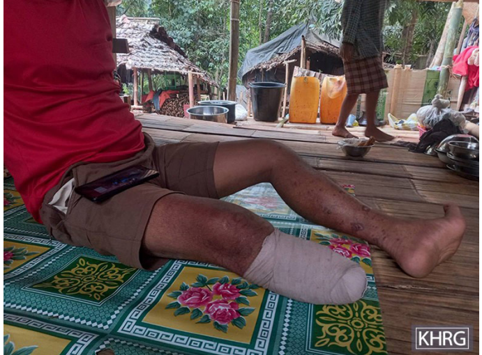
တၢ်ဂီၤတဘျီအံၤ တၢ်ဒီးန့ၣ်အိၣ်ဖဲလါယနူၤအါရံၤ ၉ သီ, ၂၀၂၄ နှစ်, ဖဲဃပ---သဝီ, ထီ ဝဲလီၤကရံၢ်, ကိးတရံးကီၢ်ဆၢ, ဒုပျၢ်ယၢ်ကီၢ်ရ့ၣ်ပူၤန့ၣ်လီၤ. တၢ်ဂီၤအံၤ ဟံၣ်ဖျါထီၣ်ဝဲ ကွဲးဒိဝဲသဝီဖိလၢအမ့ၢ်မ့ၢ်ပုၤဖျိလၢအမ့ၢ်ဝဲ အူကယ--- အတၢ်အိၣ်သးန့ၣ်လီၤ. ဖဲ လါ ဒိၣ်စဲဘၣ် ၇ သီ, ၂၀၂၄ နှစ်န့ၣ်, အူကယ --- အံၤ ယီၢ်ဘၣ်ဝဲဟီၣ်လၢမ့ၢ်ပျီတဖျၢၣ် ဖဲ အဝဲဟဲက့ၤဆူအဟံၣ်အိၣ်ဖဲ ကွဲးဒိဝဲပူၤအဆၢကတီၢ်န့ၣ်လီၤ. (တၢ်ဂီၤ-KHRG)

တဖျၢၣ်လၢတၢ်ဒီးလီၤအိၣ်လၢကျဲမ့ၢ်ခိၣ်န့ၣ်လီၤ. ဒီဖျိလၢဟီၣ်လၢမ့ၢ်ပျီ ပိၢ် ဖိထီၣ်အဃိ, အူကယ--- အခိၣ်လၢအထွဲတပၤန့ၣ်တူၢ်ကွံၣ်ဝဲ ဒီးအခိၣ် လၢအစ့ၣ်တကပၤစ့ၢ်ကိးဘၣ်ဒိဘၣ်ထံးဝဲဒၣ်န့ၣ်လီၤ. ဝံၤအလီၢ်ခံ, လီၢ်က ဝီၤပုၤဘၣ်မူဘၣ်ဒါတဖၣ် လဲၤဆူအံၤဆူ ဃပ--- တၢ်ဆါဟံၣ်ဝံၤဒီးတၢ်ဆူ ဒီကဒါက့ၤအိၣ်တဆီဆူတၢ်ဆါဟံၣ်တဖျၢၣ်လၢအအိၣ်လၢ ကီၢ်ကီၢ်တဲၣ်ပူၤ န့ၣ်လီၤ. သဝီဖိအိၣ်လၢ ကွဲးဒိဝဲပူၤတဖၣ်န့ၣ်ဝဲလၢ ဟီၣ်လၢမ့ၢ်ပျီတဖျၢၣ် အံၤ ပယီၤသုးဖိတဖၣ်ဒီးလီၤဝဲဒၣ်န့ၣ်လီၤ. တၢ်အံၤမ့ၢ်လၢတၢ်ကဲထီၣ်သးအ လီၢ်အံၤအိၣ်ဘျးဒီး ပယီၤသုးခိၣ်သုးရ့ၣ် (ခလရ-၅၅၈) အသုးကလၢန့ၣ် လီၤ. တချုးလၢတၢ်ကဲထီၣ်သးဒ်ဘၣ်န့ၣ်, အူကယ--- ဒီးအသကိးခံဂၤ အံၤ ဖဲအဝဲသ့ၣ်ဟဲက့ၤလၢကျဲဆူကွဲးဒိဝဲအဆၢကတီၢ်, အဝဲသ့ၣ်ထံၣ်ဝဲ ပ ယီၤသုးခိၣ်သုးရ့ၣ် (ခလရ-၅၅၈) ဆဲးလီၤနီၣ်ဃာ်ဝဲတၢ်ပနီၣ်လၢ ဝဲန့ၣ် လီၤ. တၢ်ပနီၣ်တခါအံၤ ဘၣ်တၢ်ဆဲးလီၤအိၣ်လၢကျဲပူၤ ဒီးလၢအဂၤတပၤ န့ၣ် ကွဲးလီၤဃာ်ဝဲလၢ တဘၣ်လဲၤတဂ့ၤန့ၣ်လီၤ. ဘၣ်ဆၢ, ပယီၤသုးမ့ၢ် မၤနီၣ်ဃာ်တၢ်ပနီၣ်သန့က့, အဝဲသ့ၣ်တဒုးန့ၣ်ဖျါထီၣ်ဝဲ ဟီၣ်လၢမ့ၢ်ပျီ တၢ်ပနီၣ်နီတမံၤဘၣ်န့ၣ်လီၤ. လၢတၢ်န့ၣ်အဃိ, သဝီဖိတဖၣ်တသ့ၣ်ညါ ဝဲတၢ်အိၣ်သးဘၣ်ဒီး အဝဲသ့ၣ်လဲၤဝဲကျဲတဘျီန့ၣ်အဃိ ယီၢ်ဘၣ်ဝဲ ဟီၣ် လၢမ့ၢ်ပျီန့ၣ်လီၤ.