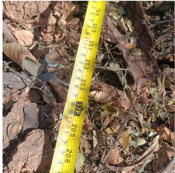
တၢ်ဂီၤသ့ၣ်တဖၣ်အံၤတၢ်ဒိန့ၣ်အိၣ်ဖဲ လါဒိၣ်စဲဘၣ် ၅ သီ, ၂၀၂၃ နှံ ဖဲ ခအ---သဝီ, မံၤသဲးကရူၢ်, ကြဲၣ်တုကီၢ်ဆၢၣ်, ဒူပျၢ်ယၢ်ကီၢ်ရ့ၣ်အပူၤန့ၣ်လီၤ. တၢ်ဂီၤအံၤပံၤဖျါထီၣ်ဝဲ ပယီၤသုး ကဘီယူၤကွံာ်လီၤမ့ၣ်ပိဒီး လီၤတၢ်ပိဖးထီၣ် ဖဲ ဒူသဝီသီခါဖျၢ်ကရူၢ်ပူၤန့ၣ်လီၤ. မ့ၣ်ပိပိဖးထီၣ်အလီၤအံၤ အယိကအိၣ်ဝဲ (၉) မ့ၣ် ဒီး အလဲၤအိၣ်ဝဲ (၁၇) မ့ၣ်န့ၣ်လီၤ.