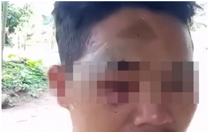
တၢ်ဂီၤတဘျီအံၤဒီးန့ၣ်ဘၣ်အိၣ်ဖဲ လၢအိးကထိဘၣ် ၂၇ သီ, ၂၀၂၃ နှစ်န့ၣ်လီၤ. ဖဲလၢအိး ကထိဘၣ် ၂၆ သီ, ၂၀၂၃ နှစ်န့ၣ် သဝီဖိတဖၣ်လၢအအိၣ်ဖဲ ဂစ---သဝီ, မဲၢ်နီၣ်အးကရၢၢ်, ကိးတရံးကီၢ်ဆၢၣ်, ဒုပုၣ်ယၢ်ကီၢ်ရၢၢ်လၢ SAC သးတြီၤနီၣ်ဂံၢ် (၄၄) သးဖိတ ဖၣ်ဖိဒ်န့ၣ် ဆူၣ် မၤအကဲပုၤကညီတၢ်ဒီသဒါကတီၢ်အသိးအဂီၢ်န့ၣ်လီၤ. (တၢ်ဂီၤ - လီၢ်ကဝီၤသဝီဖိ)

လၢကီၢ်ပယီၤမုၢ်ထီၣ်ကလံၤထံးအပူၤခိဖျိလၢ SAC အတၢ်ပညိၣ်မၤဘၣ်ဒိ ပုၤဟီၣ်ခိၣ်ဖိခွဲးယၢ်လၢအမုၢ် တၢ်ဖိဒ်န့ၣ်ဆူၣ်ဒီး တၢ်မၤအၤမၤနးလီၤလီၤအံၤ အဃိ ခူဖိသဝီဖိတဖၣ် ဘၣ်ဒိဘၣ်ထံးနးနးကလဲၣ်, ပျီတၢ်ဖုးတၢ်ဒီး ဘၣ် ဒိဝဲသးအတၢ်တူၢ်ဘၣ်တဖၣ်န့ၣ်လီၤ. လၢန့ၣ်အမဲၢ်ညါ လီၢ်ကဝီၤကမုၢ်ထံ ဖိကီၢ်ဖိ အတၢ်ဘိၣ်တၢ်ဘၢ, တၢ်အိၣ်ဆိးအိၣ်အိၣ်ဒီး တၢ်လဲၤတၢ်က့ၤတၢ်ခွဲး တၢ်ယၢ်စ့ၢ်ကိးဘၣ်ဒိဝဲဒ်နးနးကလဲၣ်န့ၣ်လီၤ. 📌