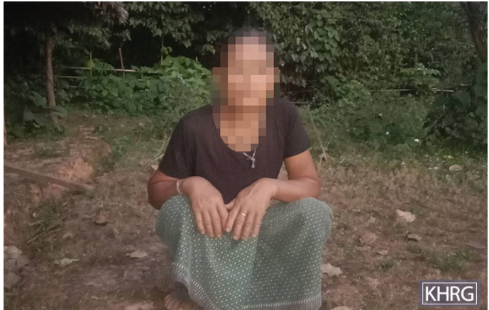
တစ်ဂီတဘျီအံဘဝ်တစ်ဒိန့အိဖဲ လုနီခိဒုဘဝ် ၂၇ သီ, ၂၀၂၃ နှစ်လု ဂက---သဝီ, မထီကရို, မှိကြိုကီရိုပူန့လီ။ တစ်ဂီတဘျီအံမုာ်ဝဲနီမ---လု SAC သုးဖိတဖန် ဖိနပ်ဆွဲသမံသမိဒီး စာယံအိလုပုပူဒိတန့ကျိန့လီ။

ဒီးအမံမုာ်လဲကွာ်ပန့န့ တစ်လီပျဲဘဝ်ယိန်ကအိန်အါဒိန်အယိန့လီ။ ဖဲလု SAC သုးဖိဝဲ နီမ---ဝံန့ ထီးဝဲအကျိခိန်လုနီမ---အသးနီပု ဒီးသံကွာ်ဝဲ နီဘ---တစ်သံကွာ်သ့တဖန် ဒ်သိးကမန့တစ်ဂိုတစ်ကျိ ဘဝ်သးဒီးသုးဖိစုကဝဲပဟီဆာတစ်သ့တဖန်အတစ်ဟုးတစ်ဂဲ လုလီ ကဝီပူန့လီ။ ဖဲန့ဝံအလီခံ အဝဲသ့ကွာ်ကီး ဝဲနီမ---ဆူအသုးက လု လုအအိန်လုဝဲမုကွဲပုပူ ဒ်သိးကလဲထံလိသးဒီးအသုးရန် ခိန့လီ။ နီမ---အံကတိပယီကျိတဘဝ်ဘဝ်အယိ ထံဘဝ်ဝဲ တစ်ကီတစ်ခဲလုကဲသကီးတစ်ဒီး SAC သုးသ့တဖန် န့လီ။ အဝဲကျဲး စးတဲပုဝဲ SAC သုးသ့တဖန်လုအလဲကွာ်ဒိပန့တစ်ကဲဘဝ်ဆန် SAC သုးသ့တဖန်မနီစါဒီးအိန့လီ။ SAC သုးသ့တဖန်စာဘဝ်စီအိ လုပုပူဒိတန့ညါလုတစ်ခဲကျိ ဒီးတဒုးအိန်အိတစ်ဘဝ်။ လုခံန့အ တစ်ဒုးအိန်အိကိန်ဒီးအဝဲတအဲဒိးဟံးအိန်ဝဲဘဝ်ဆန် ဘဝ်ဟံးအိန်ဝဲဒိ ဖျိပျဲဝဲလုတစ်ကမဆါအိအယိန့လီ။ မုာ်ဆွဲထီတန့မုာ်ဝါထီမး ဘဝ်တစ်ပျဲလီကွာ်အိန့လီ။