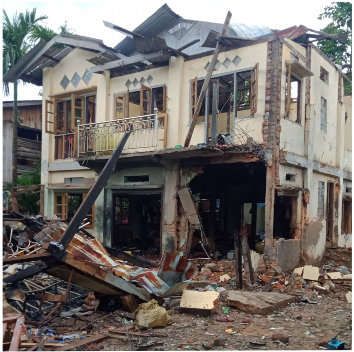
တဉ်ဂဉ်တဘဉ်အံးဘဉ်တဉ်ဒဉ်န့ဉ်အဉ်ဖဲ လဉ်ဖဲပထုဘဉ် ၄ သဉ်, ၂၀၂၃ နှဉ် လဉ်ခပ---သဝဉ်, ငထု, ရှဉ်ကရူဉ်, မုကဉ်ဆဉ်, ချဉ်လွံဉ်ထူဉ်ကဉ်ရူဉ်အပူန့ဉ်လဉ်. တဉ်ဂဉ်တဘဉ်အံးဟံဉ်ဖျဉ် ထဉ်ဝဲ ပယဉ်သးကဘဉ်ယဉ် (ကွဲး) (၂) ဘဉ် ဒဉ်း ဟံဉ်လံဉ်ခိပတဉ် (၂) ဘဉ် ဟဲခးလဉ် တဉ်လဉ် ခပ--- သဝဉ်အယဉ် မးဘဉ်ဒဉ်ကဉ်ကွံဉ်ဝဲ ပုသဝဉ်ဖဲဟံဉ်ယဉ်အကျဉ်တဖျဉ်အဂဉ် န့ဉ်လဉ်.

ဖဲ လဉ်ဖျဉ်းတြုအဉ်ရံ ၂၅ သဉ်, ၂၀၂၃ နှဉ်, ဂဉ်ဒဉ် ၁း၃၀ မံးနံးန့ဉ် ပယဉ်သး ကဘဉ်ယဉ် (ကွဲး) (၅)ဘဉ် ဒဉ်း ကဘဉ်ယဉ် ဟံဉ်လံဉ်ခိပတဉ်(၁)ဘဉ် ဟဲခး လဉ်တဉ်ဖဲ ကမုဉ်အဉ်တဉ်လဉ်, လဉ်ဒဉ်ကဉ်ဆဉ်, ချဉ်လွံဉ်ထူဉ်အပူန့ဉ်လဉ်. မ့ဉ်ပဉ်တဖျဉ် လဉ်တဉ်ဝဲဒဉ်ဖဲ KNPF ပဉ်ကဉ်တဉ်လဉ်အဉ်ဘဉ်ဒဉ်း ခဖ--- သဝဉ်, ပဒဲကဉ်ကရူဉ်, လဉ်ဒဉ်ကဉ်ဆဉ် ပုန့ဉ်လဉ် ဒဉ်း ကျဉ်ချအဂဉ် (၁) ဖျဉ် တခဉ် လဉ်တဉ်ဝဲဖဲ KNLA သးရူဉ် (နဉ်ဂံဉ်-၉) သးကလဉ်, အသ့ဉ်ပဟံဉ် ကျဉ်းအကျဉ်န့ဉ်လဉ်. မ့ဉ်ပဉ်လဉ်တဉ်ခဲလဉ် (၁၆) ဖျဉ်န့ဉ်လဉ်. ကဘဉ်ယဉ်ဟဲ ခးတဉ်အယဉ် ပုသဝဉ်ဖဲ ဘဉ်ဒဉ် (၁၄) ဂဉ် ဒဉ်း သံဝဲ (၁) ဂဉ်န့ဉ်လဉ်.