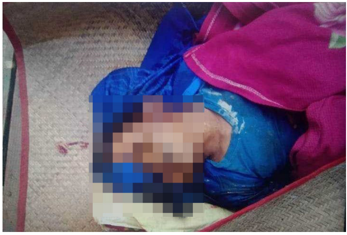
တၢ်ဂီၤတဘျီအံၤ ပံၤဖျါထီၣ်ဝဲ မိၣ်ကစ--- အိၣ်ဖဲ ဂအ---သဝီ, ပလီဟီၣ်ကဝီၤ, လၢမ့ၢ် လါကီၢ်ဆၣ်,ဘျီးဒဝဲၢ်ကီၢ်ရဲၣ်ပူၤတဂၤအဂီၢ် လၢအဘၣ်တၢ်ဖိၣ်အိၣ်, မၤဒၣ်မၤလီၤအိၣ် ဒီးမၤ သံကွဲၣ်အိၣ်လၢ ပယီၤသုးဖိတဖၣ် ဖဲလါစဲးပထွဘၣ် ၁၁ သီ, ၂၀၂၃ နှစ်န့ၣ်လီၤ.

ဘၣ်ဆၣ်သန့ၣ်က့ ပုၤမၤအိၣ်စံၣ်ဖိ မိၣ်ကစ--- သးန့ၣ် (၂၆) န့ၣ်တဂၤ ပ ယီၤသုးဖိၣ်န့ၢ်အိၣ် ဒီး ထီၣ်အိၣ်တီၢ်အိၣ် ဝံၤမၤသံကွဲၣ်အိၣ်န့ၣ်လီၤ. လၢန့ၣ်အ မဲၣ်ညါ ပယီၤသုးက့ၤဖိၣ်စ့ၢ်ကိးသဝီဖိလၢအဂၤသ့ၣ်တဖၣ်ဒီးက့ၤကိးဝဲဆူပ လီၤဝဲသုးကလၢဝံၤ ဖိၣ်ဃာ်ဝဲဖဲန့ၣ်စ့ၢ်ကိးသီဝံၤအလီၢ်ခဲ ပျါကွဲၣ်ဝဲသဝီဖိ တနီၤ ဒီးဖိၣ်ဃာ်တ့ၢ်ဝဲတနီၤအဂ့ၢ်န့ၣ်ပသ့ၣ်ညါဘၣ်န့ၣ်လီၤ.