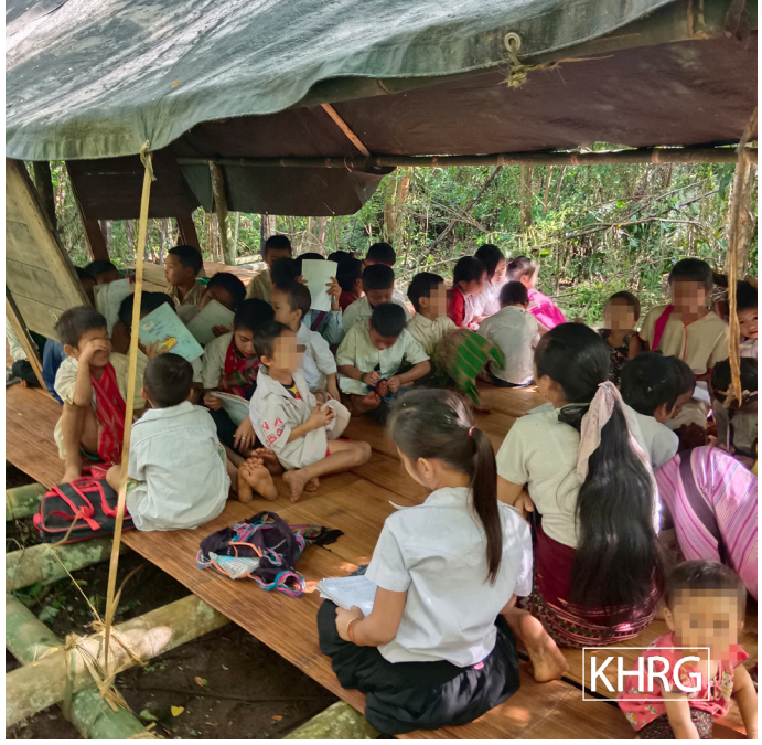
တာ်ဂီၤတဘျးအံၤဟံဖျါထီၣ်ဝဲ က့ၢ်ဖိလါ ဂတ---တီၤဖုၣ်က့ၢ် လါအအိၣ်ဖဲ စိမ့ၢ်ပျိကရူၢ်, လုၤသီကီၢ်ဆၣ်, မ့ၢ်တြီၢ်ကီၢ်ရဲၣ်အပှါ သ့ၣ်တဖၣ် တမလိဘၣ်တာ်လါက့ၢ်ပှါလါဘၣ်ဒီး ဘၣ်ဃုာ်အိၣ် မလိက့ၢ်တာ်လါတာ်ခဲခိၣ်ပှါလါကျါ ခီဖျိလါပယီကတီၢ်ယုၤသုး ဟံးခးလီၤတာ်အပိန့ၣ်လီၤ.