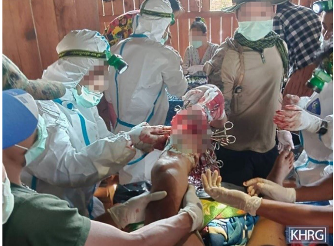
တၢ်ဂီၤတဘျီအံၤ တၢ်ဒီန့ၢ်အိၣ်ဖဲ လါယနူၤအါရဲ ၂၄ သီ, ၂၀၂၃ နှစ်, ဖဲဃထ---တၢ်ဆါဟံၣ်, လၢမံၤဖျါကရူၢ်, လုၢ်သီကီၢ်ဆၢ, မ့ၢ်တြီၢ်ကီၢ်ရၢၣ်အပူၤန့ၣ်လီၤ. တၢ်ဂီၤအံၤဟံၣ်ဖျါထီၣ်ဝဲစီကမ--- ကူစါယါဘျီသးအတၢ်အိၣ်သးန့ၣ်လီၤ. ဖဲလါယနူၤအါရဲ ၂၄ သီ, ဂီၤခီအဆၢကတီၢ်, စီကမ---အံၤ ယီၢ်ဘၣ်ဝဲဟီၣ်လၢ်မ့ၣ်ပီၢ်တဖျါဒီးဘၣ်ဒီ ဝဲဖဲအလဲၤကျဲဝဲအယုးအဆၢကတီၢ်န့ၣ်လီၤ.

လၢတၢ်ဘျီဂ့ၢ်တၢ်ဘၣ်အပူၤ, စီကဘ--- အခိၣ်ဘၣ်ဒီဝဲတဆံးတက့ၢ်ဖိအယိ အဝဲကူစါယါဘျီအသးဖဲသဝီပူၤန့ၣ်လီၤ. ဖဲစီကဘ---ယီၢ်ဘၣ်ဟီၣ်လၢ်မ့ၣ်ပီၢ်ဝဲအလီၢ်ခဲ ဒီးဟဲက့ၤလၢအဟံၣ်အဆၢကတီၢ်, အဝဲထံၣ်ဝဲဒၣ်ဟီၣ်လၢ်မ့ၣ်ပီၢ်ခဲဖျါလၢတၢ်ဒီးလီၤပၢ်အိၣ်လၢကျဲအဖိခိၣ်အယိ, အဝဲဒုးသ့ၣ်ညါဝဲသဝီဖိတဖၣ်န့ၣ်လီၤ. ဖဲ လါအိးကထိဘၣ် ၂၆ သီ, ၂၀၂၃ နှစ်န့ၣ်, ဃဆ--- သဝီဖိအဂၤတဂၤ ဒိးသိးဒီးအကလဲၤကျဲဒုးအိၣ်ကျီဆၢလၢတၢ်ချါအဂီၢ်, အဝဲလဲၤဝဲဖဲကျဲတဘျီန့ၣ်န့ၣ်လီၤ. ဝဲအလီၢ်ခဲ, အကျီတဒုယီၢ်ဘၣ်ဝဲဟီၣ်လၢ်မ့ၣ်ပီၢ်တဖျါဒီးပီၢ်ဖးထီၣ်ဝဲဒၣ်န့ၣ်လီၤ. အကျီတဒုန့ၣ်အခိၣ်တူၣ်ဝဲတကပၤ, သနၣ်က့, မ့ၢ်မ့ၢ်လၢကျီကစၢ်တခီတၢ်ဘၣ်ဒီဘၣ်ထံးတအိၣ်ဘၣ်န့ၣ်လီၤ. တၢ်ကဲထီၣ်သးဒိးသိးအံၤတဖၣ်န့ၣ် ကဲထီၣ်ဝဲဒၣ်သးလၢဖိကျိဟီၣ်ကဝီၤပူၤန့ၣ်လီၤ. ဖဲလါဒိၣ်စဲဘၣ် ၁၅ သီ, ၂၀၂၃ နှစ်, သဝီဖိလၢအအိၣ်ဖဲ ဃည--- သဝီ, ဖိကျိဟီၣ်ကဝီၤပူၤတဂၤ ယီၢ်ဘၣ်ဝဲဟီၣ်လၢ်မ့ၣ်ပီၢ်တဖျါဖဲအဝဲလဲၤဆူအိၣ်ဝဲတၢ်ဒီးတၢ်လၢ်အဆၢကတီၢ်, ဒီးအခိၣ်ဟးဂီၤဝဲဒၣ်တခီန့ၣ်လီၤ. ဖဲသဝီဖိအဂၤတဖၣ်သ့ၣ်ညါဝဲဟီၣ်လၢ်မ့ၣ်ပီၢ်ကဲထီၣ်သးဝဲအလီၢ်ခဲ, အဝဲသ့ၣ်လဲၤဆူဝဲသဝီဖိ လၢအဘၣ်ဒီဒီးဟီၣ်လၢ်မ့ၣ်ပီၢ်တဂၤအံၤဆူဒဲၣ်ဝဲတၢ်ဆါဟံၣ်န့ၣ်လီၤ. ခီဖျါလၢတၢ်ဒီးလီၤဝဲဟီၣ်လၢ်မ့ၣ်ပီၢ်လၢကမုၢ်ဖိအ တၢ်သ့ၣ်အိၣ်ဖျးအိၣ်အလီၢ်ဒိးသိးအံၤန့ၣ်, ကဲထီၣ်ဝဲတၢ်ကီၢ်တခဲလၢပုၤသဝီဖိတဖၣ် အတၢ်လုၢ်အိၣ်နီၢ်ခိးသးမူဂီၢ် ဒီးကမၤအိၣ်တၢ်လၢတနီၤဒီးတနီၤအဂီၢ်န့ၣ်လီၤ. လၢဟီၣ်ကဝီၤဖဲန့ၣ်အပူၤ တၢ်ဟ့ၣ်ပလီၢ်ဝဲဒၣ်သဝီဖိလၢ ကဟးဆူးဝဲတၢ်လီၤလၢ တၢ်လီၤဘၣ်ယိၣ်အိၣ်တဖၣ်, ဖဲအဝဲသ့ၣ်လဲၤတၢ်က့ၤတၢ်အဆၢကတီၢ်န့ၣ်လီၤ. တဘျီတခီန့ၣ်, သုးဖိၣ်စုကဝဲတဖၣ် မ့ၢ်ဒုးသ့ၣ်ညါဝဲဒၣ်သဝီဖိတဖၣ်လၢတၢ်လီၤလၢအဝဲသ့ၣ်ဒီးလီၤဟီၣ်လၢ်မ့ၣ်ပီၢ်သနၣ်က့, အဝဲသ့ၣ်တဒုးသ့ၣ်ညါဝဲတၢ်ဂ့ၢ်တၢ်ကျါလၢလၢပုၤပုၤဘၣ်န့ၣ်လီၤ.