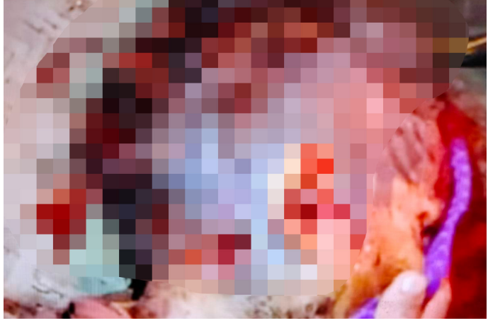
KHRG ဒီးန့ၢ်ဘၣ် တၢ်ဂီၢ်တဘျီအံၤလၢလီၤကဝီသဝီဖိတၢ်အအိန် ဖဲလါဒိၣ်ဝဲဘၣ် ၁၂ သီ, ၂၀၂၃ နှစ် ဖဲ၁၈---သဝီ, ထံသးစိကဝီ, ဒိၣ်ဖးခိၣ်ကီၢ်ဆၣ်, တီအူကီၢ်ရံၣ်န့ၢ်လီၤ. တၢ်ဂီၢ်တဘျီအံၤဟံၣ်ဖျါထီၣ် ဝဲ ဖဲလါစဲးပထုဘၣ် ၁၂ သီ, ၂၀၂၃ နှစ်န့ၢ် ပယီသုးကဘီ ယူၤခးလီတၢ်ဆူ ၁၈---သဝီအဃိ သဝီဖိ စီ၁--- အသးန့ၢ်အိန် ၁၂ နှစ် တၢ်ကအံၤအ သးသမုာ်ဘၣ်ဟးထီၣ်ကွံၣ်ဝဲဒုၣ်န့ၢ်လီၤ.

ဖဲ လါဖျါတြုၤအါရံၤ ၂၁ သီ, ၂၀၂၄ နှစ်, မုာ်ထုၣ် ၁၂း၁၂ နှစ်ရံၣ်အဆၢက တီၢ်န့ၢ် ပယီသုးကဘီယူ အိန်ဖဲတီအူဝါပူၤ တဘျီဟဲကွံၣ်လီၤမ့ၢ်ပိာ် ဖဲ ကဝီဒု (၃), ၁၀---သဝီ, ထံဒုကဝီ, ဒိၣ်ဖးခိၣ်ကီၢ်ဆၣ်ပူန့ၢ်လီၤ. လၢအ ပူၤကွံၣ်တၢ်ဒုးကဲထီၣ်ဝဲလၢ ပယီသုး ဒီး KNLA/PDFသုးဟံၣ်ဖိၣ် အဘၣ် ၈၀ ဖဲထံဒုကရူၢ်ပူၤအံၤအိန်အဃိသဝီဖိဆိကမိၣ်လၢ ကဘီယူဟဲခးလီ တၢ်ဖဲ ထံဒုကဝီပူၤအဘျီဝဲအံၤန့ၢ် ဘၣ်သုၣ်သုၣ်ကမ့ၢ်လၢ ပယီသုးတဖှ် ဆိကမိၣ်ဝဲလၢ KNLA/PDF သုးတဖှ်အိန်ဖဲ တၢ်လီၤဝဲအံၤအဃိန့ၢ်လီၤ.