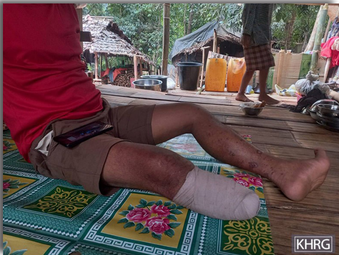
ဤပုံကို ၂၀၂၄ ခုနှစ်၊ ဇန်နဝါရီလ ၉ ရက်နေ့၌ ဒူးပလာယာခရိုင်၊ ကော်တရီမြို့နယ်၊ ထောဝါးလော်ကျေးရွာအုပ်စု၊ ယပ---ကျေးရွာတွင် ရိုက်ယူခဲ့သည်။ ပုံတွင် ကျိုက်ခုံမြို့မှ စစ်ရှောင်ရွာသားတစ်ဦးဖြစ်သူ ဦးကသ--- ၏အခြေအနေကို ဖော်ပြထားသည်။ ၂၀၂၃ ခုနှစ်၊ ဒီဇင်ဘာလ ၇ ရက်နေ့တွင် ဦးကသ--- သည် ကျိုက်ခုံမြို့ရှိ ၎င်း၏အိမ်သို့ ပြန်လာသည့်အချိန်တွင် မြေမြှုပ်မိုင်းနင်းမိခဲ့ပြီး ဒဏ်ရာရရှိခဲ့ခြင်းဖြစ်သည်။

ပြီး ဘယ်ဖက်ခြေထောက်လည်း ဒဏ်ရာရရှိခဲ့သည်။ ထို့နောက် ဒေသခံအာဏာပိုင်များမှ ၎င်းအား ယပ---ဆေးရုံသို့ပို့ဆောင်ပြီး ထိုမှတစ်ဆင့် ထိုင်းနိုင်ငံသို့ကူး၍ ထိုင်းနိုင်ငံရှိဆေးရုံတစ်ခုသို့ ပို့ဆောင်ခဲ့သည်။ ဤမြေမြှုပ်မိုင်းသည် SAC စစ်သားများမှ ထောင်ထားခဲ့ခြင်းဖြစ်သည်ဟု ကျိုက်ခုံမြို့ရှိ ရွာသားများမှ ယူဆကြသည်။ အကြောင်းမှာ အခင်းဖြစ်ပွားသည့်နေရာသည် ခလရ-၅၅၈ တပ်စခန်းနှင့် နီးသောကြောင့်ဖြစ်သည်။