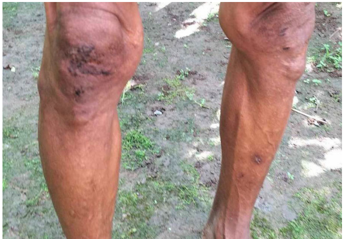
ညှဉ်းပမ်းနှိပ်စက်မှုဖြစ်စဉ်ဖြစ်ပွားပြီးနှစ်ရက်အကြာတွင် အထက်ပါပုံနှစ်ပုံကို ဒေသခံခေါင်းဆောင်တစ်ဦးထံမှ လက်ခံရရှိခဲ့သည်။ ၂၀၂၃ ခုနှစ်၊ စက်တင်ဘာလ ၁၈ ရက်နေ့တွင် SAC စစ်သားများမှ ဒူးပလာယာခရိုင်၊ ဝေါရေမြို့နယ်၊ ခလယ်တံခွန်တိုင်ကျေးရွာအုပ်စု၊ ဂခ---ကျေးရွာမှ အသက် (၅၀) အရွယ် ရွာသားတစ်ဦးဖြစ်သူ ဦးယ---ကို ဖမ်းဆီးခဲ့သည်။ ဦးယ---သည် သူ၏ဝက်များကို အစာပြန်လာကျွေးရန်အတွက် သူ၏ရွာသို့ပြန်လာသည့်အချိန်တွင် SAC မှ ၎င်းအားဖမ်းဆီးခံခဲ့ရခြင်းဖြစ်သည်။ ဦးယ---ဖမ်းဆီးခံရပြီးနောက် SAC စစ်သားများသည် ၎င်းအား ရိုက်နှက်ထိုးကြိတ်ခဲ့၍ ဒဏ်ရာပြင်းပြင်းထန်ထန်ရရှိခဲ့သည်။ ပုံတွင်ပြထားသည့်အတိုင်း ဦးယ---ဒဏ်ရာရရှိခဲ့သောအခြေအနေကို ဖော်ပြထားသည်။

SAC မှ ရွာသားများအား ပုန်ကန်သူဟုစွပ်စွဲ၍ ဖမ်းဆီးနှိပ်စက်မှုပြုခြင်း ရွာသားများသည် လက်နက်ကိုင်တော်လှန်ရေးတပ်ဖွဲ့များ သို့မဟုတ် လက်နက်ကိုင်တပ်ဖွဲ့များကို ထောက်ပံ့ပေးသူများအဖြစ် မကြာခဏ စွပ်စွဲခံရလေ့ရှိကြပြီး ဤကဲ့သို့သော အကြောင်းအရင်းများကြောင့် အဓမ္မဖမ်းဆီးခံရခြင်းနှင့် ညှဉ်းပမ်းနှိပ်စက်ခြင်းခံရကြပါသည်။ ၂၀၂၃ ခုနှစ်၊ နိုဝင်ဘာလ ၂၂ ရက်နေ့၌ မူကြော်ခရိုင်၊ ဒွယ်လိုးမြို့နယ်၊ တနေးကျေးရွာအုပ်စု၊ ဂဂ---ကျေးရွာနေ စောရ--- အား ကျွဲကျောင်းသွားနေစဉ် မယ်ကဝါးထဒေသ၊ လေးကလား(ကျောက်ဆောင်)တွင် SAC စစ်သားများ၏ ဖမ်းဆီးခြင်းခံခဲ့ရပါသည်။ SAC မှ စောရ--- အား မေးခွန်းများမေးပြီး ငပွေး(သူပုန်)လက်ခံ ဟုစွပ်စွဲခဲ့ကြပါသည်။ စောရ--- သည် ဖမ်းဆီးခံရသည့်အချိန်တွင် “သူတို့ [SAC စစ်သား] တွေက ကျွန်တော့်ကို ဓားပြင်နဲ့ရိုက်နှက်တာ သွေးပါထွက်တယ်။ ပြီးတော့ ပါးကိုလည်း ရိုက်တယ်။ နောက်ပြီးသူတို့က ကြိုးပြန်ယူပြီး ကျွန်တော့်ကို နောက်ပြန်ကြိုးတုတ်တယ်။ ကျွန်တော့်လက်တွေကရောင်ကိုင်လားလား။ သွေးတောင်သွားလို့မရတော့တာ။ အရမ်းတင်းတာ။ လုံးဝမခံနိုင်တော့ ကျွန်တော့်ကိုကြိုးလာလျှော့ပေးဖို့ တပ်ကြပ်ကြီးကိုပြောလိုက်တယ်။ သူကြိုးလာလျှော့ပေးလိုက်တော့ နည်းနည်းအဆင်ပြေသွားတယ်။” ဟု ပြန်လည်ပြောပြခဲ့ပါသည်။ ထိုညတွင် ၎င်းသည် ဂယ--- ရွာသားတစ်ဦးနှင့်အတူသစ်ပင်တစ်ပင်တွင် ဖမ်းဆီးချည်နှောင်ခြင်းခံခဲ့ရပါသည်။ အဆိုပါဂယ---ရွာသားတစ်ဦးအား SAC စစ်သားများမှ စစ်ဆေးမေးမြန်းရိုက်နှက်စဉ်တွင် စောရ---သည် ၎င်းကိုချည်ထားသည့် ကြိုး