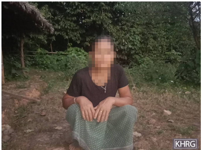
ဤပုံကို ၂၀၂၃ ခုနှစ်၊ နိုဝင်ဘာလ ၂၇ ရက်နေ့တွင် မူကြော်ခရိုင်၊ မထောကျေးရွာအုပ်စု၊ ဂက---ကျေးရွာတွင် ရိုက်ယူခဲ့ပါသည်။ ဤပုံသည် SAC စစ်သားများ၏ စစ်ဆေးမေးမြန်းခံရပြီး တောထဲတွင် တစ်ညလုံးချည်နှောင် ထားခံခဲ့ရသော နော်မ---၏ပုံဖြစ်ပါသည်။

သည့်အချိန်တွင်လည်း SAC စစ်သားများ၏ ဖမ်းဆီးခြင်းကို ခံရကြပါသည်။ ၂၀၂၃ ခုနှစ်၊ အောက်တိုဘာလ ၇ ရက်နေ့ ညနေ ၄:၃၀ အချိန်တွင် SAC စစ်သားများမှ မူကြော်ခရိုင်၊ ဒွယ်လိုးမြို့နယ်၊ မထောကျေးရွာအုပ်စု၊ ဂက---ကျေးရွာတွင်နေထိုင်သည့် နော်မ---ကို ၎င်း၏ လယ်ယာ၌ ကျွဲကျောင်းနေသည့်အချိန်တွင်ဖမ်းဆီးခဲ့ပါသည်။ သူမအနေဖြင့် လက်နက်ကိုင်ပဋိပက္ခပြင်းထန်နေသည့်အချိန်တွင် ၎င်း၏သားနှင့်သားမက်တို့ ကျွဲကျောင်းသွားရန်အလွန်အန္တရာယ်ရှိသောကြောင့် သူမကိုယ်တိုင်ကျွဲကျောင်းထွက်ခဲ့ပါသည်။ SAC စစ်သားများမှ နော်မ---အား ဖမ်းမိသည့်အချိန်တွင် ဒေသအတွင်းရှိ လက်နက်ကိုင်တပ်ဖွဲ့များ၏ လှုပ်ရှားမှုသတင်းအချက်အလက်များကိုရရှိရန် ရင်ဘတ်အားသေနတ်ထောက်မေးမြန်းခဲ့သည်။ ထို့နောက် အဆိုပါ SAC တပ်ဖွဲ့ (အမည်မသိတပ်ဖွဲ့) ၏ တပ်ရင်းမှူးနှင့်တွေ့ရန်အတွက် ၎င်းတို့အခြေစိုက်သည့် ဝါမေကျိုး တောထဲတစ်နေရာတွင် သူမအားခေါ်ဆောင်သွားခဲ့ပါသည်။ နော်မ--- သည် မြန်မာ(ဗမာ) စကားမပြောတတ်သဖြင့် SAC စစ်သားများနှင့် စကားပြောဆိုရန်အခက်အခဲရှိနေခဲ့ပါသည်။ သို့သော် သူမအနေဖြင့် တစ်ဦးတည်းဖြစ်ကြောင်းနှင့် ကျွဲကျောင်းနေခဲ့ကြောင်း SAC စစ်သားများအား ပြန်ဖြေခဲ့ပါသည်။ နော်မ--- မှ SAC စစ်သားများအား ရှင်းပြခဲ့သော်လည်း SAC စစ်သားများသည် သူမအား ဝါမေကျိုးတောထဲတစ်နေရာတွင် အစာမကြွေးပဲ တစ်ညလုံးချည် နှောင်ထားခဲ့ပါသည်။ နောက်ပိုင်းတွင် SAC စစ်သားများသည် သူမအား မုန့်သရေစာကိုသာ ကျွေးခဲ့သည်။ သို့သော် သူမအနေဖြင့် ကြောက်ရွံ့စွာဖြင့် လက်ခံခဲ့ပါသည်။ နောက်နေ့မနက်တွင် သူမကို SAC စစ်သားများမှ ပြန်လွှတ်ပေးခဲ့ပါသည်။