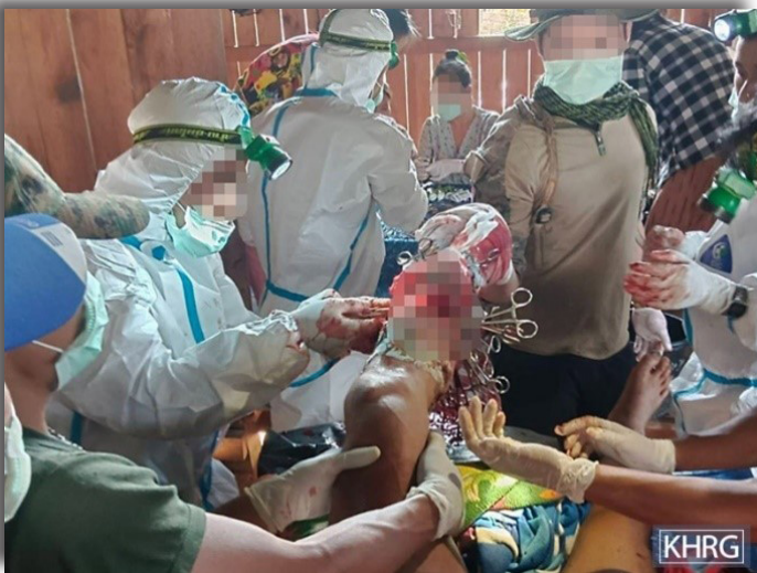
ဤပုံကို ၂၀၂၄ ခုနှစ်၊ ဇန်နဝါရီလ ၂၄ ရက်နေ့၌ မူကြော်ခရိုင်၊ လူသောမြို့နယ်၊ လယ်မူပလောကျေးရွာအုပ်စု၊ ယထ--- ဆေးခန်းတွင် ရိုက်ယူခဲ့သည်။ ပုံတွင် စောကမ--- သည် ဆေးကုသမှုခံယူနေသော အခြေအနေကို ဖော်ပြထားသည်။ စောကမ---သည် ဇန်နဝါရီလ ၂၄ ရက်နေ့ မနက်ပိုင်းတွင် ၎င်း၏တောင်ယာစိုက်ခင်းသို့သွားကြည့်သည့်အချိန်တွင် မြေမြှုပ်မိုင်းနင်းမိခဲ့ပြီး ဒဏ်ရာရရှိခဲ့ခြင်းဖြစ်သည်။

သည့်အချိန်တွင် မြေမြှုပ် မိုင်းတစ်လုံးနင်းမိခဲ့သည်။ ဦးကယ--- သည် အိမ်ထောင်သည်တစ်ဦးဖြစ်ပြီး နေ့စားအလုပ်ဖြင့် အသက်မွေးဝမ်းကျောင်းပြုသူဖြစ်သည်။ မြေမြှုပ်မိုင်းပေါက်ကွဲမှုကြောင့် ဦးကယ---၏ ခြေထောက်တစ်ဖက်ပြတ်ထွက်သွားခဲ့သည်။ ဦးကယ---၏ဇနီးနှင့် အခြားရွာသားများသည် ဖြစ်စဉ်ကိုကြားသိရပြီးနောက် ဦးကယ--- ကို ရွာထဲသို့ခေါ်ဆောင်လာခဲ့သည်။ ၎င်းကို ရွာသို့ပြန်ခေါ်ဆောင်လာသည့် အချိန်တွင်လည်း နောက်ထပ်မြေမြှုပ်မိုင်းတစ်လုံးပေါက်ကွဲခဲ့ပြန်သည်။ သို့သော် မည်သူမှထိခိုက်ဒဏ်ရာရရှိခြင်းမရှိခဲ့ပေ။ ထို့နောက်ဦးကယ--- အား ထားဝယ်မြို့ရှိ ဆေးရုံတစ်ခုသို့ ပို့ဆောင်ခဲ့သည်။