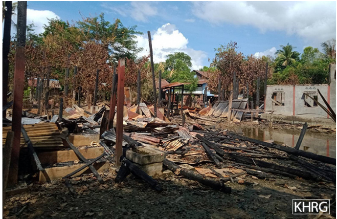
ဤဓာတ်ပုံများအား ၂၀၂၄ ခုနှစ်၊ ဇန်နဝါရီလ ၁၀ ရက်တွင် တောအူးခရိုင်၊ ထောတထူမြို့နယ်၊ ဒေးလိုမူနီအုပ်စု၊ ဗမာ---ကျေးရွာတွင် မှတ်တမ်းတင်ခဲ့ခြင်းဖြစ်သည်။ ဓာတ်ပုံတွင် SAC (ခလရ-၃၉) မှ တပ်သားများ၏ မီးရှို့ဖျက်ဆီးထားခြင်းကိုခံရသည့် ရွာသားများ၏နေအိမ်များကို ဖော်ပြထားခြင်းဖြစ်သည်။

အမှတ်(ခလရ-၃၉)မှ တပ်သားများသည် ဗမာ---ကျေးရွာသို့ ဝင်ရောက်ခဲ့ပြီး ရွာသားများ၏နေအိမ်များအား မီးရှို့ခဲ့သည်။ နောက်တစ်နေ့ ၂၀၂၃ ခုနှစ်၊ နိုဝင်ဘာလ ၂၀ ရက်နေ့တွင် SAC (ခလရ-၃၉)နှင့် ပူးပေါင်းတပ်များသည် ဗမာ--- ကျေးရွာသို့ဝင်ရောက်ကာ ယာယီစခန်းချနေထိုင်ခဲ့သည်။ ထို့နောက် ၂၀၂၃ ခုနှစ်၊ ဒီဇင်ဘာလ ၉ ရက်နေ့တွင် SAC တပ်သည် ကျေးရွာအတွင်းမှ ပြန်လည်ထွက်ခွာသွားခဲ့ကြသည်။ သို့သော် ၂၀၂၃ ခုနှစ်၊ ဒီဇင်ဘာလ ၁၁ ရက်နေ့တွင် ၎င်းတို့သည် ကျေးရွာအတွင်းသို့ ထပ်မံ၍ ပြန်လည်ဝင်ရောက်လာကာ ရွာသားတစ်ဦး၏ နေအိမ်(၁)လုံးအား မီးရှို့ခဲ့ကြသည်။ သို့ဖြစ်၍ SAC ၏ မီးရှို့ဖျက်ဆီးမှုကြောင့် ရွာသားများ၏ နေအိမ် စုစုပေါင်း(၉)လုံး ဖျက်ဆီးဆုံးရှုံးခဲ့