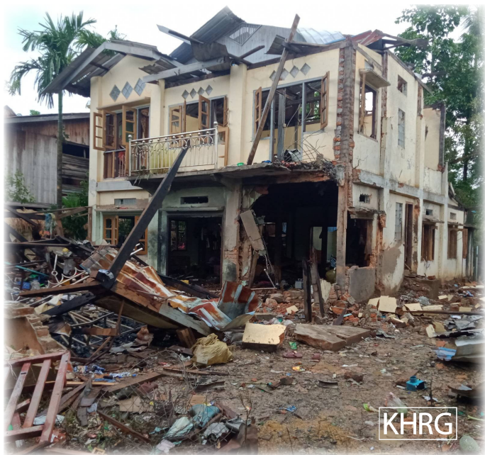
ဤပုံကို၂၀၂၃ ခုနှစ်၊ စက်တင်ဘာလ ၄ ရက်နေ့တွင် ခလယ်လွီထူခရိုင်၊ မူးမြို့နယ်၊ ငါးထွေစုပိအုပ်စု၊ ခပ--- ကျေးရွာတွင် ရိုက်ကူးခဲ့ပါသည်။ စစ်ကောင်စီစစ်လေယာဉ် (၂) စင်းနှင့် ရဟတ်ယာဉ် (၂) စင်းသည် ခြေပုံ (ငါးထွေစုပိ) ကျေးရွာတွင် လေကြောင်းဖြင့်တိုက်ခိုက်ခဲ့သောကြောင့် ပြည်သူများ၏အိုးအိမ်များ ပျက်စီးသွားသည့်ပုံဖြစ်သည်။

၂၀၂၄ ခုနှစ်၊ ဖေဖော်ဝါရီလ ၂၅ ရက် နေ့လည် ၁:၁၀ မိနစ်အချိန်တွင် SAC သည် ဂျက်လေယာဉ် ၅ စင်း၊ ရဟတ်ယာဉ်တစ်စင်းဖြင့် ခလယ်လွီထူခရိုင်၊ လယ်ဒိုမြို့နယ်အတွင်း (၂)ကြိမ် လာရောက်ပစ်ခတ်တိုက်ခိုက်ခဲ့သည်။ ထိုပစ်ခတ်တိုက်ခိုက်ခံရသည့်နေရာများမှာ လယ်ဒိုမြို့နယ်၊ ပဒဲကောကျေးရွာအုပ်စု၊ ခပ---ကျေးရွာအနီးရှိ ရဲစခန်းနှင့် KNLA တပ်ရင်း(၉)အခြေစိုက်ရာ ကျွန်းတောနေရာများဖြစ်ပြီး စုစုပေါင်းတိုက်ခိုက်မှု ၁၆ ကြိမ် ပြုလုပ်ခဲ့သည်။ ထိုလေကြောင်း ပစ်ခတ်တိုက်ခိုက်မှုများကြောင့် အရပ်သား (၁၄) ဦး ထိခိုက်ဒဏ်ရာရရှိခဲ့ပြီး (၁) ဦး သေဆုံးခဲ့သည်။ ထိခိုက်ဒဏ်ရာရရှိသူများနှင့် သေဆုံးသူသည် ရဲ စခန်းအတွင်း အကျဉ်းချခံထားရသူများဖြစ်သည်။ ကလောမော်ခိုကျေးရွာအုပ်စု၊ ခပ---