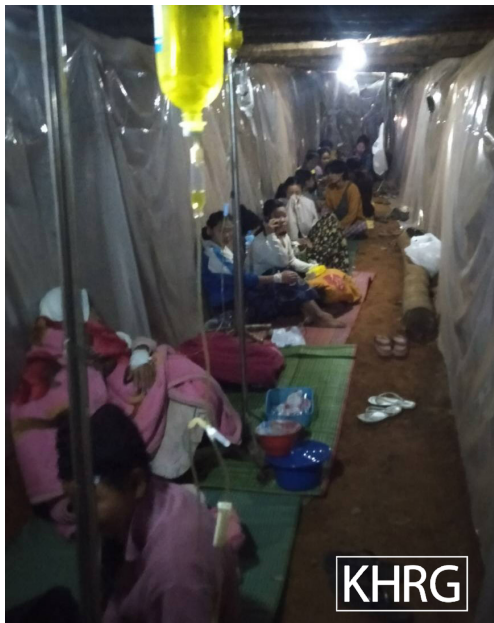
ဤပုံကို ၂၀၂၃ခုနှစ်၊ ဒီဇင်ဘာလ ၃၁ ရက် နေ့၌ ဒူးပလာယာခရိုင်၊ ဘားအံမြို့နယ်၊ ဟတ ရယ်အုပ်စုရှိ ဂမ--- ဆေးရုံတွင် ရိုက်ကူးခဲ့ ပါသည်။ ပုံတွင် SAC ၏လေကြောင်းတိုက် ခိုက်မှုကြောင့် ဆေးရုံ ရှိလူနာများ တွင်းထဲ တွင် ခိုအောင်းနေပုံ ဖြစ်ပါသည်။ (ဇာတ်ပုံ - KHRG)

၂၀၂၃ ခုနှစ်၊ နိုဝင်ဘာလ ၂ ရက်နေ့တွင် SAC သည် ဒူးပလာယာခရိုင်၊ နို့တကောမြို့နယ်၊ နို့တကောကျေးရွာအုပ်စု၊ ဂလ---ကျေးရွာသို့ လက် နက်ကြီးရမ်းသမ်းပစ်ခတ်ခဲ့ရာ စောကဂ--- ၏ဒူးခေါင်းကို ထိခိုက်ခဲ့ သည်။ ထိုအချိန်တွင် ဆေးကုသမှုခံယူနိုင်ရန်ခက်ခဲပုံကို ၎င်း၏ဖခင်က “ကျွန်တော့သား ဒဏ်ရာရတဲ့အချိန်မှာ ပထမဆုံး နို့တကောမြို့နယ်၊ နို့တကောကျေးရွာအုပ်စု၊ ဂရ--- ကျေးရွာမှာရှိတဲ့ ဂဝ---ဆေး ခန်းကို သွားပြခဲ့တယ်။ ဒါပေမဲ့လည်း အဲဒီဆေးခန်းက ကျွန်တော့သားရဲ့ဒဏ် ရာကို မကုသပေးနိုင်ဘူး။ အဲ့ဒါနဲ့ အဲ့ဒီဆေးခန်းမှာရှိတဲ့ ကျန်းမာရေး ဝန်ထမ်းတစ်ဦးက ကရူတူး(ကျိုဒိုး)မြို့နယ်၊ ဝင်းကကျေးရွာအုပ်စု၊ ဂသ --- ကျေးရွာမှာရှိတဲ့ KDHW စီမံခွဲမှုဆေးခန်းကို ဆက်သွယ်ပေးခဲ့ တယ်။ အဲ့ဒီဆေးခန်းနှစ်လုံးစလုံးမှာ လိုအပ်တဲ့ဆေးဝါးပစ္စည်းတွေနဲ့ ဆေးပညာရပ်ဆိုင်ရာကျွမ်းကျင်မှုတွေ အားနည်းတဲ့အတွက်ကျွန်တော့ သားကိုကုသလို့မရဘူး။ နောက်ဆုံးတော့ ကျွန်တော့သားကို ကော်တ ရီမြို့နယ်၊ သုံးဆယ့်သုံးဆူကျေးရွာအုပ်စုရှိ ဂဟ--- ဆေးရုံကို ပို့လိုက် ရတယ်။ ဆေးကုသမှုစရိတ်နဲ့သွားလာရေးစရိတ်ကတော့ (၁၀)သိန်း လောက်ကုန်ကျတယ်” ဟုဖော်ပြထားပါသည်။ ဤကဲ့သို့ ဆေးဝါး ထောက်ပံ့မှုမလုံလောက်ခြင်း၊ ကုန်ကျစရိတ်များခြင်းနှင့် လက်နက်ကြီး ရမ်းသမ်းပစ်ခတ်ခြင်းကြောင့်ရွာသားအများစုမှာ ဆေးဖက်ဝင်အပင် များကို စိုက်ပျိုးကြပြီး ထိုဆေးဖက်ဝင်အပင်များကိုသာ မှီခိုသုံးစွဲကြရ သည်။