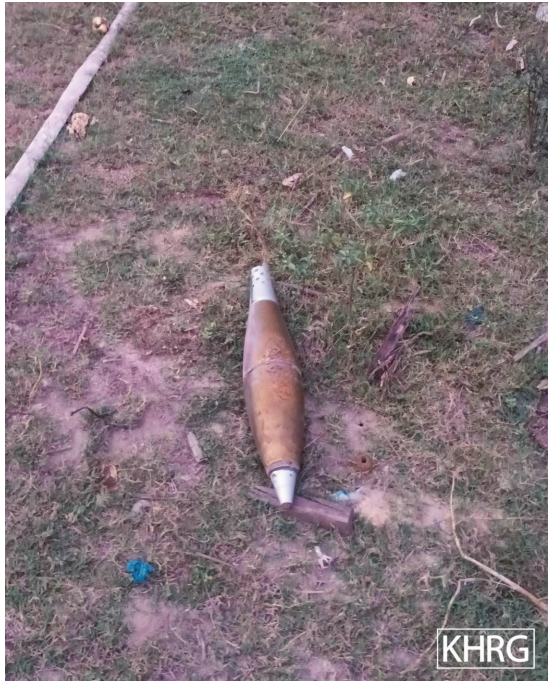
အထက်ပါပုံများကို ၂၀၂၂ ခုနှစ်၊ မတ်လ ၂၃ ရက်နေ့ ဒူးပလာယာခရိုင်၊ ကရူတူးမြို့နယ်၊ ငါးပြင်မကျေးရွာအုပ်စု၊ တောင်ကြာအင်းကျေးရွာတွင် ရိုက်ယူခဲ့သည်။ ဤပုံများကို တောင်ကြာအင်းကျေးရွာအတွင်း SAC မှ လက်နက်ကြီးရမ်းသမ်းပစ်ခတ်ခဲ့ပြီးရိုက်ယူခဲ့ခြင်းဖြစ်သည်။ ပုံတွင် လက်နက်ကြီးပစ်ခတ်မှုကြောင့်ထိခိုက်ပျက်စီးသွားခဲ့သောအိမ်တစ်လုံးနှင့် မပေါက်ကွဲဘဲကျန်ရှိနေသည့်လက်နက်ကြီးကျည်တစ်လုံးကိုပြထားပါသည်။

မေးခွန်းဖြေကြားသူအများစုက ဤနည်းဗျူဟာ၏သက်ရောက်မှုအချို့ကို SAC မှ ခရီးသွားလာမှုကန့်သတ်ခြင်းနှင့် ၎င်းတို့၏ စစ်ဆေးရေးဂိတ်များတွင် ရွာသားများ၏ပစ္စည်းဥစ္စာများကို လုယက်ခိုးယူခြင်းများအားဖြင့် ဖော်ပြကြသည်။ ရွာသားများအနေဖြင့် ဒေသခံလက်နက်ကိုင်တပ်ဖွဲ့များအားပံ့ပိုးပေးသည်ဟု စစ်သားများကသံသယရှိသောကြောင့် ၎င်းတို့အနေဖြင့် မကြာခဏဆိုသလို ဆန်ပမာဏအမြောက်အများသယ်ယူပို့ဆောင်ခွင့်မရကြပါ။ 34 မူကြော်ခရိုင်၊ ဒွယ်လိုးမြို့နယ်၊ မထောကျေးရွာအုပ်စု၊ ဘဘ---