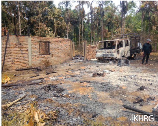
ဤပုံကို ၂၀၂၂ ခုနှစ်၊ ဧပြီလ ၈ ရက်နေ့ ဘိတ်-ထားဝယ် ခရိုင်၊ သရက်ချောင်းမြို့နယ်၊ မယ်ကဲကျေးရွာအုပ်စု၊ မယ်ကဲကျေးရွာတွင်ရိုက်ယူခဲ့သည်။ ပုံတွင် SAC မှ ရွာသားများအိမ်၊ ကားနှင့်ပိုင်ဆိုင်မှုများကို မီးရှို့ဖျက်ဆီးထားသော အခြေအနေကို ဖော်ပြထားသည်။

စစ်ဘက်ဆိုင်ရာလိုအပ်ချက်များမပြည့်စုံသည့် SAC စစ်သားများသည် ၎င်းတို့၏လိုအပ်ချက်များအတွက် လုံလောက်သောအထောက်အပံ့များမရှိပါက ရွာသားများ၏ပိုင်ဆိုင်မှုများကို သိမ်းယူကြသည်။ ဥပမာအားဖြင့် ၂၀၂၁ ခုနှစ်၊ ဧပြီလ ၇ ရက်နေ့တွင် SAC ၏ ခြေလျင်တပ်ရင်း အမှတ် ၄၀၇ မှ မူကြော်ခရိုင်၊ ဒွယ်လိုးမြို့နယ်၊ လေးဖိုးထကျေးရွာအုပ်စု၊ အ--- ကျေးရွာမှ ဆန်၊ ငွေကြေး၊ ဖုန်းတစ်လုံးနှင့် အခြားပစ္စည်းများခိုးယူခဲ့သည်။ အဘယ်ကြောင့်ဆိုသော် KNLA ၏ လမ်းပိတ်ဆို့ထားမှုကြောင့် ၎င်းတို့အနေဖြင့် ရိက္ခာမရရှိသောကြောင့်ဖြစ်သည်။ 60 အလားတူ ဖြစ်ရပ်တစ်ခုမှာ တောအူးခရိုင်၊ ထောတထူမြို့နယ်၊ ပယ်ထီးဒေသ၊ ဘဇ--- ကျေးရွာမှ ရွာသားတစ်ဦးဖြစ်သော စောအဇ--- က ၂၀၂၂ ခုနှစ်၊ ဒီဇင်ဘာလတွင် ဆယ်ကျော်သက်လူငယ်တစ်ဦးသည် အဓမ္မဖမ်းဆီးခံရပြီး ၎င်း၏မိဘများက ၎င်းအားထောင်ဝင်စာသွားတွေ့သည့်အချိန်တွင် “[SAC မှ ၎င်းတို့အားပြောခဲ့သည်မှာ] ခင်ဗျားတို့တွေ ခင်ဗျားတို့သားကို ပြန်လွှတ်စေချင်ရင် ငွေကျပ် ၈၀၀၀၀ ယူလာရမယ်။ ဒါဆို ကျွန်တော်တို့ ခင်ဗျားသားကို လွှတ်ပေးမယ်လို့ပြောတယ်။ ကျွန်တော် ထင်တာကတော့ SAC အနေနဲ့ [ဝင်ငွေရရှိဖို့] တခြားနည်းလမ်းမရှိတော့ဘူး။ ဒါကြောင့် သူတို့က အစားအသောက်ဝယ်ယူနိုင်ဖို့အတွက် ဒီလိုပဲ [ငွေရရှိဖို့ အကုန်လုပ်ကြတယ်] ငွေရှာရတယ်။ သူတို့က လူငယ်တွေကိုပဲဖမ်းတယ်။” ဟု KHRG သို့ တင်ပြခဲ့သည်။ ဤသို့သောချိုးဖောက်မှု