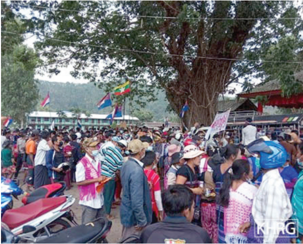
ဤပုံကို ၂၀၂၁ ခုနှစ်၊ ဖေဖော်ဝါရီလအတွင်း တိတ်-ထားဝယ်ခရိုင်၊ တနောသရီမြို့နယ်၊ ဘင--- မြို့တွင် ရိုက်ယူခဲ့သည်။ ပုံတွင် ဒေသခံပြည်သူများက စစ်အာဏာသိမ်းမှုကို ဆန့်ကျင်ဆန္ဒပြနေကြသည်။ ဆန္ဒပြပွဲပြီးနောက်ရက်အနည်းငယ်အကြာတွင် SAC စစ်သားများသည်ဆန္ဒပြသူများကိုဖမ်းဆီးခဲ့သည်။

သို့ပြုလုပ်ခြင်းသည် အဓမ္မဖမ်းဆီးထိန်းသိမ်းခြင်းဖြစ်ပြီး ၎င်းကို လူ့အခွင့်အရေးဥပဒေ 26 နှင့်နိုင်ငံတကာ လူသားချင်းစာနာထောက်ထားမှုဥပဒေများတွင် တားမြစ်ထားသည်။ 27 အဓမ္မဖမ်းဆီးခြင်းသည် ရောမဥပဒေ၏ ပုဒ်မ ၈(၂)(က)(ဇ) အရ စစ်ရာဇဝတ်မှုမြောက်ပြီး အရပ်သားများအား ကျယ်ကျယ်ပြန့်ပြန့်စနစ်တကျတိုက်ခိုက်ခြင်းသည် ရောမဥပဒေ၏ ပုဒ်မ ၇(၁)(င) အရ လူသားမျိုးနွယ်စုအပေါ်ကျူး လွန်သည့် ရာဇဝတ်မှုမြောက်သည်။