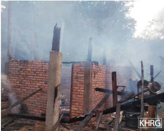
ဤပုံကို ၂၀၂၂ ခုနှစ်၊ ဧပြီလ ၇ ရက်နေ့ ဘိတ်-ထားဝယ် ခရိုင်၊ သရက်ချောင်းမြို့နယ်၊ မယ်ကဲကျေးရွာအုပ်စု၊ ကျောက်အိုင်ကျေးရွာတွင် ရိုက်ယူခဲ့သည်။ ပုံတွင် SAC မှ ရွာသားများအိမ်နှင့် ပစ္စည်းဥစ္စာများကိုမီးရှို့ဖျက်ဆီးထားသော အခြေအနေကို ဖော်ပြထားသည်။

ဆိုင်ကယ်နှစ်စီးသာဖမ်းဆီးရန် လိုအပ်သည်။ 59 ခလယ်လို့ထူခရိုင်၊ မူးမြို့နယ်၊ ဘဟ--- ကျေးရွာအုပ်စု၊ ဘဟ--- ကျေးရွာမှ ရွာလူကြီးတစ်ဦးဖြစ်သော စောအဟ--- က ဤသို့တင်ပြခဲ့သည်။ “လက်ရှိမှာ သူတို့က ရွာသားတွေစီးတဲ့ ဆိုင်ကယ်တွေကိုသိမ်းယူတယ်။ သူတို့က ခင်ဗျားရဲ့ဆိုင်ကယ်ကိုယူသွားပြီဆိုရင် သူတို့နဲ့ ညှိနှိုင်းလို့မရတော့ဘူး။”