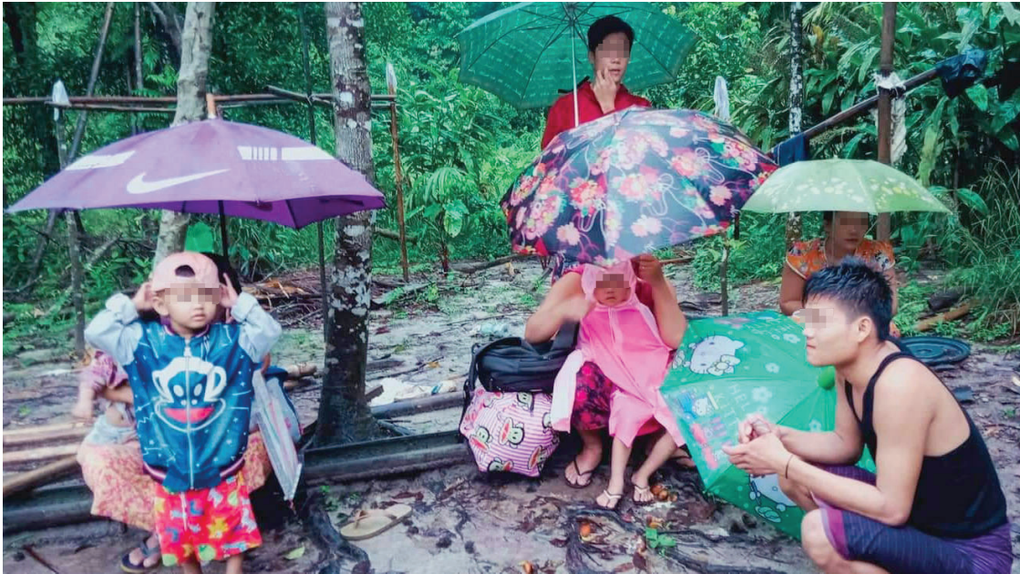
ဤပုံကို ၂၀၂၂ ခုနှစ်၊ ဇူလိုင်လ ၁၅ ရက်နေ့တွင် ရိုက်ယူခဲ့သည်။ ပုံတွင် SAC နှင့် PDF၊ KNDO ပူးပေါင်းတပ်ဖွဲ့များတို့အကြား တိုက်ပွဲများပိုမိုဖြစ်ပွားခြင်းနှင့် ဒေသအတွင်း SAC မှ လက်နက်ရမ်းသန်းပစ်ခတ် မှုများကြောင့် ဘိတ်-ထားဝယ်ခရိုင်၊ လယ် မူလား (ပုလော) မြို့နယ်၊ ဘည---ကျေးရွာမှ ရွာသားများသည် ၎င်းတို့ရွာမှ ထွက်ပြေးတိမ်းရှောင်နေရသောအခြေအနေကို ဖော်ပြထားသည်။

ထိုင်သူရွာသားများသည် တောထဲတွင်ပုန်းခိုနေစဉ် ၎င်းတို့အစွမ်းရှိသလောက် တတ်နိုင်သမျှ ပညာရေး အားဆက်လက်သင်ယူကြသည်။ 76 ရွာသားအများစုသည် SAC မှ ၎င်းတို့အပေါ် တိုက်ခိုက်နေမှုများ ကြောင့် အထူးသဖြင့်၎င်းတို့၏အသက်မွေးဝမ်းကျောင်းလုပ်ငန်းများအတွက် အလုပ်လုပ်ရာတွင် အခက် အခဲရှိကြောင်းကိုဖော်ပြခဲ့ကြသည်။