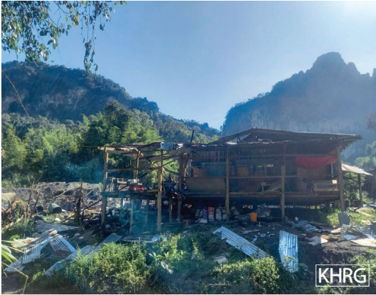
ဤပုံတွင် ၂၀၂၂ ခုနှစ်၊ နိုဝင်ဘာလတွင် SAC မှ ဒူးပလာ ယာခရိုင်၊ ကော်တရီမြို့နယ်တွင် လေကြောင်းတိုက်ခိုက်မှုနှင့် လက်နက်ကြီးရမ်းသမ်းပစ်ခတ်မှု ပြုလုပ်ခဲ့ခြင်းကြောင့် လူနေအိမ်တစ်လုံးထိမှန်၍ ပျက်စီးသွားခဲ့သော အခြေအနေကိုဖော်ပြထားပါသည်။