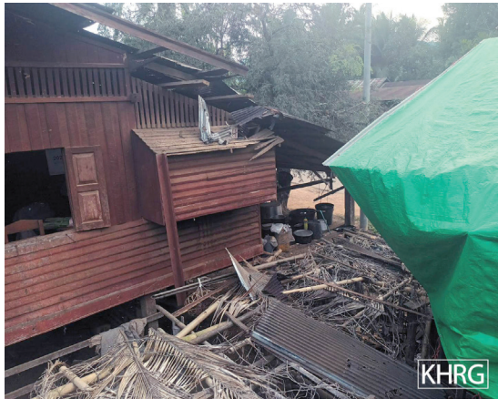
ဤပုံကို ၂၀၂၂ ခုနှစ်၊ မတ်လ ၂၄ ရက်နေ့ နူးပလာယာခရိုင်၊ ကော်တရီမြို့နယ်၊ နို့ဖိုးကျေးရွာအုပ်စု၊ ထီးမူးထကျေးရွာတွင်ရိုက်ယူခဲ့သည်။ ပုံတွင် မတ်လ ၂၄ ရက်နေ့၌ တိုက်ပွဲဖြစ်ပွားနေစဉ်အတွင်း SAC ခမရ (၃၅၅)မှ လက်နက်ကြီးရမ်းသမ်းပစ်ခတ်ခဲ့၍ လူနေအိမ်တစ်လုံးအား ထိမှန်၍ ပျက်စီးခဲ့သောပုံကို ပြထားပါသည်။ ထို့အပြင် အသက် (၁၇) နှစ်အရွယ်မိန်းကလေးတစ်ဦးကို လက်နက်ကြီးထိမှန်၍သေဆုံးခဲ့ပြီး အခြားရွာသားသုံးဦးလည်းထိခိုက်ဒဏ်ရာရရှိခဲ့သည်။

သည်။ ရမ်းသမ်းတိုက်ခိုက်မှုများသည် စစ်ပွဲဆိုင်ရာဥပဒေအရ တရားဝင်မှုမရှိသည့်အပြင် စစ်ရာဇဝတ်မှုလည်း မြောက်နိုင်သည်။ 37 အရပ်သားများနှင့် စစ်ရေးပစ်မှတ်များအား ခွဲခြားခြင်းမရှိပဲလက် နက်ကြီးများပစ်ခတ်ခြင်းနှင့် လေကြောင်းတိုက် ခိုက်မှုများသည် နိုင်ငံတကာ လူသားချင်းစာနာထောက်ထားမှုဥပဒေ 38 ၏ အသေးစိတ်အချက်အလက်များအား ချိုးဖောက်ခြင်းဖြစ်သည်။ ထို့အပြင် ငတ်မွတ်မှုဒဏ်ခံစားရနိုင်သည့် ဆင်းရဲသောနေရာများတွင် အစားအစာသိုလှောင်မှုအား ရည်ရွယ်ချက်ရှိရှိကန့်သတ်ခြင်းသည် အစားအစာလုံလောက်စွာရရှိခွင့် 39 ကို လေးစားလိုက်နာရမည့်အစိုးရ (သို့မဟုတ် အစိုးရအဖြစ်တာဝန်ယူမည့် အဖွဲ့အစည်း) ၏တာဝန်အား ပျက်ကွက်ခြင်းဖြစ်သည်။ အကယ်၍ အရပ်သားပြည်သူများအား ငတ်ပြတ်စေနိုင်သည်အထိ အခြေအနေဆိုးရွားလာပါက ဤတားမြစ်ပိတ်ပင်မှုများသည် ဓလေ့ထုံးတမ်းဆိုင်ရာ နိုင်ငံတကာလူသားချင်းစာနာမှုဥပဒေအား ဆိုးရွားစွာချိုးဖောက်နေခြင်းဖြစ်သည်။ 40