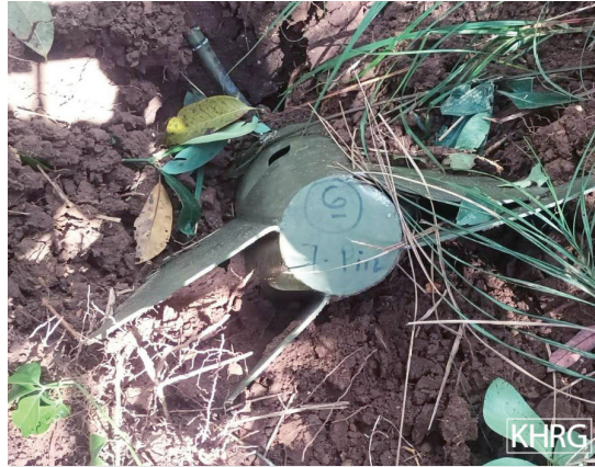
ဤပုံကို ၂၀၂၂ ခုနှစ်၊ ဒီဇင်ဘာလ ၁၆ ရက်နေ့တွင် ရိုက်ယူခဲ့သည်။ ပုံတွင် ၂၀၂၂ ခုနှစ်၊ ဒီဇင်ဘာလ ၁၅ ရက်နေ့၌ တောအူးခရိုင်၊ ထောတထူမြို့နယ်အတွင်း SAC မှ လေကြောင်းဖြင့် ဗုံးကြဲတိုက်ခိုက်ပြီးနောက်တွင် မပေါက်ကွဲဘဲ ကျန်ရှိနေသောဗုံးတစ်လုံးကို ဖော်ပြထားသည်။