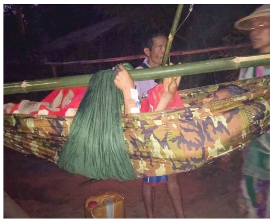
တိုက်ပွဲဖြစ်ပွားပြီးနောက်တွင် ခလရ (၇၅) မှ SAC စစ်သားများသည် လက်နက်ကြီးတစ်လုံးပစ်ခတ်ခဲ့၍ စောအာ---အား လက်နက်ကြီးအပိုင်းအစ ထိမှန်ခဲ့ပြီးဒဏ်ရာရရှိခဲ့သည်။ ဤပုံကို ၂၀၂၁ ခုနှစ်၊ ဒီဇင်ဘာလ ၈ ရက်နေ့ ခလယ်လွီထူခရိုင်၊ လယ်ဒိုမြို့နယ်၊ ဃဲဒဲကျေးရွာအုပ်စု၊ ဘည---ကျေးရွာတွင် ရိုက်ယူခဲ့သည်။ ဒဏ်ရာရရှိခဲ့သည့်စောအာ---ကို မူကြော်ခရိုင်ရှိ ဆေးရုံတစ်ခုသို့ ပို့ဆောင်ခဲ့သည်။ လက်နက်ကြီးပစ်ခတ်မှုကြောင့် ကလေးငယ်နှစ်ဦးလည်း ထိခိုက်ဒဏ်ရာရရှိခဲ့သည်။