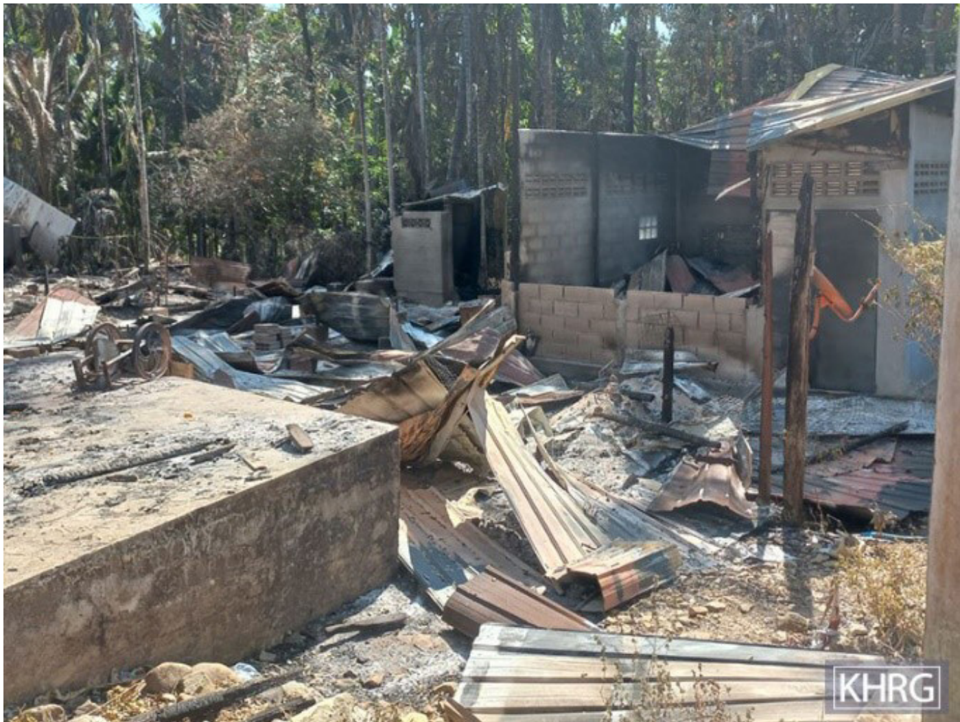
အထက်ပါပုံများကို ၂၀၂၃ ခုနှစ်၊ ဇွန်လ ၁၀ ရက်နေ့တွင် ဘိတ်-ထားဝယ်ခရိုင်၊ လယ်ဒိုစိုးမြို့နယ်၊ ထီးလယ်ကလေးဒေသ၊ ဝါကူကျေးရွာတွင် ရိုက်ယူခဲ့ပါသည်။ ဤပုံများသည် ထားဝယ်မြို့အခြေစိုက် SAC ခမရ အမှတ် (၂၆၇)မှ ၂၀၂၃ ခုနှစ်၊ ဇွန်လ ၈ ရက်နေ့ နံနက် ၇း၀၀ နာရီခန့်တွင် ဘိတ်-ထားဝယ်ခရိုင်၊ လယ်ဒိုစိုးမြို့နယ်၊ ထီးလယ်ကလေးဒေသ၊ ဝါကူကျေးရွာရှိ အိမ်ခြေ(၁၃)အိမ်နှင့် ရွာသားများလုပ်ကိုင်စားသောက်ရာနေရာအချို့ကိုပါ မီးရှို့ဖျက်ဆီးခဲ့သည့်ပုံများဖြစ်ပါသည်။

၂၀၂၃ ခုနှစ်၊ ဖေဖော်ဝါရီလ ၁၀ ရက်နေ့တွင် မော်လမြိုင်မြို့ရှိ SAC စစ်သားများသည် ဆိပ်ကြီးမြို့ရှိ ဒေသခံခေါင်းဆောင်များနှင့် ဒေသခံဘာသာရေးခေါင်းဆောင်များကို စုဝေးစေကာ ည (၆) နာရီမထွက်ရအမိန့်ကို ပြဌာန်းခဲ့ပါသည်။ မွတ်စလင်ဘာသာဝတ်ပြုကိုးကွယ်သူအနေဖြင့် ည(၆)နာရီမတိုင်ခင် ဝတ်ပြုရန် SAC စစ်သားများ၏ မိန့်ကြားခြင်းခံရပါသည်။ ထို့အပြင် ဘုန်းကြီးများအနေဖြင့် နံနက်(၆)နာရီမတိုင်ခင် စွမ်းထွက်ခံခြင်းမပြုကြရန် မိန့်ကြားခြင်းကိုလည်းခံခဲ့ရပါသည်။ ဘာသာအသီးသီးအနေဖြင့် ဤပြဌာန်းချက်ကို လိုက်နာရမည်ဖြစ်ပြီး လိုက်နာခြင်းမရှိပါက အပြစ်ပေးခံရမည်ဖြစ်ကြောင်း SAC စစ်သားများမှ အမိန့်ပေးခဲ့ပါသည်။ ဤပြဌာန်းချက်ကြောင့် ရွာသားများအနေဖြင့် ကြောက်ရွံ့မှုဖြင့် ကျေးရွာထဲတွင်နေထိုင်နေကြရပါသည်။