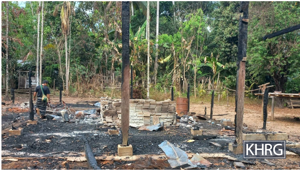
ဤဓာတ်ပုံကို ၂၀၂၃ ခုနှစ်၊ ဇန်နဝါရီလ ၁၇ ရက်နေ့၌ ဒူးပလာယာခရိုင်၊ ဝင်းရေးမြို့နယ်၊ ဆင်ပြေးကျေးရွာအုပ်စု၊ တောင်စွန်းရွာတွင် မှတ်တမ်းတင်ခဲ့ခြင်းဖြစ်သည်။ စစ်ကောင်စီ၏ လေကြောင်းတိုက်ခိုက်မှုကြောင့် အရပ်သားပြည်သူ၏နေအိမ် ထိခိုက်ပျက်စီးသွားသည့်ပုံဖြစ်သည်။

၂၀၂၂ ခုနှစ်၊ အောက်တိုဘာလမှ ၂၀၂၃ ခုနှစ်၊ မတ်လအတွင်း ဘိတ်-ထားဝယ်နှင့် ဘားအံခရိုင်များတွင် SAC ၏ လေကြောင်းတိုက်ခိုက်မှုများ ဖြစ်ပွားခဲ့ခြင်းမရှိခဲ့ပေ။