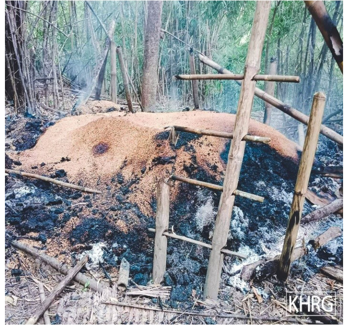
ဤပုံများကို ၂၀၂၂ ခုနှစ်၊ ဒီဇင်ဘာလတွင် ရိုက်ယူခဲ့သည်။ ပုံတွင် SAC တပ်မ (၄၄)မှ မူကြော်ခရိုင်၊ ဘူးသိုမြို့နယ်၊ ခေါဖိုးကျေးရွာအုပ်စု၊ လားဝေါဒဲကျေးရွာ တွင်ရှိသော စပါးကျိုသုံးခုကို မီးရှို့ခဲ့ပြီးနောက် ပြာပုံသာကျန်ခဲ့သည့်အခြေအနေကို ဖော်ပြထားသည်။ လက်ယာမှပုံတွင် စပါးများအားလုံး မီးမလောင်သေးသောအခြေအနေကို ပြထားပါသည်။

SAC စစ်သားများ၏ခြိမ်းခြောက်မှုများနှင့် ကျေးရွာထဲသို့ စစ်သားအလုံးအရင်းလိုက်ဝင်ရောက်လာချိန်တွင် ရွာသားများအလွန်ကြောက်ရွံ့ကြသဖြင့် ထွက်ပြေးတိမ်းရှောင်ရာတွင် ၎င်းတို့၏ပစ္စည်းဥစ္စာများစွာ ဆုံးရှုံးပျက်စီးခဲ့ရပါသည်။ ၂၀၂၂ ခုနှစ်၊ နိုဝင်ဘာလတွင် ထားဝယ်မြို့သို့ရောက်ရှိလာသည့် ခမရ အမှတ် (၂၅) မှ စစ်သားဦးရေ ၁၀၀ ကျော်သည် ဝါကူကျေးရွာရှိ ရွာသားများ၏နေအိမ်တွင်အိပ်ကြသောကြောင့် ရွာသားများသည် တောထဲတွင်ထွက်ပြေးတိမ်းရှောင်ခဲ့ရပါသည်။ ရွာသားများထွက်ပြေးတိမ်းရှောင်နေရသည့်အချိန်တွင် SAC စစ်သားများမှ ၎င်းတို့ကျန်ရှိသော အစားအစာနှင့် အသုံးပြု၍ရသော အခြားသောပိုင်ဆိုင်မှုများဖြစ်သည့် အဝတ်အစားနှင့် အိုးခွက်ပန်းကန်များကိုပါ ယူဆောင်သွားခဲ့ကြပါသည်။ နောက်နေ့မနက်ပိုင်းမှသာ SAC စစ်သားများသည် ကျေးရွာမှထွက်ခွာခဲ့ကြပါသည်။ သို့သော် ကျေးရွာထဲသို့ပြန်လာနေထိုင်ကြသော ရွာသားများအဖို့မူ ထမင်းဟင်းချက်ရန်အတွက် အစားအစာနှင့် အိုးခွက်ပန်းကန်များမရှိတော့သဖြင့် အခက်အခဲများဖြင့်ကြုံတွေ့နေကြရပါသည်။