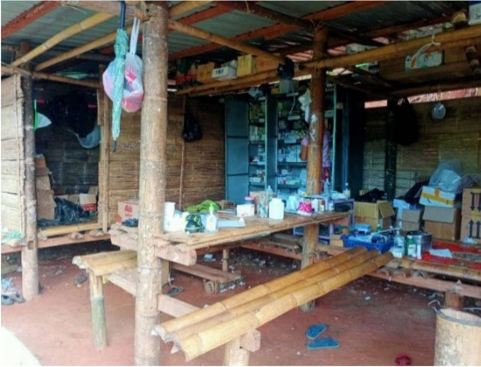
ဤဓာတ်ပုံကို ၂၀၂၁ ခုနှစ်၊ ဩဂုတ်လ ၃၂ ရက်နေ့၊ တောအူးခရိုင်၊ ဒေါဖခိုမြို့နယ်၊ စ---ရွာနှင့် ခ---ရွာအကြားနေရာတွင် ရိုက်ယူခဲ့ပါသည်။ဤဓာတ်ပုံသည် ဒေသခံခေါင်းဆောင်များ KNU နှင့် CDM ပါဝင်သော ကျန်းမာရေးလုပ်သား ဆရာ/ဆရာမများမှ ဦးစီးဦးဆောင်သော ဆေးခန်း၏ပုံဖြစ်သည်။