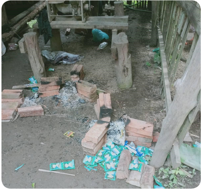
အထက်ပါပုံများကို ၂၀၂၁ ခုနှစ်၊ ဩဂုတ်လ ၂၈ ရက်နေ့ ခူးပလယာခရိုင်၊ နို့တကောမြို့နယ်၊ နို့တော်ပလိုက်ကျေးရွာအုပ်စုတွင် ရိုက်ယူခဲ့သည်။ ပုံများတွင် ဩဂုတ်လ ၂၆ ရက်နေ့၌ ဒေသခံရွာသားများ တောထဲသို့ထွက်ပြေးနေချိန်တွင် SAC ခလရအမှတ်(၃၂)မှ ရွာသားတစ်ဦး၏ အိမ်တွင် လာရောက်တည်းခိုပြီး ချက်ပြုတ်စားသောက်သည့်အပြင် ရွာသား၏ကြက်အကောင်(၄၀)၊ ထမင်းအိုးတစ်လုံး၊ ဖွန်းကြီးနှစ်ချောင်း၊ ဒယ်အိုးနှစ်လုံးနှင့် ပုဂံနှစ်ချပ်တို့ကို ခိုးယူခဲ့သည်။