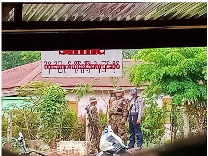
ဤပုံကို ၂၀၂၁ ခုနှစ်၊ မေလ ၂၂ ရက်နေ့တွင် တောအူးခရိုင်၊ ဒေါ်ဖခိုမြို့နယ်၊ လိပ်သိုမြို့ရှိ အထွေထွေမြို့အုပ်ချုပ်ရေးမှူးရုံးနေရာကို ခမရ(၆၀၃)တပ်မှ တပ်စွဲထားသောပုံဖြစ်သည်။

၂၀၂၁ ခုနှစ်၊ ဖေဖော်ဝါရီလ ၁ ရက်နေ့ကမှ မတ်လအထိ တောအူး(တောင်ငူ)ခရိုင်၊ ဒေါ်ဖခို(သံတောင်ကြီး)မြို့နယ်၊ လိပ်သိုမြို့ရှိ စစ်ကွပ်ကဲအခြေစိုက် (စကခ)အမှတ်(၆)လက်အောက်ခံ ခမရအမှတ်(၆၀၃)တပ်သည် လိပ်သိုမြို့ရှိ အထွေထွေမြို့အုပ်ချုပ်ရေးမှူးရုံးနေရာတွင် နေရာယူတပ်စွဲထားပြီး အများပြည်သူသွားလာရန် လမ်းဆုံလမ်းခွဲများနှင့် မြို့အဝင်အထွက်များတွင် စစ်ဆေးရေးဂိတ်ထားရှိပြီး ရွာသူရွာသားများ၏ အသွားအလာများကို စစ်ဆေးမေးမြန်းလျက်ရှိပါသည်။