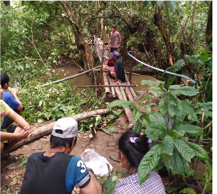
ဤပုံများကို ၂၀၂၁ ခုနှစ်၊ ဩဂုတ်လ ၁၈ ရက်နေ့၌ ဘားအံခရိုင်၊ တာကရဲမြို့နယ်၊ နို့ကွီးကျေးရွာအုပ်စု၊ တကူကရောရွာတွင် ရိုက်ယူခဲ့သည်။ ပုံများတွင် မိုးရွာသီအတွင်း ရွာသားများက ကျောင်းသား/ကျောင်းသူများ ကျောင်းသွားအဆင်ပြေစေရန်အတွက် တံတားဆောက်လုပ်ပေးနေသောပုံဖြစ်သည်။