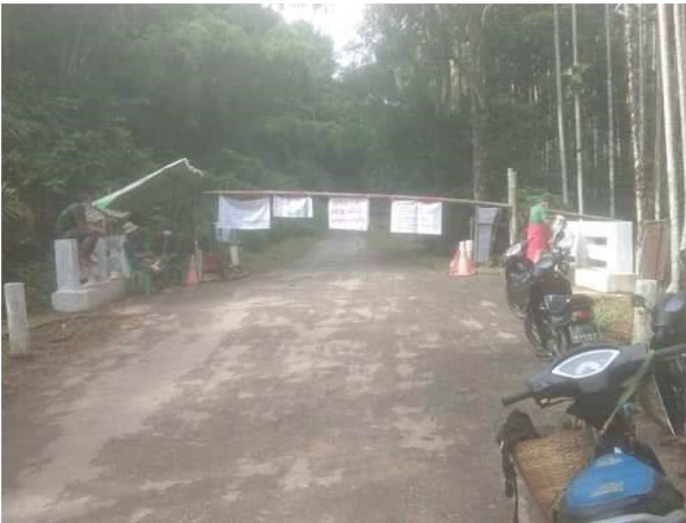
ဤဓာတ်ပုံကို ၂၀၂၁ ခုနှစ်၊ ဇူလိုင်လ ၆ ရက်နေ့၊ တောအူးခရိုင်၊ ဒေါဖခိုမြို့နယ်၊ ကျမဲကျေးရွာအုပ်စု၊ မြသာကျေးရွာတွင် ရိုက်ယူခဲ့ပါသည်။ ဤဓာတ်ပုံသည် ဒေသခံရွာသားများမှ ကိုဗစ်-၁၉ ရောဂါအားကာကွယ် ရန်အတွက် စစ်ဆေးဂိတ်အား တည်ဆောက်ထားသောပုံဖြစ်သည်။