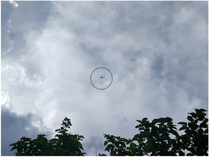
ဤပုံသည် ၂၀၂၁ ခုနှစ်၊ မေလ ၁ ရက်နေ့၌မူတြော်ခရိုင်၊ ဒွယ်လိုးမြို့နယ်၊ မယ်သူးကျေးရွာအုပ်စု၊ ဝ---ကျေးရွာတွင် စစ်ကောင်စီ စစ်လေယာဉ်မှ ကင်းထောက်ပျံပစ်နေသောပုံဖြစ်သည်။

၂၀၂၁ ခုနှစ်၊ ဧပြီလမှ စက်တင်ဘာလအတွင်း မူတြော်ခရိုင်ရှိ ဒွယ်လိုးမြို့နယ်၊ လူသောမြို့နယ်နှင့် ဘူးသိုမြို့နယ်တို့တွင်လည်း စစ်ကောင်စီစစ်လေယာဉ်များမှ ၂ ရက် ၃ ရက်တစ်ကြိမ် ကင်းထောက်ပျံပစ်ကြသည်။