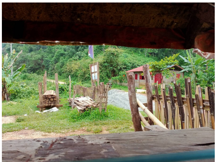
ဤဓာတ်ပုံကို ၂၀၂၁ ခုနှစ်၊ မေလ ၂၁ ရက်နေ့တွင် တောင်ငူခရိုင်၊ သံတောင်ကြီးမြို့နယ်၊ လိပ်သိုမြို့၊ အလယ်ချောင်းကျေးရွာအုပ်စု အ---ကျေးရွာ၊ စစ်ကောင်စီစစ်သားများသည် လမ်းကင်းယူနေသောပုံဖြစ်သည်။

စစ်အာဏာသိမ်းပြီးသည့်နောက် မြန်မာပြည်အရှေ့တောင်ပိုင်းတွင် စစ်ကောင်စီမှ စစ်ရေးလှုပ်ရှားမှုများကို ယခင်ကာလများထက် တိုးချဲ့လုပ်ဆောင်လာခြင်းကြောင့် ထိတွေ့တိုက်ပွဲများ ဖြစ်ပွားခဲ့သည်။ ထိုသို့လုပ်ဆောင်ရာတွင် ၎င်း၏ရှေ့တန်းတပ်စခန်းများသို့ တပ်သား၊ လက်နက်ခဲယမ်းများနှင့် ရိက္ခာဖြည့်တင်းခြင်းပြုလုပ်စဉ် လမ်းလုံခြုံရေးယူခြင်း၊ တပ်သားများလဲလှယ်ခြင်း၊ KNU ထိန်းချုပ်နယ်မြေအတွင်း ဝင်ရောက်ကျူးကျော်ခြင်း၊ အရပ်သားများနေထိုင်ရာဒေသတွင် ကင်းလှည့်ခြင်းများ ပြုလုပ်ခဲ့ကြသည်။ ထို့အပြင် စစ်ကောင်စီမှ စစ်လေယာဉ်နှင့် ဒရုန်းများကိုအသုံးပြု၍ အရပ်သားဒေသများတွင် ကင်းထောက်ခြင်း၊ အရပ်သားများ၏အိမ်နှင့် ဘာသာရေးအဆောက်အအုံများတွင် ဝင်ရောက်နေရာယူခြင်းနှင့် ဒေသခံများ၏ပိုင်ဆိုင်မှုများကို မီးရှို့ဖျက်ဆီးခြင်းများသည် ဒေသခံရွာသားများ၏ လွတ်လပ်စွာသွားလာခွင့်နှင့် အသက်ရှင်နေထိုင်ခွင့်တို့ကို ပိုမိုခြိမ်းခြောက်လျက်ရှိနေသည်။