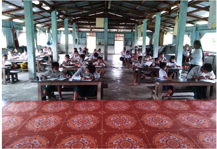
ဤပုံများကို ၂၀၂၁ ခုနှစ်၊ အောက်တိုဘာလ ၅ ရက်နေ့၌ ဘားအံခရိုင်၊ တာကရဲမြို့နယ်၊ နိုးခွီကျေးရွာအုပ်စု၊ တကူကရောရွာတွင် ရိုက်ယူခဲ့သည်။ ပုံများတွင် အစိုးရကျောင်းများပိတ်ထားသော်လည်း ဒေသခံကျောင်းများ ဖွင့်လှစ်ထားသည့်အတွက်ကြောင့် ဒေသခံကျောင်းသား/ကျောင်းသူများ ကျောင်းတွင်စာသင်ယူနေသောပုံ ဖြစ်ပါသည်။