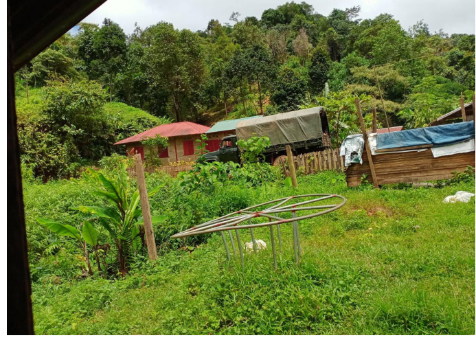
ဤပုံကို ၂၀၂၁ ခုနှစ်၊ ဇွန်လအတွင်း တောင်အူးမှလိပ်သိုမြို့သို့ တက်သွားသည့် စစ်ကောင်စီစစ်ကားပုံကို ရိုက်ယူထားခြင်းဖြစ်သည်။

၂၀၂၁ ခုနှစ်၊ မေလ ၂၂ ရက်နေ့တွင် တောအူးခရိုင်၌ အခြေစိုက်သည့် ခြေမြန်တပ်ရင်းအမှတ်(၆၀၃)မှ စစ်သားအချို့သည် အရပ်ဝတ်ဖြင့် တာပူ(လိပ်သို)မြို့သို့ သွားရောက်၍ လိပ်သိုမြို့ရံစခန်းတွင် တပ်အင်အားသွားရောက်၍ဖြည့်တင်းခြင်းများ ပြုလုပ်ခဲ့သည်။ ထို့အပြင် ၂၀၂၁ ခုနှစ်၊ ဇွန်လတွင်လည်း စစ်ကောင်စီ ခြေမြန်တပ်ရင်းအမှတ်(၆၀၃)တပ်သည် စစ်ကား ၂၂ စီးဖြင့် တပ်သား ၃၀ ဦးခန့်၊ ရိက္ခာများနှင့်ဆေးဝါးများကို လိပ်သိုမြို့ရှိ ၎င်းတို့၏တပ်စခန်းသို့ သယ်ဆောင်သွားခဲ့သည်။ ဒေသခံရွာသားများအနေဖြင့် ထိုစစ်ကောင်စီစစ်သားများသည် မည့်သည့်နေရာမှ ထွက်လာခဲ့သည်ကို အတိအကျမသိသော်လည်း စစ်စခန်းတွင်အင်အားဖြည့်တင်းရန်အတွက် ရောက်ရှိလာသည်ဟု ယုံကြည်ကြသည်။ သို့ဖြစ်သောကြောင့် ဒေသခံရွာသားများမှ မိမိတို့ဒေသတွင် တိုက်ပွဲများပြန်လည်ဖြစ်ပွားမည်ကို ကြောက်ရွံ့နေကြရသည်။