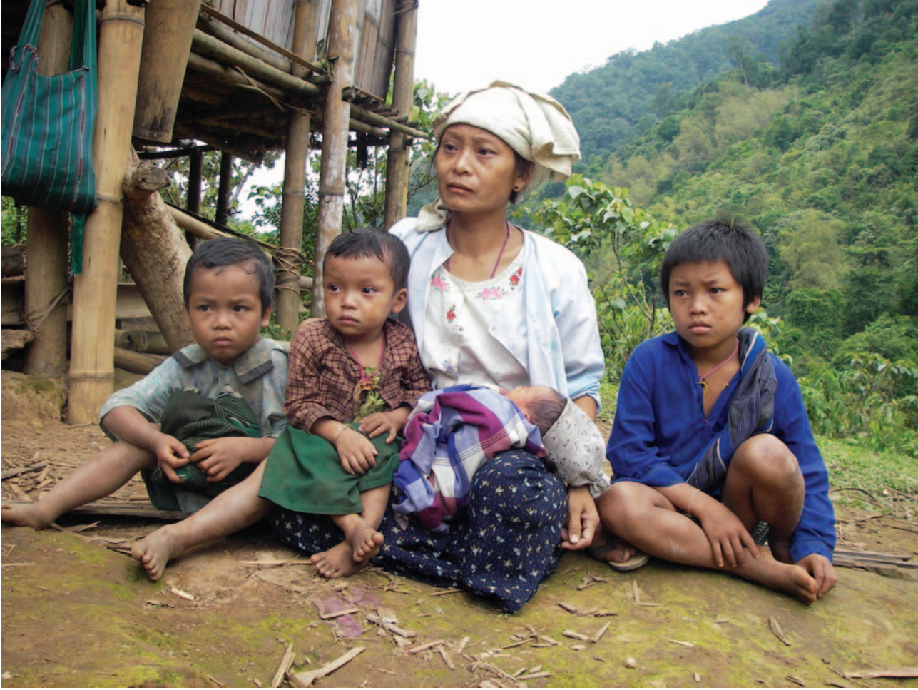
တၢ်ဂီၤအံၤ ဘၣ်တၢ်ဒီးန့ၢ်အီၤဖဲ လၢမ့ၢ် ၂၀၀၆ နံာ် ဖဲလုာ်သီကီၤဆၢ, မ့ၢ်တြၢ်ကီၤရဲာ်အပူၤန့ာ်လီၤ. တၢ်ဂီၤအံၤဟံၤဖျါဖဲ မ့ၢ်ကမဲတဂၤ ဒီးအဖိလွံာ်ဂၤလၢ တၢ်ယုာ်အိာ် ကမ့ၢ်အလီၤတတီၢ်န့ာ်လီၤ. ပိာ်မုာ်အံၤအဝၢန့ာ် ပယီၤသးတဖၣ် ခးသံကွံာ်အီၤ ဖဲ ၂၀၀၆ နံာ်အခါန့ာ်လီၤ. (တၢ်ဂီၤ- KHRG)

ဖဲ ၂၀၁၅ နံာ် တာ်ဆဲးလီၤဖဲ ထံာ်ကီၤဒီဘုာ်တၢ်ပတုာ်တၢ်ခးအလံာ်ယံးယာ် (NCA) န့ာ် ဇးအိာ်ထီာ်ဖဲ တၢ်ဆိတလဲအဂ့ၤတနီၤန့ာ်လီၤ. နီၤတၢ်မၤတၢ်မုာ်တၢ်ခုာ်အကျိၤအကျဲအံၤ အိာ်ကတၢ်ထီၤအသး လၢဆၢကတီၢ်ခဲအံၤအသး တၢ်ကဘျါရဲတၢ်မၤပယုဲပုၤဟီာ်ခိာ်ဖဲ ခွဲယာ်လၢအပူၤကွံာ် လၢအမ့ၢ်တၢ်စံာ်စိၤအအာတဖၣ် ဒီးတၢ်မၤပယုဲလၢကကဲထီာ်သးအသီတဖၣ် လၢကီၤပယီၤမုာ်ထီာ်ကလံၤထံးအပူၤ တုၤအပတီၢ်ဆံးအါလဲာ်န့ာ် တၢ်တသ့ညါအီၤဖျါဖျါဖျါဒီးဘၣ်န့ာ်လီၤ. နီၤနီၤတခီ, တၢ်မၤပယုဲလၢအပူၤကွံာ် အတၢ်ပိာ်ထွဲထီာ်အခဲ သ့တဖၣ် မၤဘၣ်ဒီးဒီးဒါလီၤကတီၢ်ဖိတဖၣ်အတၢ်အိာ်မူကိးန့ၤဒီး ဒီးတကးဒီးဘၣ် တၢ်မၤပယုဲအက့ၢ်ဂီၤလၢအသီတဖၣ်စ့ၢ်ကိး မၤဘၣ်ဒီး လီၤကတီၢ်ဖိတဖၣ် အတၢ်လုာ်အိာ်သးသမူ အမုာ်ကျိၤဖဲကွံာ်ဒိာ်မးန့ာ်လီၤ. လၢတၢ်န့ာ်အယိ ပုၤလၢအတုာ်ဘၣ်တၢ်မၤပယုဲပုၤဟီာ်ခိာ်ဖဲ ခွဲယာ်တဖၣ် ကဒီးန့ၢ်ဘၣ်တၢ်တီတၢ်တြၢ်ဒီးစ့အိာ်လိး လၢအမၤဘၣ်လီာ်ဘၣ်စးက့ၤအဝဲသ့အတၢ်အိာ်မူန့ာ် မ့ၢ်တၢ်လၢအရဲဒိာ်ဒိာ်မးန့ာ် လီၤ. တၢ်ဘၣ်ယိာ်ဘၣ်ဘျီတဖၣ် ဘၣ်တၢ်ဘျါရဲအီၤတုၤလီၤတီၤလီၤအိာ်တအိာ်န့ာ် ထဲဒါပုၤကမျါလၢအတုာ်ဘၣ်တၢ်တဖၣ် ဆၢတၢ်ဝဲသ့န့ာ်လီၤ.