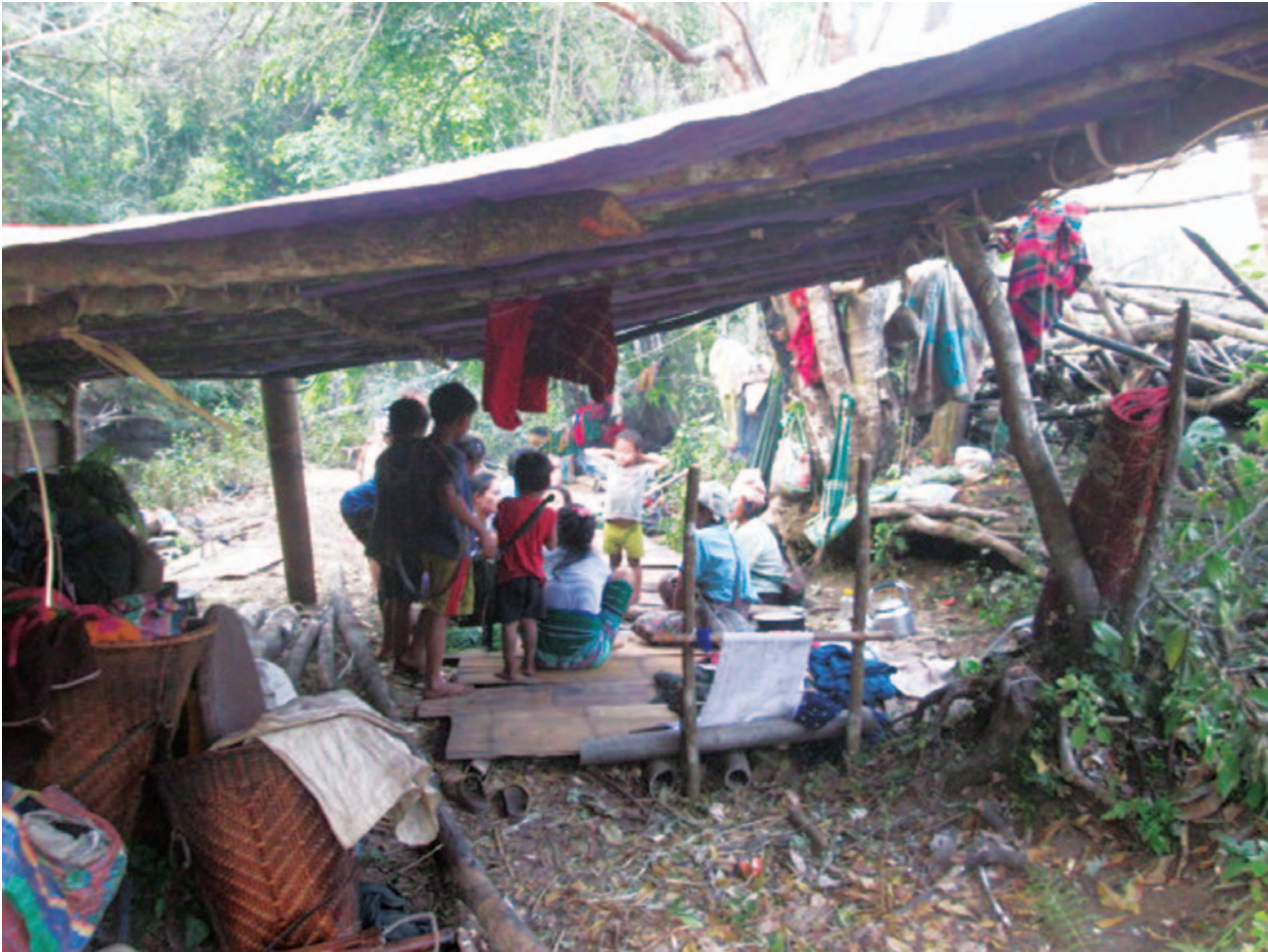
တၢ်ဂီၤတဘျီအံၤ ဘၣ်တၢ်ဒိန့ၣ်အိၣ်ဖဲ လါအုၣ်ဖျါ ၁၅သီ, ၂၀၁၈န့ၣ်, ဖဲ လူၤသီကီၢ်ဆၢ, မုၢ်တြၢ်ကီၢ်ရၣ်အပူၤန့ၣ်လီၤ. တၢ်ဂီၤအံၤဒုးန့ၣ်ဖျါထီၣ်သဝီဖိတဖၣ်ဘၣ်လုာ်မ့ၢ်ဒီး ခိၣ်ဖိလၢ တၢ်ဒုးကဲထီၣ်လၢကီၢ်ပယီၤပဒိၣ်သး ဒီး KNU အယိန့ၣ်လီၤ. တၢ်ဒုးကဲထီၣ်ခိၣ်ဖိလၢကီၢ်ပယီၤသးအါအါဂီၢ် န့ၣ်လီၤတလၢကွံာ်ဝဲလၢ KNU အတၢ်ပဟီၣ်ကဝီၤပူၤ လၢကတုထီၣ်ဝဲသိၣ်လုၣ်ကျဲ အဂီၢ်န့ၣ်လီၤ. သဝီဖိသ့ၣ်တဖၣ်တုထီၣ်ဝဲ တၢ်အိၣ်ကဒုပတြၢ်လီၤဖဲပုၤတတီၤန့ၣ်လီၤ.