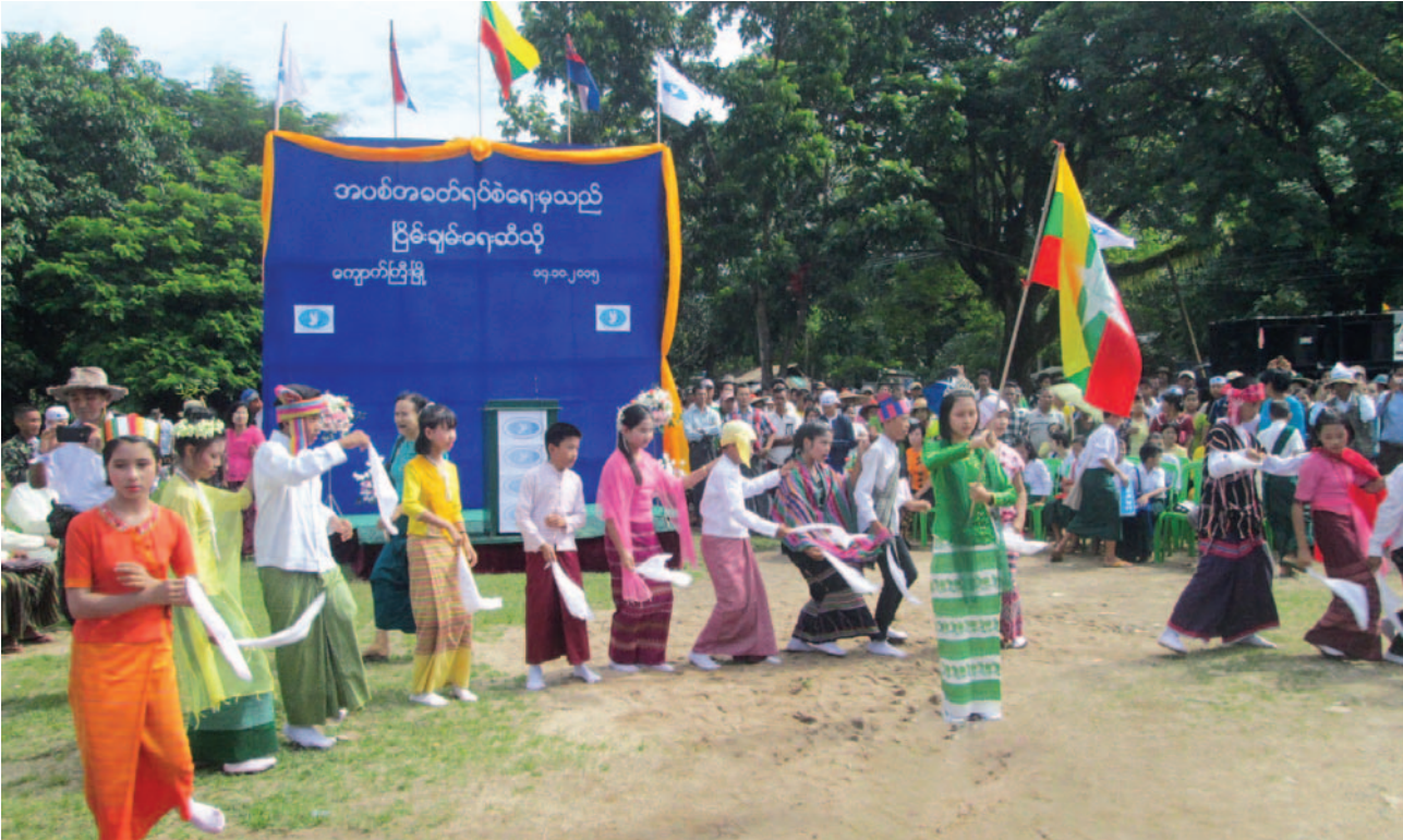
တၢ်ဂီၤတဘျၢ်အံၤဘၣ်တၢ်ဒိန့ၢ်အိၤဖဲ လါအိးကထိဘၣ် ၁၄ သီ, ၂၀၁၅ နံၣ်, လၢလၢၢ်ဒိၣ်တၢ်, လၢၢ်ဒိၣ်ကီၢ်ဆၣ်, ချၢၣ်လွၢ်ထူၣ်ကီၢ်ရၣ်အပူၤန့ၣ်လီၤ. တၢ်ဂီၤအံၤဖၢၤဖျါဖဲ သဝီဖိအဂၤ ၄၀၀၀ ဘျဲၣ်လၢအအိၣ်လၢ မ့, လၢၢ်ဒိၣ်ဒီးဆိထံး ကီၢ်ဆၣ်တဖၣ် ဟံးဖိၣ်မၤသကိးဝဲတၢ်သဂၢၢ်ဆိအမူးတချုးဒီးလၢ တၢ်ကဆဲးလီၤထံကီၢ်ဒိဘျၢ်တၢ်ပတုၣ်တၢ်ခးအလံာ်ပံးယၢ်အနံၤန့ၣ်လီၤ. (တၢ်ဂီၤ- ၄၂၁၀၀၀)