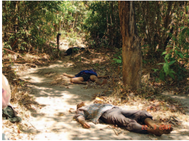
တံးဂီၢ်အံၤဟ်ဖျါထီၣ်ဝဲ သဝီဖိတဖၣ်လၢဘၣ်တံးခးသံအီၤလၢ ပယီၤသုးလၢကျဲ ဖဲဖျးဒုဒီးသဒါဟီၣ်ကဝီၤ. မုၢ်တြီၢ်ကီၢ်ရုၣ် ဖဲ ၂၀၀၇ နံၣ် လၢမးဂျး ၂၁ သီအနံၤန့ၣ်လီၤ.

အဆာဖိ (က) - တံးကွဲးကဒါကွဲး အံၤဟ်ဖျါထီၣ်ပယီၤသုး အတံးဟဲန့ၣ်ဒုးထီၣ်ကညိသဝီဖိတဖၣ်လၢ အကျါအကျဲလီၢ်တံး လီၤဆဲးအပူၤ ဒီးဆီၣ်တံးမးန့ၣ်ဒုးကဲထီၣ်ကမုၢ်လၢအအိၣ် လၢတံးဒုးကဲထီၣ်သးဟီၣ်ကဝီၤတဖၣ်ဆူ တံးမပယွဲပုဟ်ဒ်ခိၣ်ဖိ ခွဲးယံအါအါဂီၢ်ကီၢ် ဒ်တံးအကါဒ်တံးမးန့ၣ်လီၤ. တံးမပယွဲတဖၣ် အံၤပၣ်လုၣ်ဒီး တံးမသံမာဏီ, တံးမဆါပယွဲ, တံးမလၢအတ လီၤကံၤပုၤကုၤပုၤကညိ မ့တမ့ တံးမလၢအလၢကပီၤတအိၣ်, တံးသုးမုၢ်/ခွါ တံးမတရီတပါထီၣ်ပိာ်မုၢ် ဒ်တံးဒုးအစုကတဲၤ တံးမးဒီး ဒ်တံးမဟးဂီၢ်တံးစုလီၢ်ခိၣ်ခိၣ်တံးမးအသီးန့ၣ်လီၤ. ပယီၤ သုးစုးကါပုၤကမုၢ်တဖၣ် ဒ်ပုၤမးတံးဖိလၢတံးတဟ့ၣ်အီၤအဘူး အလဲ, တံးသုးအီၤလၢသုးဂ့ၢ်ဝီတံးပညိၣ်အဂီၢ်, ဆီၣ်တံးမးန့ၣ် ပုၤတုၣ်ဘၣ်တံးတဖၣ်လၢတံးစုဆူၣ်ခိၣ်တကး ဒီးတံးမပျါမးဖုး လၢကဲထီၣ်သးသမူ အတံးလီၤဘၣ်ယံၣ်ဒုၣ်လဲာ်န့ၣ်လီၤ. ပယီၤသုး တဖၣ်မးစုာ်ကီးဝဲ တံးဂုၢ်ဆူၣ်ပျါဆူၣ်တံး, တံးယုးန့ၣ်ဆူၣ်တံးဒီး မးသ ကီးတံးဒီးကီၢ်ပယီၤပဒ်အတံးကရၢကရီတဖၣ်လၢ တံးဟံးန့ၣ်ဆူၣ် ဟီၣ်ခိၣ်ကပံာ်န့ၣ်လီၤ.