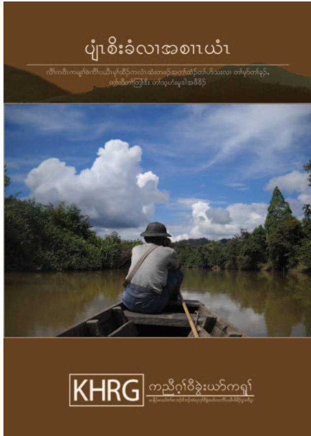
လံာ်ပာ်ဖျါအလၢအပူၤန့ၣ် တၢ်ဂုၤလီၤဆီၤလၢအဲကလံးကျိၣ်ဒီးပယီၤကျိၣ် န့ၣ်လီၤ. လံာ်ပာ်ဖျါလၢကျိၣ်သၢမံၤလၢအံၤ တၢ်ဟံးန့ၣ်အီၤသ့လၢ ကညီဂွံဝိ ခွဲးယာ်ကရူာ် တၢ်ကစီၣ်သန့ဝဲ www.khrgh.org အပူၤသ့ဝဲန့ၣ်လီၤ.

ကညီဒီကလုာ်စၢဖျါကရၢ (KNU) ဒီး ကီၢ်ပယီၤပဒိၣ်တဖၣ် ဆဲးလီၤဝဲတၢ်ပတုာ်တၢ်ခးပတြီၤအလံာ်ပံးပာ် ဝဲ ၂၀၁၂ နံၣ်ဝံၤ အလီၢ်ခံ တၢ်လဲၤထီၣ်လဲၤထီၣ်လၢ တၢ်ထံၣ်အိၣ်ဖျါဖျါဖျါတဖၣ် အိၣ်ထီၣ်ဝဲဘၣ်ဆၢၣ် လီၤကဝီၤဖိလၢအအိၣ်ဆိးလၢ ကီၢ်ပယီၤမုၢ် ထီၣ်ကလံၤထံးတဖၣ်တူၢ်ဘၣ်ဒီးဝဲ တၢ်မၤပယုဲပုၤဟီၣ်ခိၣ်ဖိခွဲးယာ် အါအါဂီၢ်န့ၣ်လီၤ. စုကဝဲၤတၢ်ဘၣ်ဂံာ်ဂုၢ်စုၤလီၤဝဲဒၣ်အံၤ ကဲထီၣ် တၢ်ဒါလီၤန့ၣ်ဝဲကျဲလၢ တၢ်မၤပယုဲ အကွၢ်အဂီၤအဂၤ န့ၣ်အမုၢ် တၢ်ဟံးန့ၣ်ဟီၣ်ခိၣ်ကပံာ်, တကးဒီးဘၣ် ဒုးကဲထီၣ်တၢ်အိၣ်သး လၢအနးဒိၣ်ထီၣ် လၢသဝီဖိတနီၤအဂီၢ်န့ၣ်လီၤ. ကမုၢ်ပုၤတဝၢလၢ အတူၢ်ဘၣ်တၢ်တဖၣ် ကွၢ်ဆၢၣ်မဲာ်ဘၣ်ဝဲဒီးစုကဝဲၤတၢ်ဘၣ်ဂံာ်ဂုၢ်လၢ အန့ၣ်လၢအဆံအတၢ်ပိာ်ထွဲထီၣ်အခံ, ကလုာ်န့ၣ်တၢ်ကွၢ်တလီၤဒီး ဒီးန့ၣ်ဘၣ်နီၣ်သးအတၢ်ဘၣ်ဒိဘၣ်ထံးလၢ အဒိၣ်အမုၢ်တဖၣ်န့ၣ်လီၤ.