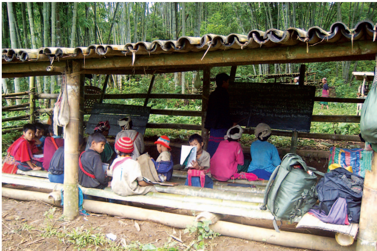
တာ်ဂီၤတဘျုးအံၤဘၣ်တာ်ဒိန့ၣ်အီၤဝဲ လၢအီၤကူး ၃ သီ, ၂၀၀၆ နံၣ် ဝဲလုာ်သီကီၢ်ဆၣ်, မုာ်တြီၢ်ကီၢ်ရၣ်အပူၤန့ၣ်လီၤ. တာ်ဂီၤအံၤဒုးနဲၣ်ဝဲ ဖိသၣ်လၢအဘၣ် တာ်သုးဆူၣ်အလီၢ်အကျဲတဖၣ် မာလိန့ၣ်တာ်လၢ တာ်ဟံာ်အိၣ်ကဒုပန့ၣ်အလီၢ်န့ၣ်လီၤ.