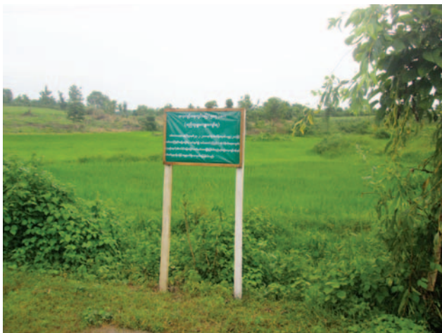
တံးဂါတဘျုးအံၤဘၢဉ်တံးဒိန့ဉ်အါ ဝဲ လါအိကူး ၁၅ သီ ၂၀၁၆နံဉ်, လါ ခိဉ်ဖးခိဉ်ကီၢ်ဆဉ်, တံးအုဉ်ညါန့ဉ်လီၤ. တံးဂါအံၤ ငှးန့ဉ်ပဲ တံးပနီဉ်အတၢဉ် လါ လိာ်ကဝီၤသဝီဖိသုဉ်တဖှ်အဟီဉ်ခိဉ်ဖိခိဉ်န့ဉ်လီၤ. တံးပနီဉ်အတၢဉ်အံၤ သးခိဉ်ကီၢ်လူၤလါအမုဉ်ကီၢ်ခိဉ်လါ ပယီၤသးဘယုဉ်နီၤတံးမၤလိသး ကလါအကူၢ်ခိဉ် ဆိလီၤဝဲ ဝဲလါအိကူး ၁၀ သီ ဝဲ ၂၀၁၆ နံဉ်အနံၤန့ဉ်လီၤ. တံးပနီဉ်အတၢဉ်စံးဝဲလါ ဟီဉ်ခိဉ်အံၤမုဉ်သးတံးခးလိဟီဉ်ကဝီၤလံးဒီး ဩဃာ် လိာ်ကဝီၤဖိတဖှ်လါ ကဟဲန့ဉ်လီၤဝဲန့ဉ်လီၤ. (တံးဂါ- KHRG)