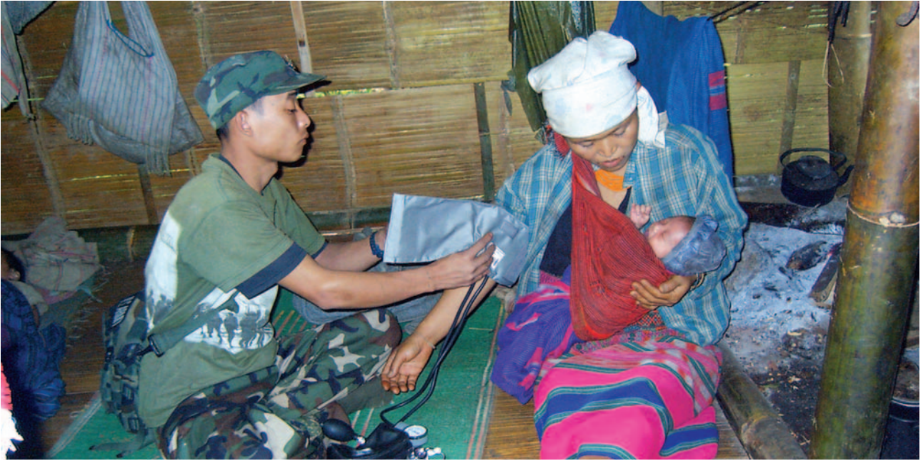
တၢ်ဂီၤအံၤဘၣ်တၢ်ဒီးန့ၢ်အိၤဖဲ လါအိၤကူး ၄ သီ.၂၀၀၆ နံၣ် ဝဲလှၢ်သီကီၢ်ဆၣ်, မ့ၢ်တြီၢ်ကီၢ်ရၣ်အပူၤန့ၣ်လီၤ. ဝိၣ်မ့ၢ်အံၤအိၣ်ဖျါထီၣ်အဖိလၢပှၢ်ပူၤ ဝဲအဲၤ ယှၢ်မ့ၢ်ဟးဖျိးအခါန့ၣ်လီၤ. အဲၤမၤန့ၢ်ဝဲတၢ်ကဟုကယၢ်လၢ ဖျါပူၤကသံၣ်သရၣ်တၢ်အအိၣ်န့ၣ်လီၤ.