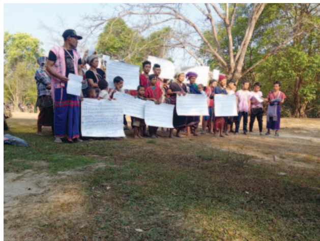
တံးဂါတဘျုးအံၤ ဘၢဉ်တံးဒိန့ဉ်အါ ဝဲ လါမးရှး ၂၀ သီ, ၂၀၁၉ နံဉ် လါယဲဒါ ကရုၢ်, လါခိဉ်ကီၢ်ဆဉ်, ချၢဉ်လွံာ်ထုဉ်ကီၢ်ရုဉ်န့ဉ်လီၤ. တံးဂါအံၤ ငှးန့ဉ်ပဲ သဝီဖိလါ ယဲဒါကရုၢ်တဖှ် ဟ်ဖျါထိုင်အတတ်ဘက်သားထီဒါဝဲ ပယီၤသး အတတ်တုထိုင်ကျဲအတတ်တိာ်ကျဲန့ဉ်လီၤ.