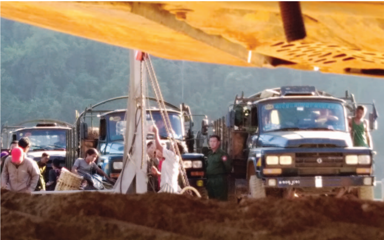
တၢ်ဂီၤတဘျၢ်အံၤဘၣ်တၢ်ဒိန့ၢ်အိၤဖဲ လါဒီးဘၣ်၂၀၁၇ နံၣ်လၢ ထီတထူၣ်ကီၢ်ဆၣ်, တီအူကီၢ်ရၣ်အပူၤန့ၣ်လီၤ. တၢ်ဂီၤအံၤဒုးန့ၣ်ဝဲ ပယီၤသုးအသိလုၣ်တဖၣ်ဆုၢ်အါထီၣ်ဝဲ တၢ်အိၣ်တၢ်အိၣ်ဒီးသုးဖိသံၣ်ဖိတဖၣ်ဆူ ချၢၣ်လၢဒီး ကီၢ်သုးဒီးသုးကလၢတဖၣ်အအိၣ်န့ၣ်လီၤ.