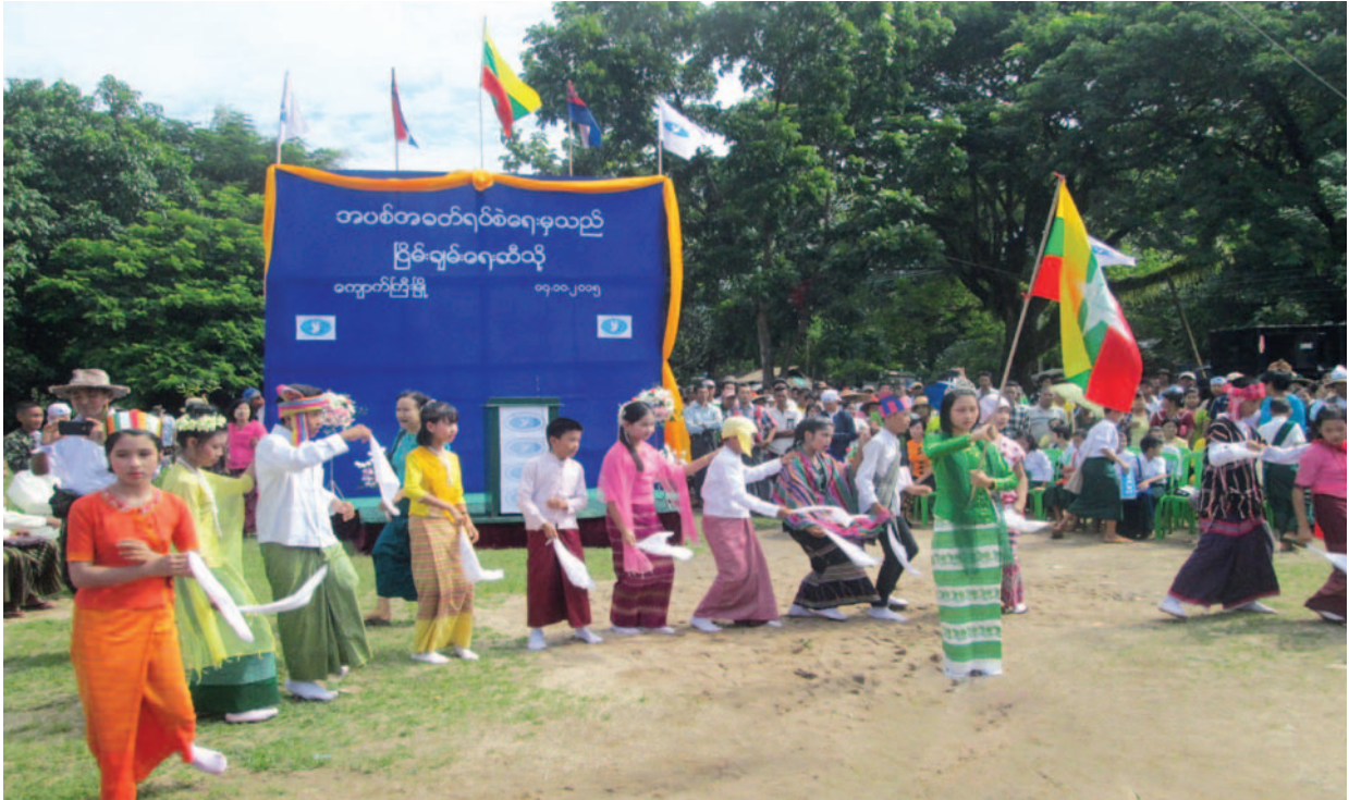
ဤပုံကို ကရင်လူ့အခွင့်အရေးအဖွဲ့၏သတင်းမှတ်တမ်းပြုစုသူတစ်ဦးမှ ညောင်လေးပင်ခရိုင်၊ ကျောက်ကြီးမြို့နယ်တွင် ၂၀၁၅ ခုနှစ် ၊ အောက်တိုဘာလ ၁၄ ရက်နေ့က ရိုက်ယူခဲ့ခြင်းဖြစ်သည်။ ပုံမှာ မုန်း၊ ကျောက်ကြီးနှင့် ရွှေကျင်မြို့နယ်များရှိ ရွာသူရွာသား (၄၀၀၀) ကျော်မှ လာမည့် တစ်နိုင်ငံလုံးဆိုင်ရာအပစ်ခတ်ရပ်စဲရေးသဘောတူစာချုပ်တွင် လက်မှတ်ထိုးရေးအခမ်းအနားကို အတူတကွ ပူးပေါင်းကျင်းပခဲ့သည်။