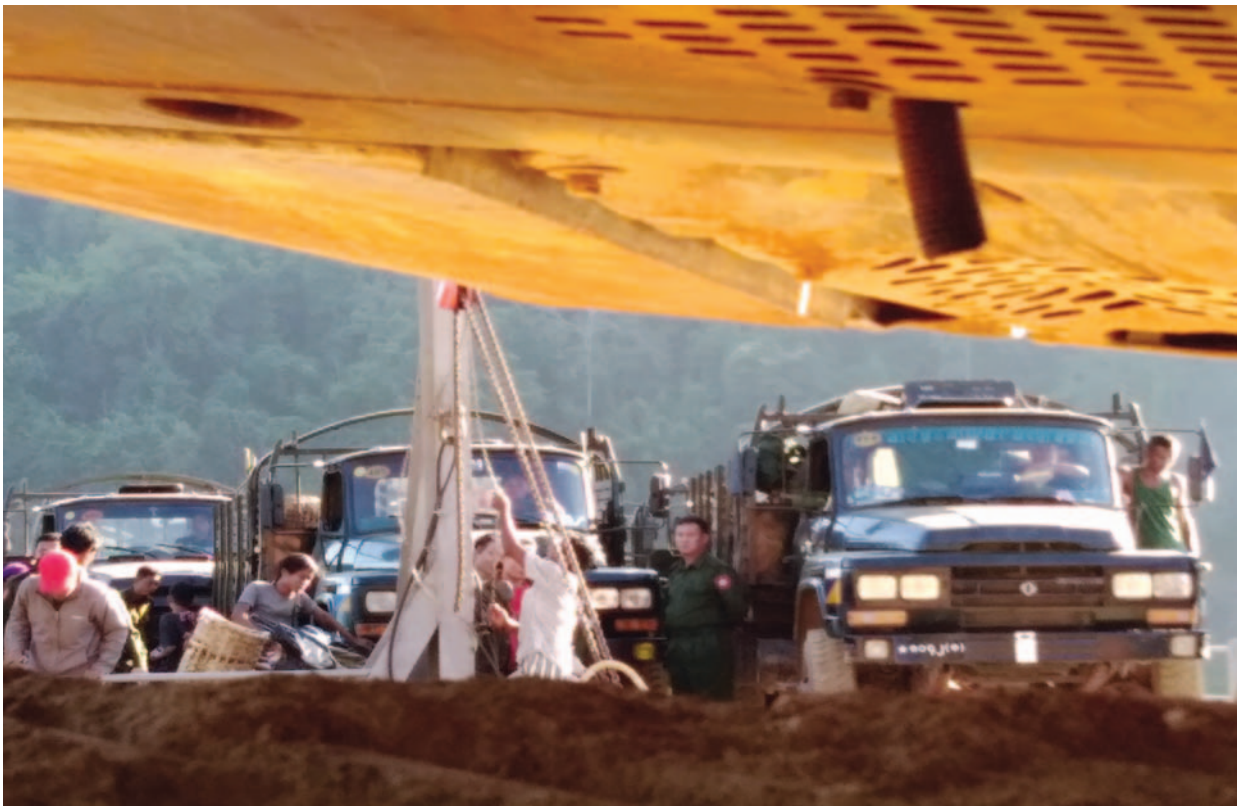
ဤပုံကို ကရင်လူ့အခွင့်အရေးအဖွဲ့၏သတင်းမှတ်တမ်းပြုစုသူတစ်ဦးမှ တောင်ငူခရိုင်၊ ထန်းတပ်ပင်မြို့နယ်တွင် ၂၀၁၇ ခုနှစ်၊ ဒီဇင်ဘာလက ရိုက်ယူခဲ့ခြင်းဖြစ်သည်။ ပုံမှာ တပ်မတော်မှကုန်တင်ကားကြီးများဖြင့် စားနပ်ရိက္ခာနှင့် စစ်သားဦးရေများကို ဘောင်လီနှင့် ရေသိုးကြီးစစ်တပ် စခန်းများသို့ တိုးချဲ့ပို့ဆောင်နေပုံကို ဖော်ပြထားခြင်းဖြစ်သည်။