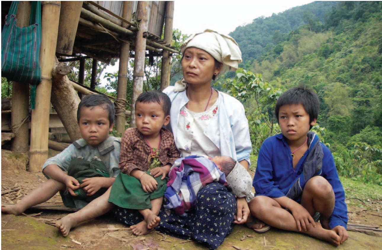
ဤပုံကို ၂၀၀၆ ခုနှစ်၊ မေလ ၁၈ ရက်နေ့တွင် ဖာပွန်ခရိုင်၊ လူသောမြို့နယ်၊ ယယ်မူပလောကျေးရွာအုပ်စုတွင် ရိုက်ယူခဲ့ပါသည်။ ရွှေ့ပြောင်းနေထိုင်သည့် နေရာတစ်နေရာတွင် မုဆိုးမနှင့်အတူ သူမ၏ကလေး လေးယောက်ပုံဖြစ်ပါသည်။ သူမ၏ခင်ပွန်းအား ၂၀၀၆ ခုနှစ်တွင် တပ်မတော်စစ်သားများမှ သတ်ခဲ့ကြပါသည်။

၂၀၁၅ ခုနှစ်တွင် တစ်နိုင်ငံလုံးဆိုင်ရာပစ်ခတ်တိုက်ခိုက်မှုရပ်စဲရေး သဘောတူညီမှုစာချုပ် (NCA)အား လက်မှတ်ရေးထိုးခြင်းသည် အပေါင်းလက္ခဏာဆောင်သည့် ပြောင်းလဲမှုအချို့ဖြစ်ပေါ်စေခဲ့သည်။ ယခုအခါတွင် ရှေ့ဆက်ရန်ခက်ခဲနေသည့် ငြိမ်းချမ်းရေးလုပ်ငန်းစဉ်သည် မြန်မာနိုင်ငံအရှေ့တောင်ပိုင်းရှိ သမိုင်းဝင်အမွေဆိုးဖြစ်သည့် လူ့အခွင့်အရေးချိုးဖောက်မှုများနှင့် အသစ်ပေါ်ထွက်လာသည့်ချိုးဖောက်မှုများအပေါ် မည်သည့်အတိုင်းအတာအထိ ဖြေရှင်းပေးနိုင်မည်ကို ရှင်းလင်းစွာမသိရသေးပေ။ အတိတ်ကာလမှ လူ့အခွင့်အရေးချိုးဖောက်မှုများသည် ဒေသခံများ၏ နေ့စဉ်ဘဝအား အမှန်တကယ်ပင်သက်ရောက်မှုများ ဆက်လက် ရှိနေပြီး ချိုးဖောက်မှုပုံစံအသစ်များသည်လည်း ဒေသခံပြည်သူလူထု၏ စီးပွားရေးကိုပါ ထပ်လောင်းထိခိုက်မှုများရှိစေပါသည်။ ထို့ကြောင့် လူ့အခွင့်အရေးချိုးဖောက်ခံရသော ဒေသခံများအနေဖြင့် တရားမျှတမှုနှင့် ကျေလည်အောင်ပေးသည့်လျော်ကြေးငွေများရရှိရန် အလွန်အရေးကြီးလှပါသည်။ ၎င်းတို့၏ စိုးရိမ်မှုများအား ထိရောက်စွာဖြေရှင်းပေးနိုင်ခြင်း ရှိမရှိကိုမူ ထိခိုက်ခံစားရသော သက်ဆိုင်ရာဒေသခံများကသာ ဆုံးဖြတ်ပေးနိုင်မည်ဖြစ်သည်။