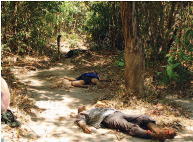
ပုံမှာ တပ်မတော်မှ ဖာပွန်ခရိုင်၊ ဖလဒေးနှင့်သဒါဒေသရှိ ရွာသူရွာသားများအား ၂၀၀၇ ခုနှစ် မတ်လ ၂၁ ရက်နေ့ ညနေ ၃ နာရီခွဲ ၀န်းကျင်တွင် ပစ်သတ်ခဲ့ခြင်းကို ဖော်ပြထားပါသည်။

အပိုင်း (က) သည် တပ်မတော်မှ ကရင်တိုင်းရင်းသား ကျေးရွာများအား စနစ်တကျတိုက်ခိုက်ခဲ့ပုံများနှင့် တိုက်ပွဲဒဏ်ခံရသည့် ဒေသများမှပြည်သူများအား လူ့အခွင့်အရေးချိုးဖောက်မှုမျိုးစုံအတွက် ပစ်မှတ်ထားမှုများကို မီးမောင်းထိုးဖော်ပြထားသည်။ ထိုချိုးဖောက်မှုများအထဲတွင် သတ်ဖြတ်ခြင်း၊ ညှဉ်းပမ်းနှိပ်စက်ခြင်းနှင့် အခြားသောလူမဆန်သည့် သို့မဟုတ် အရှက်ရစေသည့်လုပ်ဆောင်မှုများ၊ အမျိုးသမီးများအား လိင်ပိုင်းဆိုင်ရာအကြမ်းဖက်မှုများကို စစ်လက်နက်သဖွယ်အသုံးပြုပြီး ကျယ်ပြန့်စွာကျူးလွန်ခြင်းနှင့် ပိုင်ဆိုင်မှုများအားဖျက်စီးခြင်းတို့ ပါဝင်သည်။ တပ်မတော်သည် ဒေသခံပြည်သူများအား အကြောင်းငွေမပေးပဲ စစ်တပ်၏လုပ်ငန်းများတွင် လုပ်သားအဖြစ် အမြဲတမ်းအသုံးပြုခြင်း၊ အမွေကျူးလွန် ခိုင်းစေခံရ သူများအား အကြမ်းဖက်ခြင်း၊ ခြိမ်းခြောက်ခြင်းနှင့် အသက်အန္တရာယ်ပေးခြင်းများကိုလည်း မကြာခဏကျူးလွန်ခဲ့သည်။ ထို့အပြင် တပ်မတော်မှပစ္စည်းများလုယူခြင်း၊ ခြောက်လှန့်တောင်းယူခြင်းများ၊ မြန်မာအစိုးရအဖွဲ့အစည်းများနှင့်အတူ မြေယာသိမ်းယူခြင်းများကိုလည်း လုပ်ဆောင်လျက်ရှိသည်။