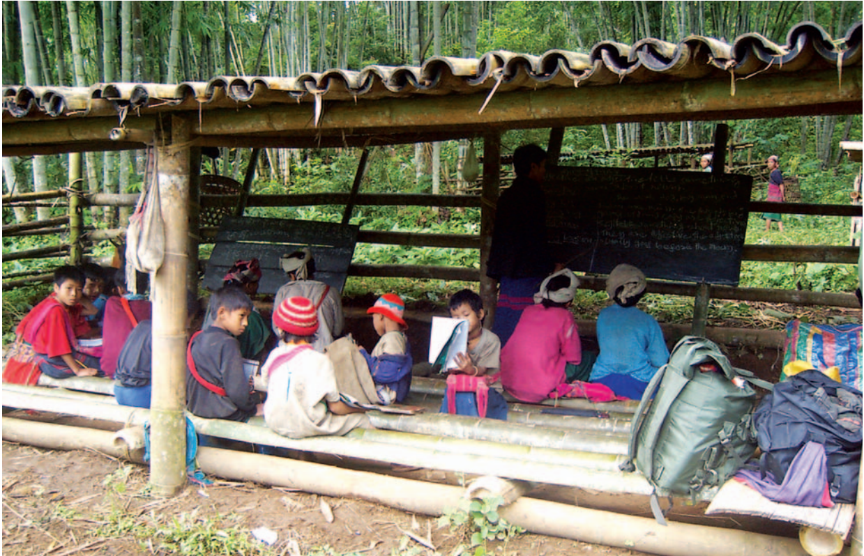
ဤပုံကို ကရင်လူ့အခွင့်အရေးအဖွဲ့၏သတင်းမှတ်တမ်းပြုစုသူတစ်ဦးမှ ဖာပွန်ခရိုင်၊ လူသောမြို့နယ်တွင် ၂၀၀၆ ခုနှစ်၊ ဩဂုတ်လ ၃ ရက်နေ့ ကရိုက်ယူခဲ့ခြင်းဖြစ်သည်။ ပုံမှာ နေရပ်ရွှေ့ပြောင်းနေထိုင်ရသောကလေးသူငယ်များမှ ကျွဲများနေသည့်နေရာကို စာသင်ခန်းအဖြစ် စာသင်ယူခဲ့ခြင်းကို ဖော်ပြခြင်းဖြစ်သည်။