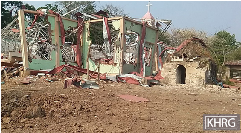
တၢ်ဂီၢ်တဘျီအံၤ ဘဉ်တၢ်ဒိန့ဉ်အိၤဖဲ လၢအုဉ်ဉ် ၂၀၂၃ နံဉ် ဖဲ နတ--- သဝီ, နိဉ်ဖိကရူၢ်, ကိးတ ရဲးကီၢ်ဆဉ်, ဒုပုဉ်ယာ်ကီၢ်ရဲးန့ဉ်လီၤ. တၢ်ဂီၢ်အံၤ ပာ်ဖျါဝဲ ပုကညီဘျီထံတၢ်ဘါလွၤသရိဉ်တဖျါ လၢ တန---သဝီပူ, ဘဉ်တၢ်မၤဟးဂီၢ်ကွံာ်အိၤခိ ဖျါ SAC သုးကွံာ်လီၤမ့ဉ်ပိလၢ ကဘီယူပူ ဖဲလၢ အုဉ်ဉ် ၁ သီ, ၂၀၂၃ နံဉ်န့ဉ်လီၤ. ကဘီယူခးလီၤ တၢ်တဘျီအံၤ မၤဟးဂီၢ်စ့ၢ်ကိး ဒုသဝီကွံာ်တၢ်သ့ဉ် ထီဉ်တဖျါဒီး ပုသဝီဖိအဟံဉ်တဖဉ်န့ဉ်လီၤ.