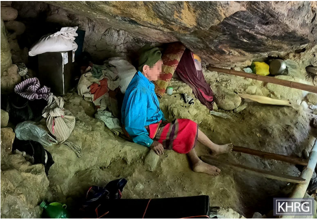
တၢ်ဂီၤတဘျီအံၤ ဘၣ်တၢ်ဒိန့ၢ်အိၣ်ဖဲ လၢအ့ၢ်ဖျိၣ် ၂၀၂၁ နံၣ်ဖဲ လုက အိပူၤတတီၤလၢ လူၤသီကီၢ်ဆၣ်, မ့ၢ်တြီၢ်ကီၢ်ရ့ၣ်, ဖဲပုၤသဝီဖိလၢ ဒုၣ်ဘူးနီၣ်ဟီၣ် ကဝီၤ, ပုက့ၤကရူၢ် တဖၣ်လဲၤအိၣ်ခူသ့ၣ်ဝဲ ဒီဖျိ SAC သးကွံာ်လီၤကဘီယူမ့ၢ်ပိာ်ဖဲ လၢမးရူး ၂၇ သီ, ၂၀၂၁ နံၣ်န့ၣ်လီၤ. တၢ်ဂီၤအံၤပာ်ဖျါဝဲ ပိာ်မုာ်သးပုၤတဂၤ, လၢအသးနံၣ်အိၣ် ၁၀၀ ဘျီ န့ၣ် ဘၣ်ဃုာ်မုံဟးဖျိးဒီး အိၣ်ကဒုဝဲဖဲ လုကအိပူၤအဆၢကတီၢ်န့ၣ် လီၤ.