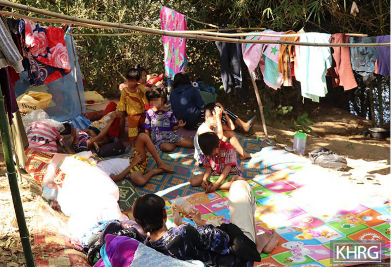
ဤပုံကို ၂၀၂၁ ခုနှစ်၊ ဒီဇင်ဘာလတွင် ရိုက်ယူခဲ့ပါသည်။ ပုံတွင် ထိုင်း-မြန်မာနယ်စပ်အနီးရှိ ဒူးပလာယာခရိုင်၊ ကော်တရီမြို့နယ်၊ ဖလူးကျေးရွာအုပ်စုရှိ တမ--- ထွက်ပြေးတိမ်းရှောင်စခန်းတွင် နေထိုင်ကြသော တလ--- ကျေးရွာမှ ထွက်ပြေးတိမ်းရှောင်လာသူ များကို ဖော်ပြထားပါသည်။ လေးကေကော်နယ်မြေတွင် SAC နှင့် BGF ပူးပေါင်းတပ်ဖွဲ့နှင့် KNLA တပ်ဖွဲ့တို့ကြား တိုက်ပွဲဖြစ်ပွားပြီး နောက်ဆက်တွဲအနေဖြင့် ၂၀၂၁ ခုနှစ်၊ ဒီဇင်ဘာလ ၁၅ ရက်နေ့တွင် SAC သည် ထိုဒေသအတွင်းသို့ စစ်ကြောင်းထိုးမှုနှင့် လေကြောင်းတိုက်ခိုက်မှုများ ပြုလုပ်ပြီးနောက် ခန့်မှန်းခြေအားဖြင့် လေးကေကော်နယ်မြေအပါအဝင် ဖလူးကျေးရွာအုပ်စုမှ ရွာသား ၁,၀၀၀ ခန့် ထွက်ပြေးတိမ်းရှောင်ခဲ့ရသည်။

ကာ ညွှန်ကြားချက်များပေးခြင်း၊ အရင်းအမြစ်များအား စီမံခန့်ခွဲခြင်းနှင့် ခရီးသွားလာရေးအတွက် အကြံပြုချက်ပေးခြင်းများအပါအဝင် ရွာသားများအတွက် ပံ့ပိုးသည့်ပစ္စည်းများအား သယ်ယူပို့ဆောင်ပေးခြင်းတို့ကို လုပ်ဆောင်လျက် ရှိသည်။ KNU အဖွဲ့ဝင်များသည် စစ်ကောင်စီ၏ လေကြောင်းတိုက်ခိုက်မှုခံရနိုင်ခြေရှိသည့်အခါများတွင် ဒေသတွင်း ခေါင်းဆောင်များနှင့် ရွာသားများအား သတင်းပေးသည်။