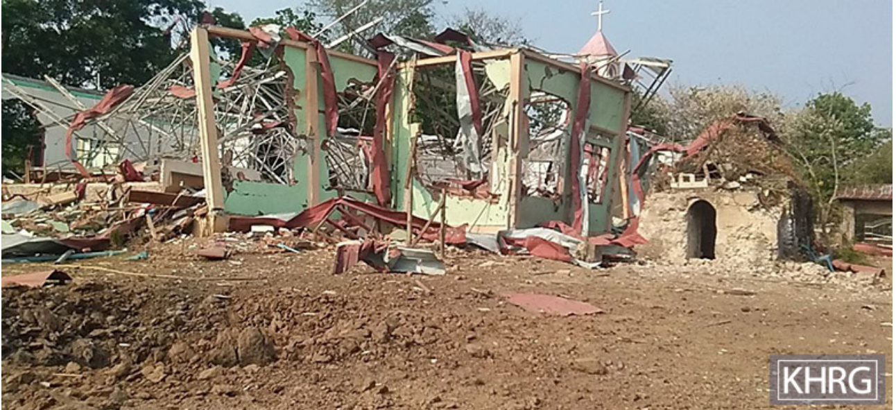
ဤပုံကို ၂၀၂၃ ခုနှစ်၊ ဧပြီလအတွင်း ဒူးပလာယာခရိုင်၊ ကော်တရီမြို့နယ်၊ နို့ဖိုးကျေးရွာအုပ်စု၊ ထယ--- ကျေးရွာတွင် ရိုက်ယူခဲ့ပါသည်။ ဤပုံသည် ၂၀၂၃ ခုနှစ်၊ ဧပြီလ ၁၁ ရက်နေ့တွင် SAC လေကြောင်းတိုက်ခိုက်မှုမှ ကြိုချခဲ့သော ဗုံးတစ်လုံးကြောင့် ထိခိုက်ပျက်စီးသွားသော ထယ--- ကျေးရွာရှိ ကရင်နှစ်ခြင်းခရစ်ယာန် ဘုရားရှိခိုးကျောင်းတစ်ကျောင်း၏ ပုံဖြစ်ပါသည်။ ထိုလေကြောင်းတိုက်ခိုက်မှုတွင် ရွာရှိကျောင်းတစ်ကျောင်းနှင့် ရွာသားများ၏နေအိမ်များလည်း ထိခိုက်ပျက်စီးခဲ့သည်။