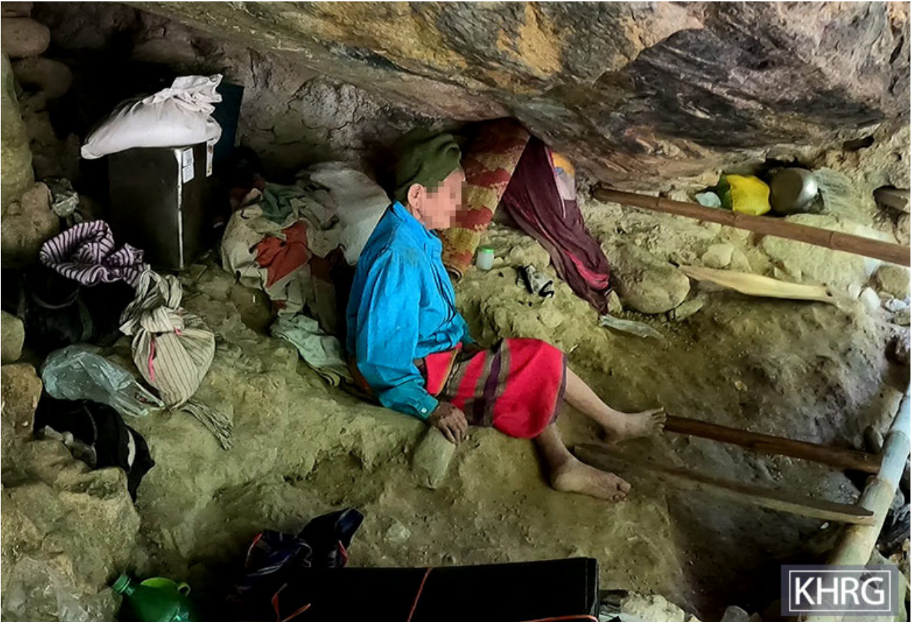
ဤပုံကို ၂၀၂၁ ခုနှစ်၊ ဧပြီလတွင် မူကြော်ခရိုင်၊ လူသော မြို့နယ်ရှိ ဂူတစ်ခုတွင် ရိုက်ယူခဲ့ပါသည်။ ဤနေရာသည် ၂၀၂၁ ခုနှစ်၊ မတ်လ ၂၇ ရက်နေ့တွင် SAC ဗုံးကြဲတိုက်ခိုက်မှုပြီးနောက် လူသောမြို့နယ်၊ ပေးကေးကျေးရွာအုပ်စု၊ ဒေဘူးနီနယ်မြေရှိ ရွာသူ၊ ရွာသားများ ထွက်ပြေးတိမ်းရှောင်ရာနေရာဖြစ်ပါသည်။ ပုံတွင် အသက် ၁၀၀ ကျော်ခန့်ရှိသော အဖွားအိုသည် ထွက်ပြေးတိမ်းရှောင်နေချိန်အတွင်း ဂူထဲတွင် ခိုလှုံနေပုံကို ဖော်ပြထားပါသည်။

လေကြောင်းတိုက်ခိုက်မှုကြောင့် ရွာသားများ၏ လွတ်လပ်ခွင့်နှင့်လုံခြုံရေးကို အချိန်ကြာမြင့်စွာ ထိခိုက်စေကြောင်း လူပေါင်းများစွာ ကာလရှည်နေရပ်ရွှေ့ပြောင်းနေထိုင်နေခြင်းက ပြသလျက်ရှိသည်။