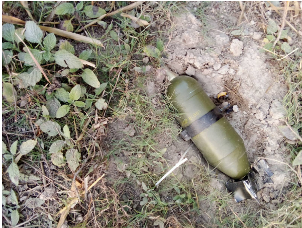
ဤပုံကို ၂၀၂၄ ခုနှစ်၊ ဖေဖော်ဝါရီလတွင် လက်ခံရရှိခဲ့ပါသည်။ ၂၀၂၄ ခုနှစ်၊ ဖေဖော်ဝါရီလ ၁၇ ရက်နေ့၊ မနက် ၁၁ နာရီဝန်းကျင်တွင် SAC ခြေမြန်တပ်ရင်း အမှတ် (၄၃၉) မှ ခလယ်လွှဲထုခရိုင်၊ မူးမြို့နယ်၊ ခင်းကြီးကျေးရွာအုပ်စု၊ ထပ--- ကျေးရွာအတွင်းသို့ ဒရုန်းတိုက်ခိုက်မှုတစ်ကြိမ် ပြုလုပ်ခဲ့ သည်။ ဗုံးများကြဲချပြီး ရွာသားတစ်ဦး၏ နေအိမ်ကို လောင် ကျွမ်းစေခဲ့ပါသည်။ ဤပုံသည် SAC ဒရုန်းတိုက်ခိုက်မှုအ တွင်း ကြဲချပြီး မပေါက်ကွဲသော ဗုံးများအနက် တစ်လုံး၏ ပုံ ဖြစ်ပါသည်။

တစ်ချို့ဖြစ်စဉ်များတွင် SAC မှ ကျေးရွာများအတွင်း ဗုံးကြဲတိုက်ခိုက်၍ လူနေအိမ်များပျက်စီးသွားကာ ရွာသားများလည်း ထွက်ပြေးတိမ်းရှောင်ရပြီးနောက်တွင် SAC စစ်သားများသည် အဆိုပါကျေးရွာတွင်းသို့ ဝင်ရောက်လာပြီး ရွာသားများ၏ပိုင်ဆိုင်မှုပစ္စည်းများအား ခိုးယူလုယက်ခြင်း သို့မဟုတ် ကျေးရွာများတွင် ယာယီတပ်စခန်းများချ၍ အခြေချလှုပ်ရှားနေကြောင်း ဒေသခံများက တင်ပြခဲ့ကြသည်။ 52