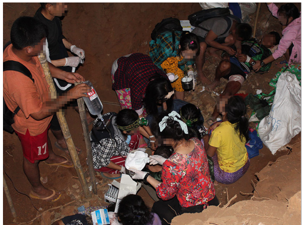
ဤပုံကို ၂၀၂၁ ခုနှစ်၊ ဧပြီလတွင် KNLA ဆေးတပ်သား တစ်ဦးထံမှ လက်ခံရရှိခဲ့ပါသည်။ ဤပုံသည် ၂၀၂၁ ခုနှစ်၊ မတ်လ ၂၇ ရက်နေ့တွင် မူကြော်ခရိုင်၊ လူသောမြို့နယ်၊ ဒေဘူးနီနယ်မြေအတွင်း၌ ဖြစ်ပွားခဲ့သော ဗုံးကြဲတိုက်ခိုက်မှုကြောင့် ထိခိုက်ဒဏ်ရာရရှိသောရွာသူ၊ ရွာသားများကို KDHW ဝန်ထမ်းများမှ တောထဲရှိ တူးမြောင်းတစ်ခုထဲတွင် ဆေးကုသပေးနေပုံကို ဖော်ပြထားပါသည်။

လက်ရှိဖြစ်ပွားလျက်ရှိသော လက်နက်ကိုင်တိုက်ပွဲများ၊ စစ်ကောင်စီ၏ တိုက်ခိုက်မှုများကြောင့် ကြုံတွေ့ရသည့် အခက်အခဲများအပြင် ၎င်းတို့အနေနှင့် ဖမ်းဆီးထိန်းသိမ်းခံရခြင်း သို့မဟုတ် ပစ္စည်းများသိမ်းဆည်းခံရလေ့ရှိသော စစ်ကောင်စီ စစ်ဆေးရေးဂိတ်များအား ဖြတ်ကျော်ရခြင်း စသည့် အခက်အခဲများကြောင့် ဒေသတွင်း ကျန်းမာရေးဝန်ထမ်းများအနေနှင့် KNU အုပ်ချုပ်သည့် ဒေသများတွင် လုပ်ငန်းများ ဆောင်ရွက်ရန် ကန့်သတ်မှုများ ရှိနေသည်။ ခလယ်လွှီထူခရိုင်မှ BPHWT ဥက္ကဋ္ဌဖြစ်သည့် နော်ဘထ--- က လေကြောင်းတိုက်ခိုက်မှုကြောင့် ဖြစ်ပေါ်လာသည့် ကျန်းမာရေးလုပ်သားများ ခံစားရသော စိတ်ပိုင်းဆိုင်ရာ ထိခိုက်မှုအချို့ကို ရှင်းပြခဲ့သည်။ “စိတ်ပိုင်းဆိုင်ရာ ကျန်းမာရေးနဲ့ ပတ်သက်ပြီး လူတိုင်းကတော့ ကြောက်ကြတာပဲ။ [...] ဒီကြောက်ရွံ့မှုက ကျွန်မတို့ကိုလည်း သက်ရောက်တယ်။ [...] သူတို့ [လေယာဉ်တွေ] ကျွန်မတို့အပေါ်ကနေပျံသွားပြီးဆို ကျွန်မတို့လည်း နှလုံးခုန်မြန်လာတယ်။ ကျွန်မတို့လည်း ကြောက်တယ်။ ဒီလိုအခြေအနေမှာ ကျွန်မတို့ရဲ့ ဝန်ထမ်းတွေကြားက အကြောက်တရားကို မလျှော့ချပေးနိုင်ဘူး။ သူတို့က လေကြောင်းတိုက်ခိုက်မှုကို နှစ်ကြိမ်တောင် လုပ်ခဲ့တယ်။ ဒါကြောင့် သူတို့နောက်တခါတော့ ထပ်မလုပ်ဘူးလို့ ကျွန်မတို့ မပြောနိုင်ဘူး။ [...] ဒါက မလုံခြုံမှုနဲ့ ကြောက်ရွံ့မှုကို ဖြစ်စေတဲ့အတွက် ကျွန်မတို့ရဲ့ စိတ်ပိုင်းဆိုင်ရာ ထိခိုက်မှုတွေ ဖြစ်စေတယ်။ လေယာဉ်အသံကြားတာနဲ့ ကျွန်မတို့တွေ ထွက်ပြေးချင်တယ်။ ကျွန်မတို့ [စိတ်လှုပ်ရှားမှုမရှိပဲ] အေးအေးဆေးဆေး နေလို့မရဘူး။ ကျွန်မတို့ရဲ့ ဝန်ထမ်းတွေအနေနဲ့လည်း ပြည်သူတွေကို ကုသမှုပေးတဲ့အခါမှာလည်း ကြောက်ရတယ်။ ကျွန်မတို့ လူနာတွေကို ဆေးကုပေးတဲ့အခါမှာလည်း ဆက်ပြီးကြောက်ရတယ်။” ယခင်က ဗမာစစ်သားများမှ လူသားချင်းစာနာမှုအထောက်အပံ့များအား