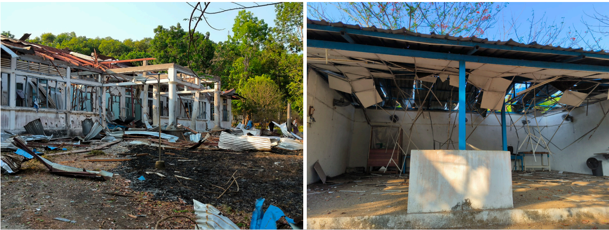
ဤပုံများကို ၂၀၂၄ ခုနှစ်၊ မေလ ၈ ရက်နေ့တွင် မြိတ်-ထားဝယ်ခရိုင်၊ ကစယ်ဒိုမြို့နယ်၊ ယစ--- ကျေးရွာတွင် ရိုက်ယူခဲ့ပါသည်။ ဤပုံများသည် ၂၀၂၄ ခုနှစ်၊ မေလ ၈ ရက်နေ့တွင် SAC သည် ကစယ်ဒိုမြို့နယ်ရှိ ယရ--- နှင့် ယစ--- ကျေးရွာအတွင်းသို့ လေကြောင်းတိုက်ခိုက်မှုတစ်ကြိမ် လာရောက်ပြုလုပ်ခဲ့သဖြင့် ထိခိုက်ပျက်စီးသွားခဲ့သော ယရ--- ကျောင်း (ဘယ်ဘက်) နှင့် ယစ--- ဆေးရုံ (ညာဘက်) တို့၏ ပုံများဖြစ်ပါသည်။

တွေ ဟိုဟိုဒီဒီပြေးနေကြတာ တွေ့လိုက်ရတယ်။ [...] [ယရ--- ရွာ] ရွာသားတွေက ယာယီဗုံးခိုကျင်းတွေ မရှိကြဘူး။ ရွာသားတွေက ဖြစ်စဉ်ဖြစ်ချိန်မှာ လုံခြုံရေးနည်းကို သင်ခဲ့ရပြီး မြေပြင်နဲ့ [ရင်ဘတ်]နှစ်လက်မခြားပြီး လှုံ့ဖို့ကိုလည်း နားလည်ထားကြပါတယ်” ဟုပြောပြခဲ့ပါသည်။