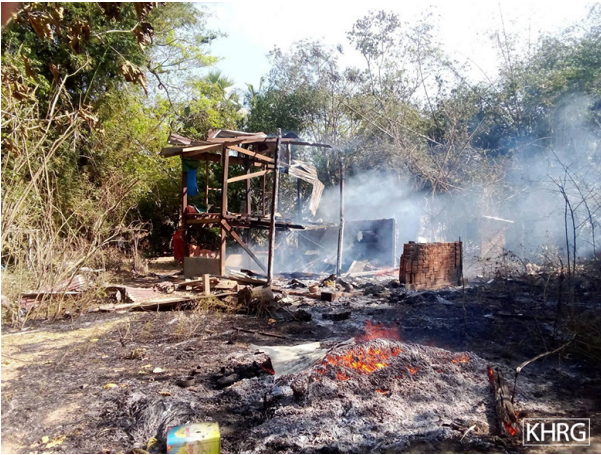
ဤပုံကို ၂၀၂၄ ခုနှစ်၊ ဖေဖော်ဝါရီလတွင် ခလယ်လွှီထူ ခရိုင်၊ မူးမြို့နယ်၊ ခင်းကြီးကျေးရွာအုပ်စု၊ ထမ---ကျေးရွာ တွင် ရိုက်ယူခဲ့ပါသည်။ ၂၀၂၄ ခုနှစ်၊ ဖေဖော်ဝါရီလ ၁၇ ရက်နေ့၊ နံနက် ၁၁ နာရီဝန်းကျင်တွင် SAC ခြေမြန်တပ် ရင်းအမှတ် (၄၃၉) မှ ထမ--- ကျေးရွာ အတွင်းသို့ ဒရုန်း များဖြင့် ဗုံးကြဲတိုက်ခိုက်မှုများ ပြုလုပ်ခဲ့သည်။ ဤပုံ သည် ထိုလေကြောင်းတိုက်ခိုက်မှု ကြောင့် လောင်ကျွမ်း သွား သော နေအိမ်ပုံဖြစ်ပါသည်။