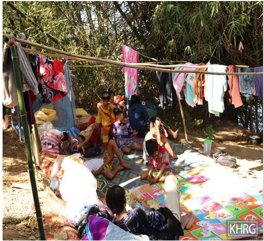
ဤပုံကို ၂၀၂၁ ခုနှစ်၊ ဒီဇင်ဘာလတွင် ရိုက်ယူခဲ့ပါသည်။ ပုံတွင် ထိုင်း-မြန်မာနယ်စပ်အနီးရှိ ဒူးပလာယာခရိုင်၊ ကော်တရီမြို့နယ်၊ ဖလူးကျေးရွာအုပ်စုရှိ တမ--- ထွက်ပြေးတိမ်းရှောင်စခန်းတွင် နေထိုင်ကြသော တလ--- ကျေးရွာမှ ထွက်ပြေးတိမ်းရှောင်လာသူများကို ဖော်ပြ ထားပါသည်။ လေးကေကော်နယ်မြေတွင် SAC နှင့် BGF ပူးပေါင်းတပ်ဖွဲ့နှင့် KNLA တပ်ဖွဲ့တို့ကြား တိုက်ပွဲဖြစ် ပွားပြီး နောက်ဆက်တွဲအနေဖြင့် ၂၀၂၁ ခုနှစ်၊ ဒီဇင်ဘာလ ၁၅ ရက်နေ့တွင် SAC သည် ထိုဒေသ အတွင်းသို့ စစ်ကြောင်းထိုးမှုနှင့် လေကြောင်းတိုက်ခိုက် မှုများ ပြုလုပ်ပြီးနောက် ခန့်မှန်းခြေအားဖြင့် လေးကေကော် နယ်မြေ အပါအဝင် ဖလူးကျေးရွာအုပ်စုမှ ရွာသား ၁,၀၀၀ ခန့် ထွက်ပြေးတိမ်းရှောင်ခဲ့ရသည်။

လေကြောင်းတိုက်ခိုက်မှုများသည် ကလေးများအား ၎င်းတို့၏ မိသားစုများ၊ လူမှုအသိုက်အဝန်းများနှင့် ဝေးကွာစေပြီး ကလေးများအနေနှင့် ၎င်းတို့၏ မိသားစုများ၊ လူမှုအသိုက်အဝန်းများနှင့် လုံခြုံသည့် နေရာများတွင် ပြန်လည်ဆုံဆည်းနိုင်ရန် အခက်အခဲရှိသည်။ ကျောင်းသားအများစုမှာ တဦးတည်းထွက်ပြေးရပြီး ၎င်းတို့နှင့်အတူ ပစ္စည်းအနည်းငယ်သာ သယ်ဆောင်ခွင့်ပေးထားသည့်အတွက် ၎င်းတို့အနေနှင့် ပညာဆက်လက် သင်ကြားနိုင်ရန် အခက်အခဲများ ရင်ဆိုင်ရသည်။ ဤအခြေအနေများကြားတွင် လူမှုအသိုက်အဝန်းများမှ ယာယီစာသင်ဆောင်များ ဆောက်လုပ်ခြင်း၊ စာသင်ချိန်အား မတင်းကြပ်ခြင်းတို့ဖြင့် ကလေးများ ဆက်လက်ပညာသင်ကြားနိုင်ရန်အတွက် ကြိုးစားကြသည်။ အချို့ကလေးများသည် ပညာဆက်လက်သင်ယူနိုင်ရန် တတိယနိုင်ငံများသို့ တဦးတည်းထွက်ခွာကြရသည်။ ထိုသို့ပညာရေးအစီအစဉ်များတွင် ကရင်ဘာသာစကားနှင့် ယဉ်ကျေးမှုများ မပါဝင်သကဲ့သို့ အချို့မှာ အိမ်နီးချင်းနိုင်ငံများတွင် ခွဲခြားဆက်ဆံမှုများ ရင်ဆိုင်ကြုံတွေ့ရသည်။