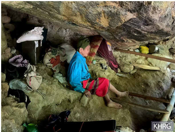
ဤပုံကို ၂၀၂၁ ခုနှစ်၊ ဧပြီလတွင် မူကြော်ခရိုင်၊ လူသောမြို့နယ်ရှိ ဂူတစ်ခုတွင် ရိုက်ယူခဲ့ပါသည်။ ဤနေရာသည် ၂၀၂၁ ခုနှစ်၊ မတ်လ ၂၇ ရက်နေ့တွင် SAC ဗုံးကြဲတိုက်ခိုက်မှုပြီးနောက် လူသောမြို့နယ်၊ ပေးကေး ကျေးရွာအုပ်စု၊ ဒေဘူးနီနယ်မြေရှိ ရွာသူရွာသားများ ထွက်ပြေးတိမ်းရှောင်ရာနေရာဖြစ်ပါသည်။ ပုံတွင် အသက် ၁၀၀ ကျော် ခန့်ရှိသော အဖွားအိုသည် ထွက်ပြေးတိမ်းရှောင်နေချိန်အတွင်း ဂူထဲတွင်ခိုလှုံနေပုံကို ဖော်ပြထားပါသည်။

နေရပ်ရွှေ့ပြောင်းနေထိုင်မှုသည် ရွာသားအားလုံးကြုံတွေ့ရသည့် အခက်အခဲများအား ပိုမိုဆိုးရွားလာစေပြီး အထူးသဖြင့် နာတာရှည်ရောဂါရှိသူများနှင့် အခြား အထူးလိုအပ်ချက်ရှိသူများအပါအဝင် အထူးအကူအညီလိုအပ်သူများအတွက် ပိုမိုဆိုးရွားစေသည်။ နေရပ်ရွှေ့ပြောင်းနေထိုင်စဉ်အတွင်း ကျန်းမာရေးစောင့်ရှောက်မှုနှင့် သင့်လျော်သော ရင်းမြစ်များအား လက်လှမ်းမီနိုင်မှု မရှိခြင်းက ၎င်းတို့၏ ကျန်းမာရေးနှင့် လုံခြုံရေး အခြေအနေများအပေါ် သက်ရောက်မှု ရှိစေသည်။ နေရပ်စွန့်ခွာကြသူများအတွက် အထူးလိုအပ်သည့် အကူအညီများနှင့် ဝန်ဆောင်မှုများပေးနိုင်ရန်အတွက် ဆောင်ရွက်ရန် အထူးလိုအပ်သည်။