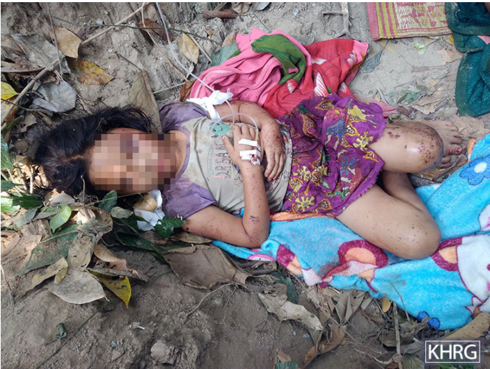
ဤပုံကို ၂၀၂၁ ခုနှစ်၊ မတ်လတွင် မူကြော်ခရိုင်၊ လူသောမြို့နယ်၊ ပေးကေးကျေးရွာအုပ်စု၊ ဒေဘူးနီနယ်မြေ တွင် ရိုက်ယူခဲ့ပါသည်။ ဤပုံသည် ၂၀၂၁ ခုနှစ်၊ မတ်လ ၂၇ ရက်နေ့၌ ဒေဘူးနီနယ် မြေအတွင်း ပထမဆုံးသော လေကြောင်း တိုက်ခိုက်မှုပြီးနောက် စစ်ပြေးရှောင်ရသည့်တစ်နေရာတွင် ဆေးကုသမှုခံယူနေသော ထိခိုက်ဒဏ်ရာရ အမျိုးသမီးငယ်တစ်ဦး၏ ပုံဖြစ်ပါသည်။

၂၀၂၁ ခုနှစ်၊ မတ်လမှစတင်၍ SAC သည် ဒေဘူးနီနယ်မြေတွင် လေကြောင်းတိုက်ခိုက်မှုများကို ပုံမှန်ပြုလုပ်ခဲ့ပြီး တိုက်ခိုက်မှုမတိုင်မီ လေကြောင်းထောက်လှမ်းမှုများကို မကြာခဏပြုလုပ်ခဲ့သည်။ ထို့ကြောင့် ရွာသူရွာသားများသည် နေရပ်စွန့်ခွာခဲ့ရပြီး အစဉ်အမြဲသတိထား၍ အဆက်မပြတ် ကြောက်ရွံ့နေကြဆဲဖြစ်ပြီး ပျက်စီးသွားသောအိမ်များနှင့် ရပ်ရွာအဆောက်အဦးများကို ပြန်လည်တည်ဆောက်ရန်ကြောက်ရွံ့ကြောင်း ရွာသားတစ်ဦးမှ တင်ပြထားသည်။ ဒေဘူးနီနယ်မြေ ယဟ--- ရွာတွင်နေထိုင်သော စောအတ--- မှ “[၂၀၂၁ ခုနှစ်၊ မတ်လ ၂၇ ရက်] လေကြောင်းတိုက်ခိုက်မှုအပြီးမှာ SAC စစ်လေယာဉ်တွေက ကင်းထောက်ဖို့ အဆက်မပြတ် ပြန်လာနေတာကြောင့် ရွာသားတွေက သူတို့ပုန်းအောင်းနေတဲ့နေရာမှာပဲ ဆက်နေခဲ့ကြတယ်။ [...] ယဘ--- ရွာမှာ ပြန်လာနေကြတဲ့ ရွာသားတွေ သုံးပုံတစ်ပုံလောက်ပဲ ရှိတယ်။” KHRG ၏ မှတ်တမ်းများအရ SAC သည် ဒေဘူးနီဒေသတွင် ၂၀၂၁ ခုနှစ်၊ မတ်လမှ ၂၀၂၄ ခုနှစ်၊ မတ်လအထိ လေကြောင်းတိုက်ခိုက်မှု ၁၃ ကြိမ်ထက် မနည်း ပြုလုပ်ခဲ့သည်။ ၂၀၂၁ ခုနှစ်၊ မတ်လနောက်ပိုင်း တိုက်ခိုက်မှုများတွင် အရပ်သားနှစ်ဦးထက်မနည်း ထိခိုက်သေဆုံးခဲ့ပြီး အနည်းဆုံး နေအိမ် ၂၁ လုံး၊ ဘုရားကျောင်းတစ်ကျောင်းနှင့် စိုက်ခင်းများထိခိုက် ပျက်စီးခဲ့သည်။ 40 ဒေဘူးနီနယ်မြေအား ကျယ်ကျယ်ပြန့်ပြန့် တိုက်ခိုက်ရသည့် အကြောင်းရင်းနှင့်ပတ်သက်၍ နော်အန--- မှ “သူတို့ရဲ့ ရည်ရွယ်ချက်က ဆေးခန်း၊ ခရိုင်ရုံး၊ ဒါမှမဟုတ် တပ်မဟာ [KNLA အခြေစိုက်စခန်း] နယ်မြေတွေထဲမှာရှိတဲ့ အဆောက်အဦးတွေ အားလုံးကိုဖျက်ဆီးဖို့ဖြစ်တယ်လို့ ခံစားရတယ်။” ဟုပြောခဲ့ပါသည်။ ယဘ--- ရွာသားတစ်ဦးဖြစ်သူ နော်အဖ--- မှ “သူတို့ [SAC လေယာဉ်]တွေက မြင်သမျှကို အားလုံးကိုပစ်တာ” ဟုဆိုပါတယ်။