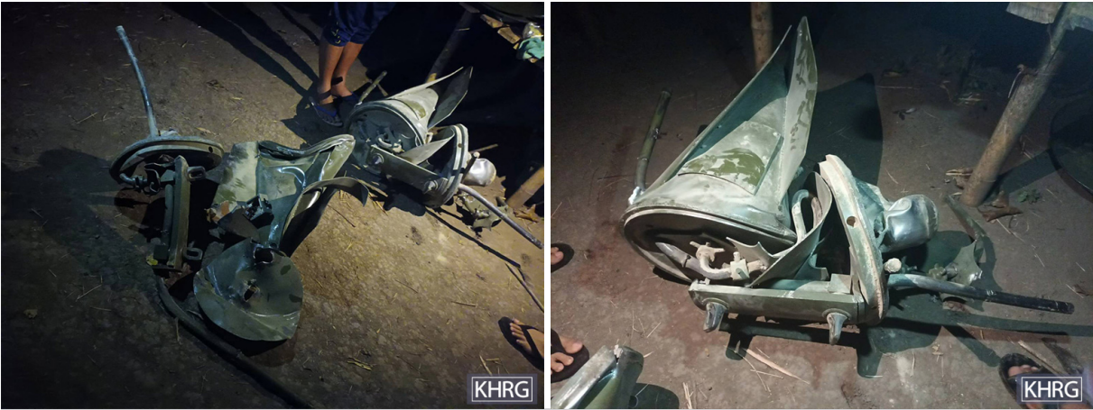
ဤပုံများကို ၂၀၂၂ ခုနှစ်၊ ဧပြီလတွင် ဒူးပလာယာခရိုင်၊ ကော်တရီ(ကော့ကရိတ်) မြို့နယ်၊ ဖလူးကျေးရွာအုပ်စု၊ လေးကော့ ကော်နယ်မြေအနီးရှိ နေရာတစ်ခုတွင် ရိုက်ယူခဲ့ပါသည်။ ၂၀၂၂ ခုနှစ်၊ ဧပြီလ ၁၀ ရက်နေ့၌ လေးကော့မြို့နှင့် ကော်တရီ (ကော့ကရိတ်) မြို့နယ်၊ ဖလူးကျေးရွာအုပ်စုရှိ ထဂ--- ကျေးရွာနှင့် ထဟ--- ကျေးရွာတို့တွင် ကရင်အမျိုးသား လွတ်မြောက်ရေး တပ်မတော် ကော်ဘရာစစ်ကြောင်း နှင့် SAC စစ်တပ်များကြား ပစ်ခတ်တိုက်ခိုက်မှုဖြစ်ပွားခဲ့သည်။ SAC ၏ စစ်တပ်ဂျက် လေယာဉ်များသည် လေးကော့နယ်မြေအတွင်း ဓာတုဗုံးနှစ်လုံးကြွချခဲ့ပြီး လေကြောင်း တိုက်ခိုက်မှုများကို တစ်နေကုန် ပြုလုပ်ခဲ့သည်။ ဤပုံများသည် ထိုဓာတုဗုံးများအနက်မှ တစ်လုံး၏ပုံဖြစ်ပါသည်။ (ဓာတ်ပုံ- KHRG)

ပျောက်သွားပြီး ခြေဖဝါး၊ ညှို့သကြီးနည်းနည်းနဲ့ လက်ဖဝါးပဲ ကျန်တော့တယ်။ ကျန်တဲ့ ခန္ဓာကိုယ်အစိတ်အပိုင်း တွေ အကုန်ပျောက်သွားတယ်။ သူ့အသား အပိုင်းအစတွေကိုပဲတွေ့ပြီး တာလပတ်ပေါ်မှာ စုထားတယ်။ တခြား သူ [သေသွားတဲ့ရွာသား] တွေလည်း ပေါင်နဲ့ ခန္ဓာကိုယ် အပိုင်းတွေ ပြတ်သွားတယ်” ဟု ရှင်းပြခဲ့သည်။ လေကြောင်း တိုက်ခိုက်မှု၏ အရေးတစ်ကြီးဖြစ်မှုကြောင့် စောဘဘ--- ကဲ့သို့ပင် ရွာသား အများအပြားသည် ၎င်းတို့၏ မိသားစု ဝင် သို့မဟုတ် အခြားရွာသားများ၏ ရုပ်အလောင်းများအား ပြန်လည်သယ်ယူနိုင်ခြင်း မရှိသည့်အပြင် အချို့သော ဖြစ်စဉ်များတွင် သင့်လျော်သော မြေမြုပ်သင်္ဂြိုဟ်ခြင်း အစီအစဉ်များ မလုပ်ဆောင်နိုင်ခဲ့ပေ။ ခလယ်လွှီထူခရိုင်၊ မူးမြို့နယ်၊ ရွာကျေးအေးကျေးရွာအုပ်စု၊ ထသ--- ရွာမှ ရွာသူတစ်ဦးဖြစ်သူ နော်အဒ--- မှ “အခုလောလောဆယ် မှာ ကျေးရွာအုပ်ထဲကလူတွေက ခွေးတွေဝက်တွေလို အသတ်ခံနေရတယ်။ ကျွန်မတို့က အလောင်းတွေကို [သင်္ဂြိုဟ်ခြင်းမရှိပဲ] ဒီလိုပဲ လွှင့်ပစ်ရတယ်။” ဟုပြောပြခဲ့ပါသည်။