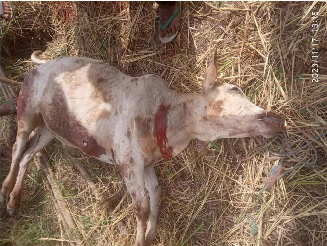
ဤဓာတ်ပုံကို ၂၀၂၃ ခုနှစ်၊ နိုဝင်ဘာလ ၁၇ ရက်နေ့၌ တောအူးခရိုင်၊ ထောတထူမြို့နယ်၊ ဒေးလိုမူနီဒေသရှိ မ--- ကျေးရွာတွင် ရိုက်ယူခဲ့သည်။ ထိုနေ့တွင် ခလရ(၃၉) အပါအဝင် SAC တပ်ဖွဲ့များသည် ဒေးလိုမူနီဒေသအတွင်းသို့ လက်နက်ကြီးများ ရမ်းသမ်းပစ်ခတ်ခဲ့သည်။ ပစ်ခတ်လိုက်သည့် လက်နက်ကြီးတစ်လုံးသည် မ---ကျေးရွာအနီးရှိ လယ်ယာထဲတွင် ကျရောက်ပေါက်ကွဲခဲ့သည်။ လက်နက်ကြီးအစအနသည် ရွာသားတစ်ဦးဖြစ်သူ စောယ---၏နွား တစ်ကောင်ကို ထိမှန်၍ သေဆုံးသွားခဲ့သည်။ ၂ (ဓာတ်ပုံ - ဒေသခံရွာသား)