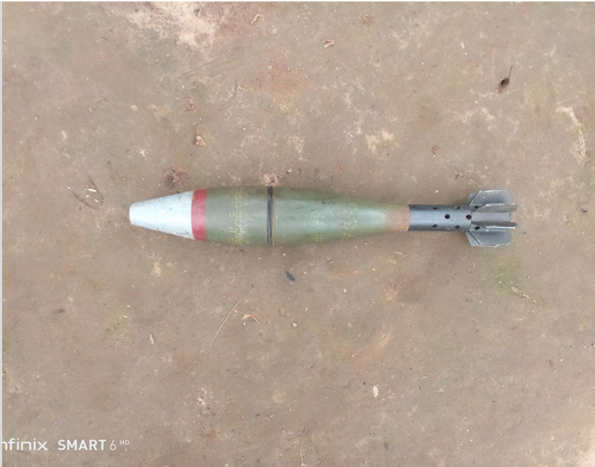
hfinix SMART 6 HP

ဤဓာတ်ပုံကို ၂၀၂၃ ခုနှစ်၊ စက်တင်ဘာလတွင် ဘိတ်-ထားဝယ်ခရိုင်၊ ကစယ်ဒိုမြို့နယ်၊ ကလဲမူထိနယ်မြေ၊ ခတ--- ကျေးရွာတွင် ရိုက်ယူခဲ့ပါသည်။ ဤပုံသည် ၂၀၂၃ ခုနှစ်၊ စက်တင်ဘာလ (၂၃) ရက်နေ့တွင် SAC များမှ ဒေသခံ PDF တို့နှင့် တိုက်ပွဲဖြစ်ပွားနေစဉ်အတွင်း ပစ်ခတ်လိုက်သော မပေါက်ကွဲသေးသည့် လက်နက်ကြီးပုံဖြစ်ပါသည်။ ကျေးရွာခေါင်းဆောင်များက KNU အာဏာရှိသူများအား အကြောင်းကြားပြီး ဤမပေါက်ကွဲသေးသောလက်နက်ကြီး (UXO) ကို ဖယ်ရှားစေလိုသည်။ ရပ်ရွာအတွင်း UXO တိုးများလာခြင်းကြောင့် ရွာသူရွာသားများသည် ၎င်းတို့၏ လယ်ယာများနှင့် စိုက်ခင်းများတွင် အလုပ်လုပ်ရန် လုံခြုံမှုမရှိဟု ခံစားကြသည်။