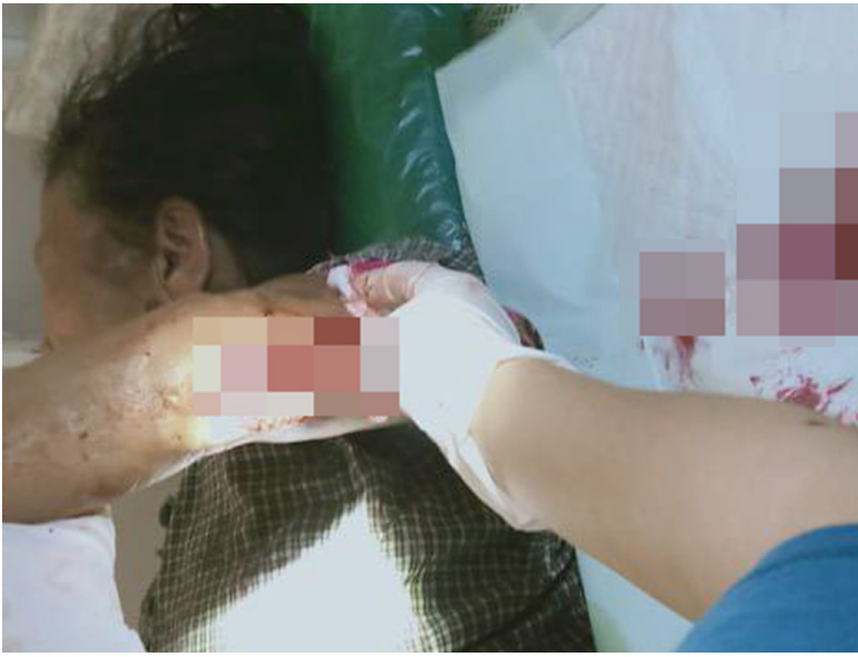
ဤဓာတ်ပုံကို ၂၀၂၃ ခုနှစ်၊ ဇွန်လ(၂၆)ရက်နေ့၌ ဘိတ်-ထားဝယ်ခရိုင်၊ လယ်ခိုစိုးမြို့နယ်၊ ကမောသွေးနယ်မြေ၊ ကသ--- ကျေးရွာအတွင်းရှိ ကဟ--- ဘုန်းကြီးကျောင်းတွင်ရိုက်ယူခဲ့ပါသည်။ ထိုနေ့တွင် အမည်မသိရှိရသော လက်နက်ကိုင်တပ်ဖွဲ့တစ်ဖွဲ့မှကျေးရွာအတွင်းသို့ လက်နက်ကြီးများ ပစ်ခတ်ခဲ့သောကြောင့် အသက် (၆၅) နှစ်အရွယ် ဒေါ်ခဂ--- နှင့်သူမ၏ သမီးဖြစ်သူ အသက် (၄၅) နှစ်အရွယ် မခယ--- တို့သည် ကဟ--- ဘုန်းကြီးကျောင်း၌ လက်နက်ကြီးအစအနဖြင့် ၎င်းတို့၏ လက်မောင်းတွင် ထိခိုက်ဒဏ်ရာရရှိခဲ့ကြသည်။ ထို့နောက် ၎င်းတို့ကို ကသ--- ကျေးရွာရှိ ခဆ--- ဆေးခန်းသို့ပို့ခဲ့ပြီး ထိုမှတစ်ဆင့် ထားဝယ်မြို့ရှိ ချမ်းမြေ့ဆေးရုံသို့ ဆေးကုသမှုခံယူရန် လွှဲပြောင်းပေးခဲ့သည်။

ဤဓာတ်ပုံကို ၂၀၂၃ ခုနှစ်၊ မတ်လတွင် ဘိတ်-ထားဝယ်ခရိုင်၊ လယ်မူလားမြို့နယ်၊ အောပူးနယ်မြေ၊ ကလ--- ကျေးရွာတွင် ရိုက်ယူခဲ့သည်။ ထိုနေ့တွင် ပုလောအောပူးတပ်စခန်း၌ အခြေစိုက်သော SAC ခြေလျင်တပ်ရင်း (ခလရ) အမှတ် (၂၈၅) မှ (၁၂၀) မမ လက်နက်ကြီး(၄)လုံးကို ကလ--- ကျေးရွာ အတွင်းသို့ပစ်ခတ်ခဲ့သောကြောင့် ရွာသား(၄)ဦး ထိခိုက်ဒဏ်ရာ ရရှိခဲ့သည်။ အသက် (၃၈) နှစ်အရွယ် စောကဘ--- သည် ၎င်း၏ခါးနှင့် လက်မောင်းတွင် ထိခိုက်ဒဏ်ရာရရှိခဲ့သည်။ အသက်(၃၀)နှစ်အရွယ် စောကမ--- သည် ၎င်း၏ရင်ဘတ်တွင် အနည်းငယ်ဒဏ်ရာရရှိခဲ့သည်။ အသက်(၂၅)နှစ်အရွယ် စောကယ--- သည် ၎င်း၏ခါးတွင် ထိခိုက်ဒဏ်ရာ ရရှိခဲ့ပြီး အသက်(၇)နှစ်အရွယ် စောကရ--- သည် ၎င်း၏ လည်ပင်းတွင် ထိခိုက်ဒဏ်ရာရရှိခဲ့သည်။ ထိုရွာသားများသည် ဘောလုံးကစားနေကြစဉ်တွင် ဆေးခန်းတစ်လုံးသို့ပို့ခဲ့ပြီး ထိုမှတစ်ဆင့် ပုလောမြို့