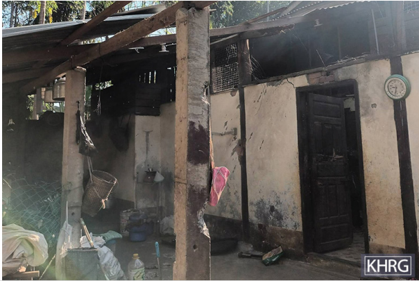
ဘယ်ဘက်ခြမ်းတွင်ဖော်ပြထားသောပုံကို ၂၀၂၄ ခုနှစ်၊ ဇန်နဝါရီလ (၁၀) ရက်နေ့၌ ဂလ--- ကျေးရွာနှင့် အထက်ရှိဖော်ပြထားသောပုံကို ၂၀၂၄ ခုနှစ်၊ ဇန်နဝါရီလ (၁၁) ရက်နေ့တွင် ခူးပလာယာခရိုင်၊ ကရူတူးမြို့နယ်၊ လောင်ကိုင်ကျေးရွာအုပ်စု၊ ဂဝ--- ကျေးရွာတွင် ရိုက်ယူခဲ့သည်။ ဘယ်ဘက်ခြမ်းရှိပုံသည် ဂလ--- ကျေးရွာရှိ ဘုန်းကြီးကျောင်းနှင့် အထက်ရှိပုံသည် ဂဝ--- ရွာသူတစ်ဦးဖြစ်သူ ဒေါ်ဂသ--- ပိုင်ဆိုင်သောအိမ်တစ်လုံးဖြစ်ပါသည်။ ထိုအဆောက်အဦး (၂) ခုစလုံးသည် ၂၀၂၃ ခုနှစ်၊ ဒီဇင်ဘာလ(၂၈)ရက်နေ့တွင် SAC မှကျေးရွာအတွင်းသို့ (၁၂၀)မမ လက်နက်ကြီးများ ပစ်ခတ်ခဲ့သောကြောင့် ပျက်စီးခဲ့ခြင်းဖြစ်သည်။ လက်နက်ကြီး ပေါက်ကွဲမှုကြောင့် ကလေး (၂) ဦး ထိခိုက်ဒဏ်ရာရရှိခဲ့ပြီး အခြားကလေး (၁) ဦးလည်း သေဆုံးခဲ့သည်။