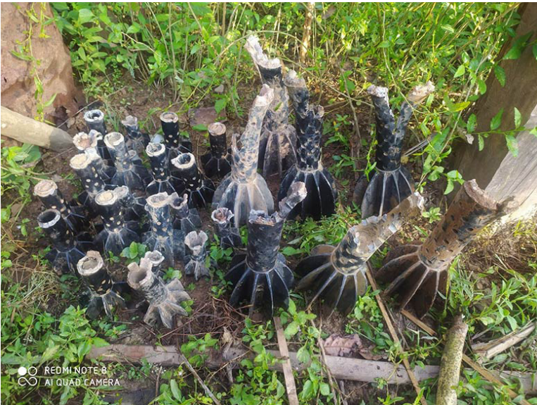
ဤဓာတ်ပုံကို ၂၀၂၃ ခုနှစ်၊ နိုဝင်ဘာလ (၂၇) ရက်နေ့တွင် ရရှိခဲ့ပြီး မူကြော်ခရိုင်၊ ဒွယ်လိုးမြို့နယ်၊ မထောကျေးရွာအုပ်စု၊ ခသ--- ကျေးရွာတွင် ရိုက်ယူခဲ့ခြင်းဖြစ်သည်။ ပုံတွင် SAC ပစ်ခတ်လိုက်သော လက်နက်ကြီးများ ပေါက်ကွဲပြီးနောက် ကျန်ခဲ့သော လက်နက်ကြီးအစအနအကြွင်းအကျန်များ ဖြစ်ပါသည်။ ဤကျန်ခဲ့သော ကျည်အစအနများကို ဒေသခံရွာသားများက စုဆောင်းခဲ့ကြသည်။