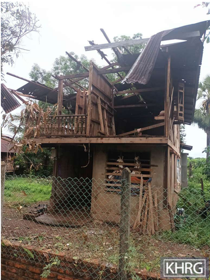
ဤဓာတ်ပုံကို ၂၀၂၃ ခုနှစ်၊ ဇွန်လတွင် ခူးပလာယာခရိုင်၊ ဝေါ်ရေမြို့နယ်၊ တခွန်တိုင်ကျေးရွာအုပ်စု၊ ဂမ--- ကျေးရွာတွင် ရိုက်ယူခဲ့သည်။ ပုံတွင် ၂၀၂၃ ခုနှစ်၊ ဇွန်လ (၁၇) ရက်နေ့၌ SAC အမတ် (၃၁၈) မှ လက်နက်ကြီးများပစ်ခတ်မှုကြောင့် ပျက်စီးသွားသော ရွာသားအိမ်တစ်လုံးကိုဖော်ပြထားပါသည်။ ဤအဖြစ်အပျက်တွင် အိမ်အလုံးပေါင်းများစွာ ပျက်စီးခဲ့သည်။ ဤ SAC တပ်ဖွဲ့များသည် ဇွန်လ (၁၉) ရက်နေ့တွင် လက်နက်ကြီးများထပ်မံပစ်ခတ်ခဲ့၍ ရွာသားနှစ်ဦး ထိခိုက်ဒဏ်ရာရရှိခဲ့သည်။