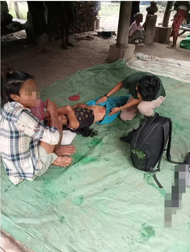
ဤဓာတ်ပုံကို ၂၀၂၃ ခုနှစ်၊ ဩဂုတ်လ ၂၆ ရက်နေ့၌ တောအူးခရိုင်၊ ထောတထူမြို့နယ်၊ အထူးဒေသရှိ ပ---ကျေးရွာတွင် ရိုက်ယူခဲ့သည်။ ပုံတွင် SAC မှ လက်နက်ကြီးများ ရမ်းသမ်းပစ်ခတ်၍ ပ---ကျေးရွာနှင့် အနီးပတ်ဝန်းကျင်တွင် ကျရောက်ပေါက်ကွဲသွားပြီး လက်နက်ကြီး အစသည် အသက် (၄၈)နှစ်အရွယ် ရွာသားတစ်ဦး ဖြစ်သူ မ---အား ထိမှန်ဒဏ်ရာ ရရှိခဲ့သောအခြေအနေကို ဖော်ပြထားသည်။ ၁