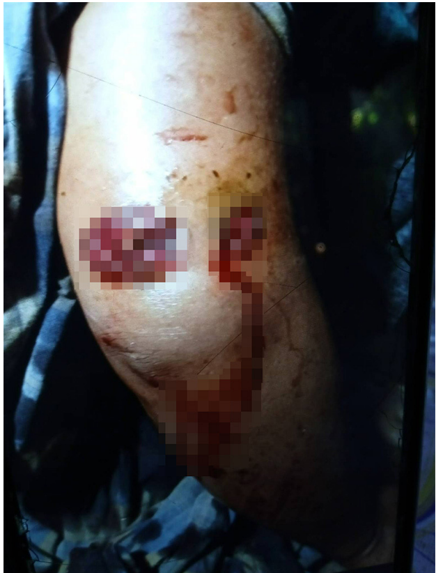
ဤဓာတ်ပုံကို ၂၀၂၃ ခုနှစ်၊ နိုဝင်ဘာလ ၂၇ ရက်နေ့၌ တောအူးခရိုင်၊ ထောတထူမြို့နယ်၊ ဒေးလိုမူနီကျေးရွာအုပ်စု၊ ဗ--- ကျေးရွာတွင်ရိုက်ယူခဲ့သည်။ နိုဝင်ဘာလ ၂၇ ရက်နေ့၌ ည (၉:၀၄)မိနစ်ခန့်တွင် (၄)မိုင်တပ်စခန်း နှင့် (၇)မိုင်တပ်စခန်းတွင် အခြေစိုက်သော ခြေလျင်တပ်ရင်း (ခလရ) အမှတ်(၃၉) အပါအဝင် SAC တပ်ဖွဲ့များသည် ဒေးလိုမူနီဒေသအတွင်းသို့ လက်နက်ကြီးများ ရမ်းသမ်းပစ်ခတ်ခဲ့သည်။ ပစ်ခတ်လိုက်သည့် လက်နက်ကြီးတစ်လုံးသည် ရွာသားတစ်ဦး၏ ရော်ဘာခြံထဲတွင် ကျရောက်ပေါက်ကွဲသွားပြီး ရော်ဘာပင်အချို့နှင့် လူနေအိမ်တစ်လုံးကို ထိမှန်ပျက်စီးသွားခဲ့သည်။ ရွာသားတစ်ဦးဖြစ်သူ နော်ဘ---ကိုလည်း ထိမှန်၍ သူမ၏ တံတောင်ဆစ်တွင် ဒဏ်ရာရရှိခဲ့သည်။