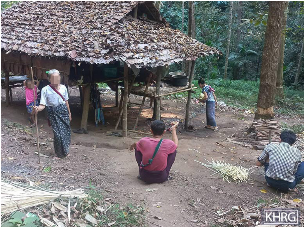
ဤပုံကို ၂၀၂၃ ခုနှစ်၊ ဒီဇင်ဘာလ(၂၀)ရက်နေ့၌ ဒူးပလာယာခရိုင်၊ ကော်တရီမြို့နယ်၊ ကော်နွယ်ကျေးရွာအုပ်စု၊ ဂရ---ကျေးရွာအနီးရှိ စိုက်ခင်းတစ်ခုတွင် ရိုက်ယူခဲ့သည်။ ပုံတွင် ၂၀၂၃ ခုနှစ်၊ နိုဝင်ဘာလ(၂၉)ရက်နေ့၌ SACမှ ၎င်းတို့၏ကျေးရွာထဲသို့ လက်နက်ကြီးယမ်းသမ်းပစ်ခတ်မှုကြောင့် လယ်ယာများနှင့် အနီးနားရှိ တောထဲသို့ ထွက်ပြေးတိမ်းရှောင်ရသော ရွာသားများကို ဖော်ပြထားပါသည်။

ကရင်လူ့အခွင့်အရေးအဖွဲ့ (KHRG) အကြောင်း ၁၉၉၂ ခုနှစ်တွင် စတင်တည်ထောင်ခဲ့သော ကရင်လူ့အခွင့်အရေးအဖွဲ့ (KHRG) သည် မြန်မာပြည်အရှေ့တောင်ပိုင်းရှိ လူ့အခွင့်အရေးအခြေအနေတိုးတက်ကောင်းမွန်လာစေရန်အတွက်လုပ်ဆောင်လျက်ရှိသည့် လွတ်လပ်သောလူထုအခြေပြုအဖွဲ့အစည်းတစ်ခုဖြစ်ပါသည်။ လူ့အခွင့်အရေးချိုးဖောက်ခံရမှုများကိုမှတ်တမ်းပြုစုနိုင်ရန် KHRG မှ ဒေသခံရွာသားများကိုလေ့ကျင့်သင်ကြားပေးလျက်ရှိပါသည်။ ဒေသခံရွာသားများမှခံစားရသော လူ့အခွင့်အရေးချိုးဖောက်ခံရမှုများကို ထင်ဟပ်စေရန်အတွက် ၎င်းတို့၏ အသံ၊ အတွေ့အကြုံ၊ စိုးရိမ်ပူပန်မှုများ နှင့် အမြင်သဘောထားများကိုဖော်ပြပေးသောအစီရင်ခံစာများကို ရေးသားထုတ်ဝေလျက်ရှိပါသည်။ KHRG ၏ လုပ်ငန်းများကိုပိုမိုသိရှိလိုပါက ၎င်း၏ဝဘ်ဆိုက် www.khrg.org တွင် ဝင်ရောက်ကြည့်ရှုလေ့လာနိုင်ပါသည်။