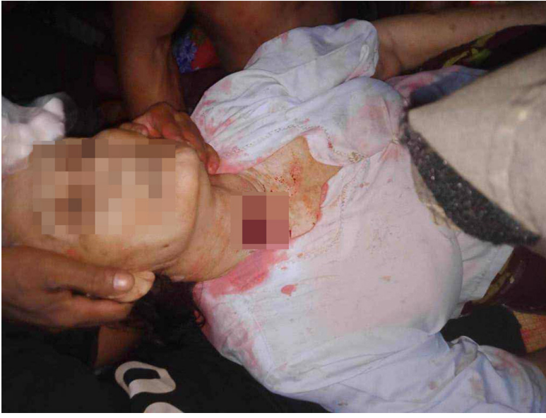
ဤဓာတ်ပုံကို ၂၀၂၃ ခုနှစ်၊ ဩဂုတ်လ(၁၉)ရက်နေ့၌ ဘိတ်-ထားဝယ်ခရိုင်၊ လယ်မူလားမြို့နယ်၊ ပုလောနယ်မြေ၊ ခလ--- ကျေးရွာတွင် ရိုက်ယူခဲ့သည်။ ၂၀၂၃ ခုနှစ်၊ ဩဂုတ်လ (၁၉) ရက်နေ့တွင် ပုလောမြို့၌ အခြေစိုက်သော SAC ခြေလျင်တပ်ရင်း (ခလရ) အမှတ်(၂၈၅)သည် ခလ--- ကျေးရွာ အတွင်းသို့ လက်နက်ကြီးများ ယမ်းသမ်းပစ်ခတ်ခဲ့သောကြောင့် သက်ကြီးရွယ်အို အမျိုးသမီးတစ်ဦးသေဆုံးခဲ့ပြီး သူမ၏သားလည်း ထိခိုက်ဒဏ်ရာ ရရှိခဲ့သည်။ ဤ SAC တပ်ဖွဲ့များသည် ဒေသအတွင်းပုံမှန် ပစ်ခတ်မှုများပြုလုပ်လေ့ရှိသည်။ (ဓာတ်ပုံ - ဒေသခံရွာသား)

ဤဓာတ်ပုံကို ၂၀၂၃ ခုနှစ်၊ ဇွန်လ(၂၆)ရက်နေ့၌ ဘိတ်-ထားဝယ်ခရိုင်၊ လယ်ခိုစိုးမြို့နယ်၊ ကမောသွေးနယ်မြေ၊ ကသ--- ကျေးရွာအတွင်းရှိ ကဟ--- ဘုန်းကြီးကျောင်းတွင်ရိုက်ယူခဲ့ပါသည်။ ထိုနေ့တွင် အမည်မသိရှိရသော လက်နက်ကိုင်တပ်ဖွဲ့တစ်ဖွဲ့မှကျေးရွာအတွင်းသို့ လက်နက်ကြီးများ ပစ်ခတ်ခဲ့သောကြောင့် အသက် (၆၅) နှစ်အရွယ် ဒေါ်ခဂ--- နှင့်သူမ၏ သမီးဖြစ်သူ အသက် (၄၅) နှစ်အရွယ် မခယ--- တို့သည် ကဟ--- ဘုန်းကြီးကျောင်း၌ လက်နက်ကြီးအစအနဖြင့် ၎င်းတို့၏ လက်မောင်းတွင် ထိခိုက်ဒဏ်ရာရရှိခဲ့ကြသည်။ ထို့နောက် ၎င်းတို့ကို ကသ--- ကျေးရွာရှိ ခဆ--- ဆေးခန်းသို့ပို့ခဲ့ပြီး ထိုမှတစ်ဆင့် ထားဝယ်မြို့ရှိ ချမ်းမြေ့ဆေးရုံသို့ ဆေးကုသမှုခံယူရန် လွှဲပြောင်းပေးခဲ့သည်။ (ဓာတ်ပုံ - ဒေသခံရွာသား)