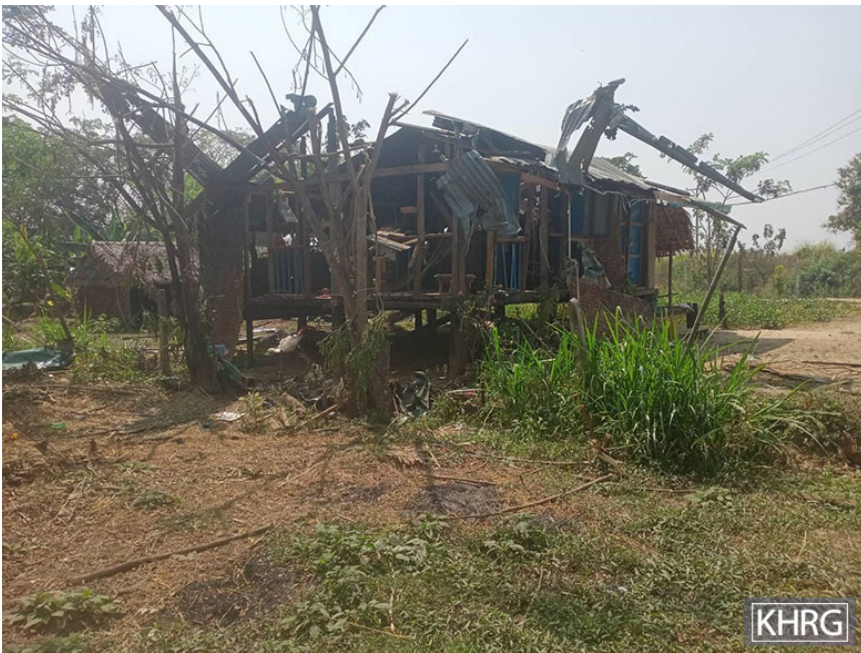
ဤပုံကို ၂၀၂၄ ခုနှစ်၊ ဖေဖော်ဝါရီလ ၂၂ ရက်နေ့၌ ခလယ်လွှဲထူခရိုင်၊ မူးမြို့နယ်၊ နို့တိုးဒီးကျေး ရွာအုပ်စု၊ ဇေ--- ကျေးရွာတွင် ရိုက်ယူခဲ့သည်။ ၂၀၂၄ ခုနှစ်၊ ဖေဖော်ဝါရီလ ၁၉ ရက်နေ့၌ ပန္နဲကုန်းမြို့အနီး နားတွင် တည်ရှိသော တပ်စခန်းတစ်လုံးတွင် အခြေစိုက်သည့် SAC ရွှေဝတပ်ရင်းသည် ဒေသအတွင်း လက်နက်ကြီးများရမ်းသမ်းပစ်ခတ်ခဲ့ပြီး လက်နက်ကြီး (၃) လုံးသည် ဇေ---ကျေးရွာအတွင်းသို့ ကျရောက် ပေါက်ကွဲခဲ့သည်။ လက်နက်ကြီးအစအနသည် အသက်(၄၈)နှစ်အရွယ် ရွာသားတစ်ဦးဖြစ်သူ ဈဈ---အား ထိမှန်၍ သေဆုံးသွား ခဲ့ပြီး အခြားရွာသား (၃) ဦးကိုလည်း ထိမှန်၍ ဒဏ်ရာရရှိခဲ့သည်။ ထို့အပြင် ရွာသားများ၏ နေအိမ်များကိုလည်း ထိမှန်ပျက်စီးခဲ့သည်။ ဒဏ်ရာရရှိသည့် ရွာသား(၃)ဦးကို ရေလဲကျေးရွာ