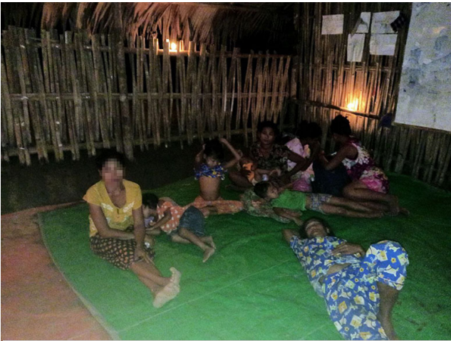
ဤပုံကို ၂၀၂၃ ခုနှစ် စက်တင်ဘာလ ၁၃ ရက်နေ့တွင် မြိတ်-ထားဝယ်ခရိုင်၊ တနောသရီးမြို့နယ်၊ ခမာ---ကျေးရွာ အုပ်စု၊ ခမာ--- ကျေးရွာတွင် ရိုက်ကူးထားခြင်းဖြစ်သည်။ ပုံတွင် ဘန်လောရွာသားများသည် SAC ၏ ၂၀၂၃ ခုနှစ် စက်တင်ဘာလ ၂၅ ရက်နေ့အထိ အဆင်အခြင်မဲ့စွာ လက်နက်ကြီးများအား ဆက်တိုက် ပစ်ခတ်မှုများကို ကြောက်သဖြင့် ၎င်းတို့၏ လယ်ယာများတွင် ရွှေ့ပြောင်းနေထိုင်ကြသည့် ပုံဖြစ်သည်။

အချို့သော ကိစ္စရပ်များတွင် SAC တပ်စခန်းများသည် ကျေးရွာများစွာကို စုပေါင်း တိုက်ခိုက်ကြသည်။ ဤသို့ ကြီးကြီးမားမား တိုက်ခိုက်မှုများသည် အရပ်သား အများအပြားအား နေရပ်ရွှေ့ပြောင်းနေထိုင်မှုကို ဖြစ်ပေါ်စေသည်။ ဥပမာအားဖြင့် ၂၀၂၃ ခုနှစ် မတ်လ ၉ ရက်နေ့မှ ၁၂ ရက်နေ့အထိ ခလယ်လွှဲထူခရိုင်၊ ဆောထီးမြို့နယ်မှ ထောင်ပေါင်းများစွာသော ရွာသားများသည် ပိုမိုတိုးမြှင့်လာသည့် အဆင်အခြင်မဲ့ လက်နက်ကြီး ပစ်ခတ်မှုများနှင့် စစ်ဘက်ဆိုင်ရာ လှုပ်ရှားမှုများကြောင့် ထွက်ပြေးတိမ်းရှောင်ခဲ့ကြရသည်။ ၂၀၂၃ ခုနှစ် မတ်လ ၁၂ ရက်နေ့ နံနက် ၃ နာရီ ၄၅ မိနစ် အချိန်တွင် SAC ၏ ပူးပေါင်းတပ်ဖွဲ့များသည် ခမရ ၂၀၊ တပ်မ ၇၇၊ ၈၈၊ ၄၄၊ ၃၃၊ ခလရ ၅၇ နှင့် ခမရ ၃၅၀၊ ၂၆၄ တို့သည် ဆက်စုနှင့် သက်ကယ်ကုန်း ကျေးရွာများသို့ လက်နက်ကြီးများ အဆင်အခြင်မဲ့စွာ ပစ်ခတ်ခဲ့သည်။ ၎င်းတို့သည် ထိုနေ့ နံနက် ၅ နာရီမှ ၁၁ နာရီအတွင်းတွင် လက်နက်ကြီး အလုံးပေါင်း ၂၀၀ ကျော်ကို ရွာသားများ ခိုလှုံနေထိုင်လျက်ရှိသည့် ဆက်စု ကျေးရွာ၊ သက်ကယ်ကုန်း ကျေးရွာ၊ ညောင်ပင်ကြီးရွာသစ်၊ သိုက်တုကုန်း ကျေးရွာ၊ ပိုင်းကျုံကျေးရွာနှင့် ပြေးရေးကျေးရွာများအတွင်းသို့ ပစ်ခတ်ခဲ့သည်။ ထိုကျေးရွာ ခြောက်ရွာမှ ရွာသားများသည် အေးကနဲကျောတား၊ ရွှေကျင်၊ မတ်ဒေါက်နှင့် ညောင်လေးပင်မြို့များသို့ ထွက်ပြေးတိမ်းရှောင်ခဲ့ကြသည်။ SAC သည် ထိုကျေးရွာများအတွင်းသို့ ဝင်ရောက်ပြီး ရွာသားများ၏ ပိုင်ဆိုင်မှုများကို လုယူဖျက်စီးခဲ့ကြသည်။ ခလယ်လွှဲထူခရိုင်၊