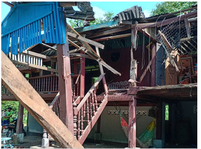
KHRG သည် ဤပုံကို ၂၀၂၃ ခုနှစ် ဩဂုတ်လ ၂ ရက်နေ့တွင် ဒေသခံ ရွာသားတစ်ဦးထံမှ ရရှိခဲ့သည်။ ပုံတွင် ၂၀၂၃ ခုနှစ် မေလ ၂၇ ရက်နေ့တွင် ဒူးပလာယာခရိုင်၊ ကော်တရီမြို့နယ်၊ ရွာတန်းရှည်ကျေးရွာ အုပ်စု၊ ကြာအင်းကုန်းကျေးရွာ သို့ SAC မှ ၁၂၀ မမ ပစ်ခတ်ခဲ့ခြင်းကြောင့် ရွာသားတစ်ဦး၏ နေအိမ် ပျက်စီးခဲ့ပုံ ဖြစ်သည်။