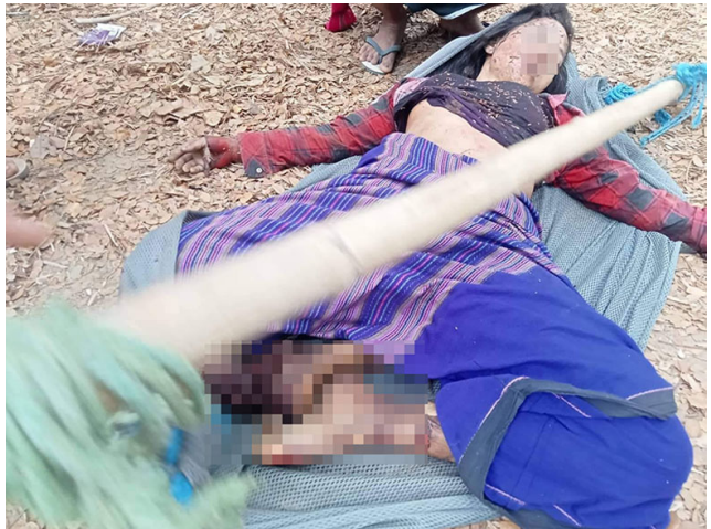
ဤပုံကို ၂၀၂၃ ခုနှစ် ဖေဖော်ဝါရီလ ၂၃ ရက်နေ့တွင် ခလယ်လွီထူးခရိုင်၊ ဆောထိမြို့နယ်၊ ပျဉ်ရေကျေးရွာအုပ်စု၊ ခအ--- ကျေးရွာတွင် ရိုက်ကူးခဲ့သည်။ ပုံတွင် SAC ခမရ အမှတ် (၂၀) ၏ လက်နက်ကြီးပစ်ခတ်မှုကြောင့် သေဆုံးခဲ့သော အသက် ၃၅ နှစ်အရွယ် နော်အခအ--- ၏ ပုံဖြစ်သည်။

၁၂ နာရီတွင် ခေါသူပွာတပ်စခန်းတွင် အခြေစိုက်သည့် ခမရ အမှတ် ၄၀၈ မှ ဒေသတွင်းသို့ ၈၁ မမ ပစ်ခတ်ခဲ့သည့် အခြားဖြစ်ရပ်တစ်ခု ဖြစ်ပွားခဲ့သည်။ အမြောက်ကျည်ဆံ တစ်ခုသည် ဒွယ်လိုးမြို့နယ်၊ မထော်ကျေးရွာအုပ်စု၊ ခအ--- ကျေးရွာမှ အသက် ၃၇ နှစ်အရွယ် ရွာသား စောအဘ---၏ အိမ်အနီးသို့ ကျခဲ့သည်။ သူသည် လက်နက်ကြီး ထိမှန်သည့် အချိန်တွင် သူ၏ အိမ်အောက်တွင် ပုန်းခိုနေခဲ့သည်။ ရွာသားများသည် ၎င်းအား ဆေးကုသမှုခံယူနိုင်ရန်အတွက် ခအ--- ဆေးရုံသို့ ခေါဆောင်သွားရန် ကြိုးစားခဲ့သော်လည်း ၎င်း၏ ဒဏ်ရာပြင်းထန်မှုနှင့် လမ်းခရီးကြာရှည်သည့်အတွက် ဆေးရုံသို့မရောက်မီ လမ်းခရီးတွင် သေဆုံးခဲ့သည်။ စောအဘ--- တွင် သူ့အား မိသားစုစားဝတ်နေရေးအတွက် ဗိုဗိုနေရသည့် သူ၏ အမျိုးသမီးနှင့် ကလေးများ ကျန်ရစ်ခဲ့ပြီး မည်သည့်ကူညီပံ့ပိုးမှုမရရှိခဲ့ပါ။ SAC ၏ အမှတ် ၈ စစ်ဆင်ရေး ကွပ်ကဲမှုဌာနချုပ် (စကခ) လက်အောက်ခံ တပ်ရင်းမှူး ဇော်မင်းထက် ဦးဆောင်သည့် SAC ၏ ခမရ တပ် အမှတ် (၄၀၈) သည် ဤတိုက်ခိုက်မှုအား ကျူးလွန်ခဲ့ခြင်းဖြစ်သည်။