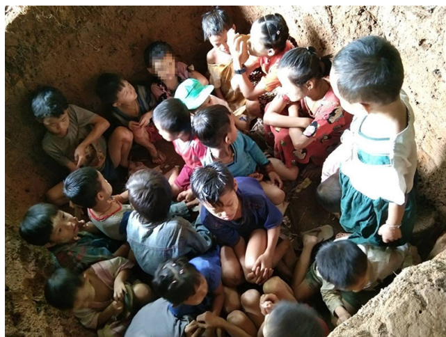
ဤပုံကို ၂၀၂၃ ခုနှစ် ဩဂုတ်လ ၁၅ ရက်နေ့တွင် မူကြော်ခရိုင်၊ ဒွယ်လိုးမြို့နယ်၊ မထော်ကျေးရွာအုပ်စု၊ ခဗ--- ကျေးရွာတွင် ရိုက်ကူးထားခြင်းဖြစ်သည်။ ပုံတွင် ကျေးရွာများအတွင်းသို့ SAC ၏ လက်နက်ကြီးများ ပစ်ချနေချိန်တွင် ကျိုးခီးကျောင်းသားများမှ ဗုံးခိုကျင်းတွင် ကြောက်ရွံ့စွာ ပုန်းခိုနေသည့် ပုံဖြစ်သည်။