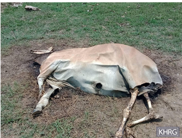
ဤပုံကို ၂၀၂၃ ခုနှစ် မေလ ၂၇ ရက်နေ့တွင် ခလယ်လို့ထူခရိုင်၊ မူးမြို့နယ်၊ မိုတွင်ကျေးရွာအုပ်စု၊ စဝင်းကျွန်းတောင် ကျေးရွာတွင် ရိုက်ကူးခဲ့သည်။ ပုံမှာ SAC ၏ လက်နက်ကြီးပစ်ခတ်မှုကြောင့် သေဆုံးနေသည့် နွားတစ်ကောင်ပုံဖြစ်ပြီး ထိုပစ်ခတ်မှုကြောင့် နေအိမ်များလည်း ပျက်စီးခဲ့ပြီး ရွာသားများ နေရပ်ရွှေ့ပြောင်း နေထိုင်ခဲ့ကြရသည်။ (ဓာတ်ပုံ - KHRG)

မွေးမြူရေးနှင့် ကျွဲနွားကျောင်းခြင်းများသည် ကျေးလက်ဒေသနေ ရွာသားများ၏ အသက်မွေးဝမ်းကျောင်း လုပ်ငန်းများအတွက် အရေးကြီးသည့် အရင်းအမြစ်တစ်ခုဖြစ်သည်။ ရွာသားများသည် ၎င်းတို့၏ ကျွဲနွားများနှင့် မွေးမြူရေး တိရိစ္ဆာန်များအား ၎င်းတို့၏ ဥယျာဉ်ခြံများနှင့် လယ်ယာများတွင် မွေးမြူလေ့ရှိပြီး ကျွဲနွားများနှင့် ကြက်ငှက်များကို ထားလေ့ရှိသည်။ လက်နက်ကြီး ပစ်ခတ်မှုကြောင့် နေအိမ်များ ပျက်စီးဆုံးရှုံးရသည့်အခါတွင် မွေးမြူရေး တိရိစ္ဆာန်များလည်း ထိခိုက်ဒဏ်ရာရခြင်း သေကြေခြင်းများ ရှိသည်။ KHRG သို့ တင်ပြချက်အရ ၂၀၂၃ ခုနှစ် ဇန်နဝါရီလ ၄ ရက်နေ့တွင် ဒူးပလာယာခရိုင်၊ နို့တကောမြို့နယ်၊ ၁၈—ကျေးရွာအုပ်စု၊ ၁၈— ကျေးရွာနယ်မြေတွင် ဖြစ်ပွားသည့် တိုက်ပွဲအပြီးတွင် SAC မှ ကျေးရွာအတွင်းသို့ လက်နက်ကြီးများ အဆင်အခြင်မဲ့စွာ ပစ်ခတ်ခဲ့သည်။ ထိုသို့ပစ်ခတ်ခြင်းကြောင့် ရွာသားတစ်ဦး၏ နွားတကောင် သေဆုံးခဲ့ပြီး နေအိမ်မှ ပစ္စည်းများ ပျက်စီးခဲ့သည်။ ထိုသို့ပစ်ခတ်ပြီးနောက်မကြာမီတွင် SAC တပ်သား အချို့သည် ပိုင်ရှင်၏ နေအိမ်သို့ လာရောက်လာခဲ့ပြီး ထိုဖြစ်ရပ်အား မည်သို့ထံသို့ဖြစ်စေ တင်ပြခြင်း မပြုရန်အတွက် နှိပ်စက်ညှဉ်းပမ်းခြိမ်းခြောက်ခဲ့သည်။ အခြားသော ဖြစ်ရပ်တစ်ခုသည် ၂၀၂၃ ခုနှစ် ဇူလိုင်လ ၂၇ ရက်နေ့တွင် ဖြစ်ပျက်ခဲ့ပြီး SAC ၏ ခလရ အမှတ် (၉) မှ သထုံမြို့နယ်၊ ဝေးရောကျေးရွာအုပ်စု၊ ဝေးရောကျေးရွာသို့ လက်နက်ကြီးများ ပစ်ခတ်ခဲ့သည့်အတွက် နေအိမ်များနှင့် ပိုင်ဆိုင်မှုများ ပျက်စီးခဲ့ပြီး ဒေသခံ ရွာသားတစ်ဦးပိုင်ဆိုင်သည့် နွား ၁ ကောင် သေဆုံးကာ နွား ၅ ကောင် ထိခိုက်ဒဏ်ရာရခဲ့သည်။ ထို့အပြင် တောအုန်းခရိုင်၊