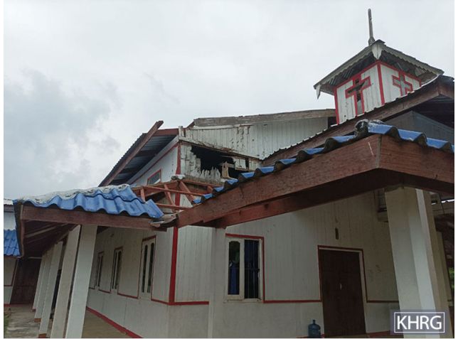
ဤပုံကို ၂၀၂၃ ခုနှစ် ဧပြီလတွင် မြိတ်-ထားဝယ်ခရိုင်၊ တနောသရီမြို့နယ်၊ မဲဝါး ကျေးရွာတွင် ရိုက်ကူးခဲ့သည်။ ပုံမှာ ၂၀၂၃ ခုနှစ် ဧပြီလ ၂၇ ရက် နှင့် ၂၉ ရက်တွင် SAC နှင့် ပြည်သူ့ကာကွယ်ရေးတပ်မတော် -ကရင် အမျိုးသားလွတ်မြောက်ရေးတပ်မတော် ပူးပေါင်းတပ်များ ကြား တိုက်ပွဲအတွင်း ပျက်စီးခဲ့သည့် ဘုရားကျောင်း အဆောက်အအုံ၏ ပုံဖြစ်သည်။

ပေါက်ဂိတ်၊ ဘုန်းကြီးကျောင်း ၂ ဆောင်နှင့် ဆေးခန်း ၁ ခု ပျက်စီးခဲ့ရသည်။ ၂၀၂၃ ခုနှစ် မေလ ၂၇ ရက်နေ့တွင် ဒူးပလာယာခရိုင်၊ ကော်တရီမြို့နယ်၊ ထော်ဝါးလော် ကျေးရွာအုပ်စု၊ ကွီးခလယ်ကျေးရွာမှ ဘုန်းကြီးကျောင်း တစ်ကျောင်းသည်လည်း ပိုချိုမှု တပ်စခန်းတွင် အခြေစိုက်သည့် SAC ၏ ခလရ ၅၅၈ ၏ ပစ်ခတ်မှုကြောင့် ပျက်စီးခဲ့သည်။