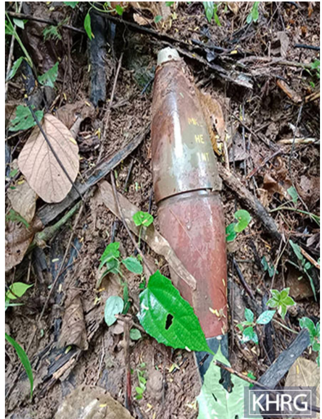
ဤပုံကို ၂၀၂၃ ခုနှစ် ဇူလိုင်လ ၁၂ ရက်နေ့တွင် ဘူးသိုမြို့နယ်၊ ခေါပူးကျေးရွာအုပ်စု၊ ဒာ--- နှင့် ဒခ--- ကျေးရွာများကြားမှ လယ်ကွင်းများတွင် ရိုက်ကူးထားခြင်း ဖြစ်သည်။ ပုံမှာ SAC မှ ပစ်ခတ်ခဲ့သော မပေါက်ကွဲသေးသည့် ၁၂၀ မမ အမြောက်ကျည်ပုံ ဖြစ်သည်။

အချို့သော ဒေသခံ ရွာသားများသည် မပေါက်ကွဲသေးသည့် လက်နက်ခဲယမ်းများ၏အနုတရားကိုသတိပြုမိခြင်းမရှိပါ။ အထူးသဖြင့် ကလေးများမှာ အနုတရားကြီးမားစွာ ကြုံရ