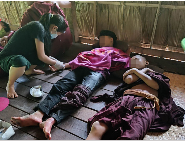
ဤပုံကို ၂၀၂၃ ခုနှစ် မေလ ၂၇ ရက်နေ့တွင် ဒူးသထူးခရိုင်၊ သထူးမြို့နယ်၊ ရွှေရောင်ပြကျေးရွာအုပ်စု၊ ခင--- ကျေးရွာ တွင် ရိုက်ကူးခဲ့သည်။ ပုံတွင် SAC ၏ အမြောက် တပ် အမှတ် (၃၁၄) မှ ဘုန်းကြီးကျောင်း ပရဂုဏ်အတွင်း သို့ လက်နက်ကြီး ပစ်ခတ်မှုကြောင့် ယောက်ျားလေးတစ်ဦး နှင့် ကိုရင်လေး တစ်ဦး ဒဏ်ရာရခဲ့သည့် ပုံကို ပြနေသည်။

တိုက်ခိုက်မှု ခံရပြီး နောက်တွင် ၆၀ မမ အမြောက်များကို ၎င်းတို့ တပ်စခန်းအနီးတဝိုက်ရှိ ကျေးရွာများအတွင်းသို့ ပစ်ခတ်ခဲ့သည်။ ကျည်ဆံတစ်ခုမှာ ခဖ--- ကျေးရွာရှိ စောအဖ--- နေအိမ်အနီးသို့ ကျရောက်ခဲ့ပြီး သူ၏ယောက်ျားမဖြစ်သူ၏ ဦးခေါင်းနှင့် ရင်ဘတ်ကို ကျည်ဆံထိမှန် သေဆုံးခဲ့သည်။ သူ၏တကိုယ်လုံးတွင်လည်း ထိခိုက်ဒဏ်ရာများ ရရှိခဲ့သည်။ အလားတူပင် ၂၀၂၃ ခုနှစ် ဇွန်လ ၂၉ ရက်နေ့ ညနေ ၆ နာရီတွင် သုံးတိုင်ကျေးရွာ အနီးတွင် အခြေစိုက်သော SAC ခြေလျင်တပ်ရင်း အမှတ် ၂၈၃ သည် ၎င်းတို့အား ကရင်အမျိုးသား လွတ်မြောက်ရေးတပ်မတော် တပ်ရင်း (၁၇)၊ တပ်ခွဲ (၂) နှင့် ပြည်သူ့ကာကွယ်ရေးတပ်မတော်တို့က ဒရုန်းဖြင့် တိုက်ခိုက်မှုကို ခံရပြီးနောက်တွင် ဒူးပလာယာခရိုင်၊ နီတကောမြို့နယ်၊ နီတကော ကျေးရွာအုပ်စု၊ ခင--- ကျေးရွာအတွင်းသို့ လက်နက်ကြီးများပစ်ခတ်ခဲ့သည်။ နောက်တနေ့ ၂၀၂၃ ခုနှစ် ဇူလိုင်လ ၃၀ ရက်နေ့တွင် SAC ခြေလျင်တပ်ရင်း အမှတ် ၂၈၃ က လက်နက်ကြီးများ ထပ်မံ ပစ်ခတ်ခဲ့ပြီး အသက် ၄၄ နှစ်အရွယ် ရွာသားတစ်ဦးဖြစ်သော စောအဂ--- ၏ ဦးခေါင်းနှင့် လက်မောင်းများကို ထိမှန်ခဲ့သည်။ ရွာသားများ ကျေးရွာအတွင်းသို့ ပြန်လည်ရောက်ရှိလာသည့် နောက်တရက် မနက်ခင်းအချိန်တွင် သေဆုံးနေသည့် ၎င်းကို တွေ့ရှိခဲ့ကြသည်။