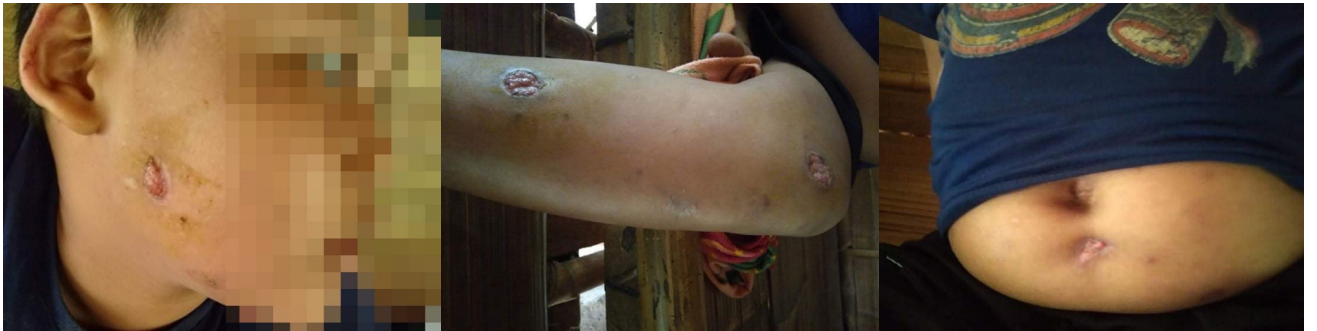
တံာ်ဂါသုာ်တဖှ်အံဘုာ်တံာ်ဒိန့ာ်အါ ဖဲလါယူၤလံ ၂၇ သီ, ၂၀၂၁ နံာ် ဖဲထ---သဝီ, မးထီကရူာ်, ဒွဲာ်လိကီာ်ဆာ်, မုာ်တြီာ်ကီာ်ရဲန့ာ် ဖဲစါတ---စံာ်လါတံာ်ဆါဟံာ်ဝံအလီာ်ခံန့ာ်လါ. တံာ်ဂါသုာ်တဖှ်ဒုးနံာ်ဖျါထီာ် အဝဲဘုာ်ဒိဒီးဟိပ်လံာ်မုာ်ပိာ်န့ာ်လါ. တံာ်ပူၤလီာ်ကဘျီဂုၤဂုၤအဂါဟံးတံာ်ဆါကတီာ်တဘျူးလါန့ာ်လါ. (တံာ်ဂါ - လီာ်ကဝီသဝီဖိ)

တံာ်ဂုာ်ကဲထီာ်သးလါအဂါသုာ်တဖှ်တဒါ SAC ပယီ ဒီးအသုးသိပ်မုာ်တဖှ်အိပ်ဒီးတံာ်ပညိပ်လီလီလါ ကဒီးလီဟိပ်လံာ်မုာ် ပိာ်လါသဝီသုာ်တဖှ်အပူၤ မုာ်ဒ်သီးကတြီယာ်ကရူာ်သုာ်တဖှ် လါကဟဲကွါလါတံာ်လီာ်တံာ်ကျဲ မုာ်တမုာ် တံာ်သုာ်ထီာ်တဖှ် ဒ်အမုာ်တံာ်ဟုာ်ကသံာ်ဒါ ဒီးတံာ်ဘုာ်တံာ်ဘါတံာ်သုာ်ထီာ်လီာ်တဂုၤအဂါန့ာ်လါ. အဒိ, ဖဲလါနိာ်ဂုာ်ဘုာ် ၁၆ သီ, ၂၀၂၁ နံာ်အနံၤ သုးမိစိရီအသိပ်မုာ်လါအမုာ် သုးဒီးကီာ်ဆါ (BGF) သုးဒု နီာ်ဂံာ် (၃) နံာ်လါဝဲဆူသဝီတဖျါလါအခိပ်လါ ဖှ်ဂီၤကရူာ်, ဖှ်အာ်ကီာ်ဆာ်, ဒုသထုာ်ကီာ်ရဲန့ာ် ဒီးမာဟးဂီၤဝဲ တံာ်ဟုာ်ကသံာ်ဒါအတံာ်သုာ်ထီာ်သုာ်တဖှ် ဒီးဂုာ်ဆူာ်ပျီဆူာ်န့ာ်တံာ်ဖိတံာ် လံာ်သုာ်တဖှ်န့ာ်လါ. အဝဲသုာ်တဲပျဲတဲဖုးသဝီဖိသုာ်တဖှ်လါ သုတလဲဆူတံာ်ဟုာ်ကသံာ်ဒါကရူာ်ပူၤနီာ်တဘျီလါတ ဂုၤန့ာ်လါ. 15 သဝီဖိသုာ်တဖှ်တယးဝဲလါ BGF ဒီးလီဟိပ်လံာ်မုာ်ပိာ်လါ တံာ်ဟုာ်ကသံာ်ဒါကရူာ်ပူၤ ဒီးအဝဲသုာ်တူာ်ဘုာ်ဝဲလါ တံာ်ဘုာ်တံာ်ဘါတအိပ်အယံ လဲကွါဝဲတဘုာ်လါဘုာ်န့ာ်လါ.