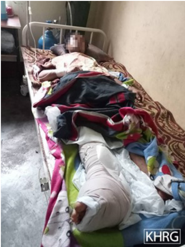
အထက်ပါပုံကို ၂၀၂၃ ခုနှစ်၊ ဇွန်လ ၁၄ ရက်နေ့၌ ဘားအံခရိုင်၊ တာကရယ်မြို့နယ်၊ ပီတာခါကျေးရွာအုပ်စု၊ ဖ---ဆေးရုံတွင် ရိုက်ယူခဲ့သည်။ ပုံတွင် မြေမြှုပ်မိုင်းထိမှန်ခဲ့သည့်စောန---သည် ထိုဆေးရုံတွင်ဆေးကုသမှုခံယူနေသည့်အခြေအနေကို ဖော်ပြ ထားသည်။

စောန---အနေဖြင့် အလုပ်ကောင်းစွာမလုပ်နိုင်သောကြောင့် ၎င်း၏မိသားစုစားဝတ်နေရေးအတွက် စိုးရိမ်နေရပါသည်။