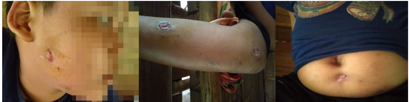
အထက်ပါဓါတ်ပုံများကို စောဌ--- ဆေးရုံမှ ဆင်းလာပြီးနောက် ၂၀၂၁ ခုနှစ်၊ ဇူလိုင်လ ၂၇ ရက်နေ့၌ မူကြော်ခရိုင်၊ ဒွယ်လိုး မြို့နယ်၊ မာထောကျေးရွာအုပ်စု၊ ည---ကျေးရွာတွင် ရိုက်ယူခဲ့သည်။ ပုံများတွင် မြေမြှုပ်မိုင်းပေါက်ကွဲမှုကြောင့် စောဌ---မှ ရရှိခဲ့သည့်ဒဏ်ရာ များကို ဖော်ပြထားပါသည်။ စောဌ---ရရှိခဲ့သည့် ဒဏ်ရာများအားလုံး ပျောက်ကင်းသွားသည့်အထိ လအနည်းငယ်ကြာမြင့်ခဲ့သည်။

လ ၂၇ ရက်နေ့တွင် စောဌ---သည် ဆေးရုံမှ ဆင်းလာနိုင် ပြီးဖြစ်သည်။ စောဌ---ရရှိခဲ့သည့် ဒဏ်ရာများအားလုံး ပျောက်ကင်းသွားသည့်အထိ လအနည်းငယ်ကြာမြင့်ခဲ့သည်။ အခင်းမဖြစ်ပွားမီအချိန်ကာလတွင် ဒေသအတွင်း မြေမြှုပ် မိုင်းများရှိသည်ဟု ဒေသခံ KNU အာဏာပိုင်များမှ ရွာသား များအား အကြောင်းကြားထားပါသည်။ ရွာသားများအား အကြောင်းကြားထားသည်မှာ ၎င်းတို့သည် လမ်းပေါ်တွင် သာ ခရီးသွားလာရမည်ဖြစ်ပြီး လမ်းအနီးတစ်ဝိုက်နားတွင် သွားလာ၍မရပေ။ စောဌ---၏အကိုဖြစ်သူပြောပြချက်အရ ဒေသခံတိုင်းရင်းသား လက်နက်ကိုင်တပ်ဖွဲ့များမှ ၂၀၂၁ ခု နှစ်၊ မေလတွင် ထိုမြေမြှုပ်မိုင်းများကို ထောင်ထားခဲ့ခြင်း ဖြစ်သည်။ ၂၀၂၀ ခုနှစ်တွင် ရွာသားများအတွက် မြေမြှုပ် မိုင်းအန္တရာယ်အသိပညာပေးသင်တန်းများ ပို့ချခဲ့သော်လည်း စောဌ---၏မိသားစုဝင် များသည် ထိုအသိပညာပေးသင်တန်း ကို တက်ရောက်နိုင်ခဲ့ခြင်းမရှိခဲ့ပေ။ ၎င်းတို့သည် မြေမြှုပ် မိုင်းအသိပညာပေးသည့် အကြောင်းအရာများပါဝင်သော စာစောင်များကိုသာ လက်ခံရရှိခဲ့သည်။ ယခင်က မြေမြှုပ် မိုင်း ပေါက်ကွဲမှုကြောင့် ည---ကျေးရွာတွင် မည်သူတစ်ဦး တစ်ယောက်မျှ ထိခိုက်ဒဏ်ရာရရှိခဲ့ခြင်းမရှိပေ။ ကျေးရွာ အနီးတွင် ဖြစ်ပွားခဲ့သည့်ထိုမြေမြှုပ်မိုင်းပေါက်ကွဲခြင်း သည် ပထမဆုံးသောအကြိမ်ဖြစ်သည်။ ဒေသခံအာဏာပိုင် များသည် မြေမြှုပ်မိုင်းရှိသည့်နေရာများတွင် သွားလာ ခြင်းများ မပြုလုပ်ရန်အတွက် ရွာသားများအား သတိပေး အကြောင်းကြားခဲ့ခြင်းရှိခဲ့ပါသည်။ သို့သော်လည်း မြေ မြှုပ်မိုင်းများကို လမ်းဘေးတွင်သော်လည်းကောင်း၊ ဒေသ အနီးတစ်ဝိုက်အတွင်းတွင်သော်လည်းကောင်း ထောင်ထား ခြင်းကြောင့် ဒေသခံရွာသားများအတွက် အလွန်အန္တရာယ် ရှိပါသည်။ ထို့အပြင် ကျေးရွာဒေသအနီးတစ်ဝိုက်တွင် ထောင်ထားသည့်မြေမြှုပ်မိုင်းများကို ညွှန်ပြသည့်လက္ခဏာ အမှတ်အသားများလည်း မရှိကြောင်းသိရှိရသည်။