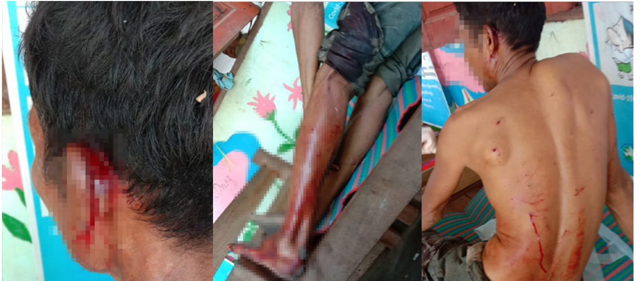
အထက်ပါပုံများကို ၂၀၂၂ ခုနှစ်၊ အောက်တိုဘာလ ၂၀ ရက်နေ့ တွင် ရိုက်ယူခဲ့သည်။ ပုံထဲတွင် ၂၀၂၂ ခုနှစ်၊ အောက်တိုဘာလ ၂၀ ရက် နေ့တွင် ဒူးပလာယာခရိုင်၊ ကော်တရီမြို့နယ်၊ မောခီးကျေးရွာအုပ်စု၊ တ---ကျေးရွာတွင်နေထိုင်သည့်ထ---သည် ဆွဲမိုင်းတစ်လုံးကို တိုက်မိခဲ့ပြီး ဒဏ်ရာရရှိခဲ့သည့် အခြေအနေကို ဖော်ပြထားသည်။ ပုံများထဲတွင် ထ---၏နားရွက်နား၊ ဘယ်ခြေထောက်နှင့် ကျော ကုန်းတွင် ဒဏ်ရာရရှိခဲ့သည့်အခြေအနေကို ဖော်ပြထားပါသည်။

ဖုတ်ရန်သွားလာနေသည့်အချိန်တွင် ဆွဲမိုင်းတစ်လုံးကို မတော်တဆတိုက်မိခဲ့သည်။ 17 ၎င်းဆွဲမိုင်းကို SAC တပ်ဖွဲ့ များက ထောင်ထားခဲ့သည်ဟု ဒေသခံရွာသားများက ယူဆ ကြသည်။ ထ---အား ဒူးပလာယာခရိုင်၊ ကော်တရီမြို့နယ်၊ ဝေါလေ မြို့ရှိ ဝေါလေဆေးရုံသို့ ပို့ဆောင်ခဲ့သည်။ တ---ရွာ တွင် မိုင်းအန္တရာယ်အသိပညာပေးသင်တန်းလည်း တစ်ခါ မှလာရောက်ပေးခြင်းမရှိခဲ့ပေ။ ထ---မှာ ဆွေမျိုးသားချင်း တစ်ဦးမှ မရှိပါ။ ထို့ကြောင့် သူ၏သူငယ်ချင်းများနှင့်ရွာသား များသာ ၎င်းကိုအားပေးကူညီကြသည်။ မည်သည့်အဖွဲ့ အစည်းမှ ထ---ကို ငွေကြေးထောက်ပံ့ခဲ့ခြင်းမရှိခဲ့ပေ။ ထ--- သည် ဒဏ်ရာများသက်သာလာ၍ ဆေးရုံမှဆင်းလာနိုင်ပြီး ဖြစ်သည်။