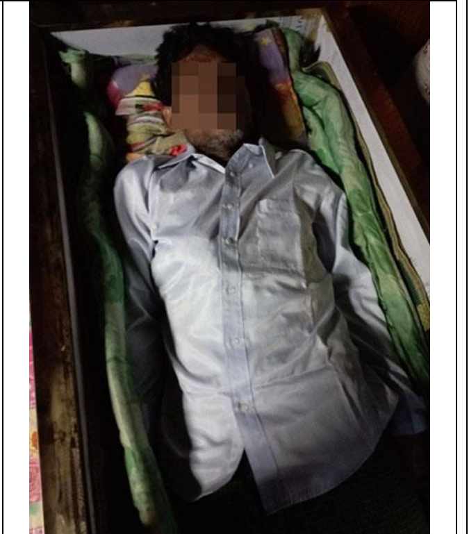
KHRG ဒီးန့ၢ်ဘၣ်တၢ်ဂီၤတဘျီအံၤ ဖဲလၢဖဲပထုဘၣ် ၂သီ, ၂၀၂၃ န့ၣ်န့ၣ်လီၤ. တၢ်ဂီၤတဘျီအံၤ ဟံၣ်ဖျါဝဲ မိၤဂ---, သးန့ၣ် (၂၀), လၢအသံဒီဖျါ တၢ်ခးလီၤကျိဖးဒိၣ်ဖဲ လၢယူၤလဲၣ် ၁၉သီ, ၂၀၂၃ န့ၣ်, ဖဲ ခ---သဝီ, ပလီဟီၣ်ကဝီၤ, လၢ်မုၢ်လၢကီၢ်ဆၣ်, ဘျးဒဝဲၢ်ကီၢ်ရ့ၣ်န့ၣ်လီၤ.