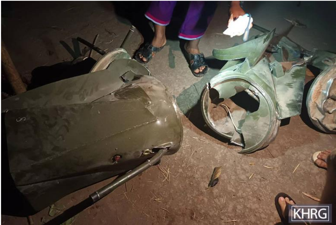
တၢ်ဂီၤတဘျၢၣ်အံၤဘၣ်တၢ်ဒိန့ၢ်အိၣ်ဖဲ လၢအူၤဖျၢၣ် ၁၁သီ, ၂၀၂၂န့ၣ် ဒီးပံၤဖျါထီၣ်ဝဲ ဖဲလၢအူၤဖျၢၣ် ၁၀သီ, ၂၀၂၂ န့ၣ်အနံၤန့ၣ် ကီၢ်ပယီၤသးကဘီယူၤခးသး ကွံာ်လီၤမ့ၣ်ပီၤကျိၣ်ဖးဒိၣ်လၢအပီၤဖးထီၣ်ဝဲ အကူအစီအိၣ်တၢ်သ့ၣ်တဖၣ် ဖဲတၢ်လီၢ်လၢအဘူးဒီးလုက့ၣ်ကီၢ်ဟီၣ်ကဝီၤ, ဖလူကရူာ်, ကိးတရဲးကီၢ်ဆၣ်, ခူးပျၢၣ်ယာ်ကီၢ်ရ့ၣ်န့ၣ်လီၤ. သဝီဖဲသ့ၣ်တဖၣ်န့ၣ်ဝဲလၢ မ့ၣ်ပီၤသ့ၣ်တဖၣ်အံၤ ပုၤဖျၢၣ်ဒီးကံသဝံအာသ့ၣ်တဖၣ် မ့ၣ်လၢမ့ၣ်ပီၤသ့ၣ်တဖၣ်အံၤ ပီၤဖးထီၣ်အခါ သဝီဖဲလၢအလဲဃုသ့ၣ်ညါတၢ် ဖဲတၢ်ကဲထီၣ်သးအလီၢ်သ့ၣ်တဖၣ် တူၢ်ဘၣ်ဝဲလၢအခိၣ်မူၤ, မဲာ်ချံၣ်ကီၢ်အူ ဒီးသးကလဲာ်ဘၣ်သးဘျီသ့ၣ်တဖၣ် အိၣ်အယိန့ၣ် လီၤ.

မ့ၣ်ပီၤဒီးကျိၣ်ချံၣ် လီၤဒဲတၢ်စူၤထံ-ပယီၤသးကဘီယူၤခးလီၤမ့ၣ်ပီၤကျိၣ်ဖးဒိၣ်လၢ 'တၢ်မ့ၣ်တၢ်ခုၣ်ဝုၢ်' ဒီးပုၤဖျၢၣ်အိၣ်ကဒုလီၢ်ဟီၣ်ကဝီၤပူၤလၢ ခူပျၢၣ်ယာ်ကီၢ်ရ့ၣ်, လၢဒိၣ်စဲဘၣ် ၂၀၂၃န့ၣ် တုၤလၢမ့ၤ ၂၀၂၂န့ၣ်