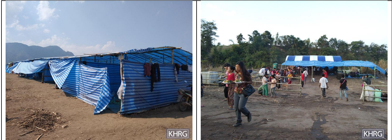
တၢ်ဂီၤတဖၣ်အံၤ ဘၣ်တၢ်ဒိၣ်အိၤဖဲ လါဒိၣ်စဲဘၢၣ် ၂၄သီ, ၂၀၂၁နံၣ်ဖဲပျီတပီၢ်တၢ်လီၤဘူးဒီးဖလူသဝီ, ဖလူကရူၢ်, ကီးတရံးကီၢ်ဆၣ်, ဒူပျံၣ်ယၢ်ကီၢ်ရူၢ် အပူၤန့ၣ်လီၤ. တၢ်ဂီၤသ့ၣ်တဖၣ်အံၤ ဟံၣ်ဖျါထီၣ်ဝဲ လုက့ၣ်ကီၢ်, ထံမဲးဝါခံ, ပဟံၣ်ကျိး ဒီးမဲးထီးသလုသဝီဖိပုၤဘၣ်ဃ့ၢ်မ့ၢ် ဟးဖျိးသ့ၣ်တဖၣ် ဟံၣ်ဃ့ၢ်အိၣ်ကဒု တစီၢ်တလီၢ်တၢ်လီၤတတီၤ မ့ၢ်လၢတကီၢ်ခါတၢ်ဒုးကဲထီၣ်သး တၢ်ခးလီၤကြီၣ်ကျိးဒိၣ် ဒီးတၢ်ခးကျိဖိ ဆူသဝီပူၤသ့ၣ်တဖၣ်ကဲထီၣ်သးဆူညါကွၢ်ကွၢ် အယံၣ်န့ၣ်လီၤ. (တၢ်ဂီၤ- KHRG)

ဖဲလါဒိၣ်စဲဘၢၣ် ၂၅သီ, ၂၀၂၁နံၣ်န့ၣ် ဖဲဟါလီၤခီ ဝဲးၣ်ၣ်န့ၣ်န့ၣ် SAC ကဘီယူၤခးလီၤတၢ် သၢဘျီတဘျီ ဖဲလုက့ၣ်ကီၢ်ဒီး ထံမဲးဝါခံသဝီပူၤန့ၣ်လီၤ. ဖဲတၢ်ကဲထီၣ်သးန့ၣ်ဝဲအံၤန့ၣ် SAC ကဘီယူၤဟံၣ်လံၣ်ခိးပတၢၣ်ခံဘၣ်ဟဲယူၤဝဲလီၤဟီၣ်ကဝီၤ ပူၤခံဘျီဒီးခးလီၤဝဲကျိဖိဒီးမ့ၢ်ပီၢ်ကျိဖိဒိၣ်လၢထံမဲးဝါခံသဝီပူၤ ဒီးခးယီၤစ့ၢ်ကီးကျိဖိဆူ KNLA သုးတၢ်သမံသမိးတြဲအလီၢ် ဖဲသဝီကပတဖျါအံၤန့ၣ်လီၤ. လီၢ်ကဝီၤသဝီဖိဟံၣ်ဖျါထီၣ်ဝဲတၢ်ဂ့ၢ်အံၤဆူ KIC ကညီၣ်တၢ်ကစီၣ်သန့လၢ ဒီဖျါလၢ SAC သုးကဘီယူၤခးလီၤတၢ်အံၤအယံၣ် ကမ့ၢ်အါန့ၢ်ဒိး (၅)ဂၤဘၣ်ဒိဝဲဒိၣ်န့ၣ်လီၤ. ဖဲန့ၣ်အဆၢကတီၢ် SAC သုးလၢအအိၣ်ဖဲ မ့ၢ်တၢ်လုမ့ၢ်တၢ်လီၤသ့ၣ်တဖၣ် ခးလီၤစ့ၢ်ကီး (၈၀)မးမး ကျိဖိဒိၣ်ဆူဟီၣ်ကဝီၤပူၤန့ၣ်လီၤ. 12