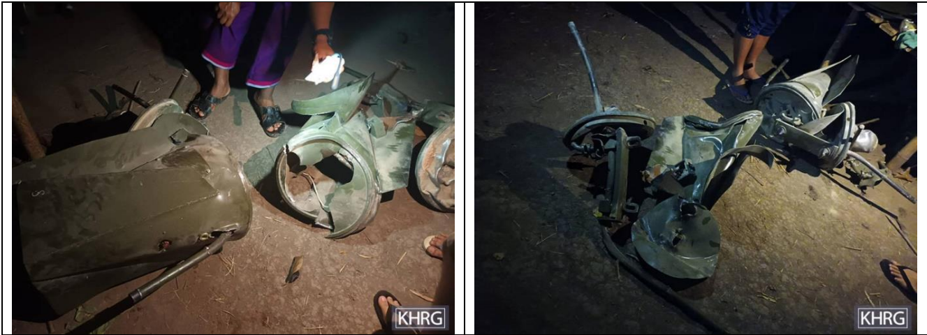
တၢ်ဂီၤတဖၣ်အံၤ ဘၣ်တၢ်ဒိန့ၢ်အီၤဖဲ လါအူဖျၢ ၁၁သီ, ၂၀၂၂ နံၣ် တၢ်လီၤဖဲ လူက့ၣ်ကီၢ်ဝဲတၢ်ကစီၣ်လၢ ဖလူကရူၢ်, ကီးတရံးကီၢ်ဆၣ်, ဒူပျၢ်ယၢ် ကီၢ်ရဲၣ်န့ၣ်လီၤ. ဘၣ်တၢ်လဲၤဒိအံၤဖဲ SAC ကဘီယူၤဒုးသးဟဲခးလီၤတၢ်ဖဲ လါအူဖျၢ ၁၀သီ, ၂၀၂၂ နံၣ် ဝံၤအလီၢ်ခဲန့ၣ်လီၤ. သဝီဖိတဖၣ် နာ်ဝဲလၢ ကျိဖးဒိၣ်ချံၣ်တဖၣ် ကမ့ၢ်ကျိဖးဒိၣ်ချံၣ်ကသံၣ်အစ့ၣ်အပၢ်န့ၣ်လီၤ. တၢ်ဂီၤတဖၣ်အံၤ ပၢ်ဖျါထီၣ်ဝဲလၢ ကျိဖးဒိၣ်ချံၣ်လီၤတဲၣ်န့ၣ်လီၤ. ကျိဖးဒိၣ်ချံၣ်လီၤတၢ်အကျါ တဖျါန့ၣ်ပိၤထီၣ်ဝဲဒီး အဂၤတဖျါန့ၣ်တပိၤထီၣ်ဝဲဒီးဘၣ်.

အီၤတဖၣ် မ့တမ့ၢ် တၢ်လီၤလၢ ကျိဖးဒိၣ်ချံၣ်လီၤတၢ်ဟီၣ်ကစီၣ်န့ၣ်လီၤ. သဝီဖိလၢအလဲၤကျိဖးဒိၣ်ချံၣ် လီၤတၢ်ပိၤဖးထီၣ်တဖၣ်န့ၣ် တူၢ်ဘၣ်ဝဲ တၢ်ပနီၣ်အါမံၤန့ၣ်လီၤ. သဝီဖိတဂၤလၢ အတူၢ်ဘၣ်တၢ်ပနီၣ်တဂၤ ပၢ်ဖျါထီၣ် ဆူ KHRG လၢ “ယမဲာ်သးချံၣ် ကီၢ်အူကီၢ်ဖး ဆါညါ. [...သနာ်က့] ယထံၣ်ပုၤအဂၤတဖၣ် အဘီၤအခိၣ်မူဒီး အမဲာ်ချံၣ် ကီၢ်အူလီၤ. [...] ပုၤတူၢ်ဘၣ်တၢ်ဒိအံၤ အိၣ် န့ၣ် ဖဲန့ၣ်အကျါ ခံၣ်န့ၣ် တူၢ်ဘၣ်ဝဲအနးကတၢၢ်လီၤ.” ကျိဖးဒိၣ်ချံၣ်န့ၣ် အမ့ၢ် ကျိချံၣ်ကံၤသဝံအစ့ၣ် အပျါခါန့ၣ် KHRG မၤလီၤတၢ်ဝဲတန့ၢ်ဘၣ်န့ၣ်လီၤ. ပုၤလၢ အထံၣ်ကျိဖးဒိၣ်ချံၣ်တဖၣ်တဲလၢ ကျိဖးဒိၣ်ချံၣ်တဖျါန့ၣ် နီၣ်ဂံၢ်ၤ၅ ဒီး အဂၤတဖျါန့ၣ် နီၣ်ဂံၢ် ၁၈ န့ၣ်လီၤ. လီၤကစီၣ်သဝီဖိတဖၣ်ပၢ်ဖျါထီၣ်ဝဲလၢ ကရူၢ်တဖုလၢတၢ်တသ့ၣ်ညါအီၤန့ၣ် သးကွံာ်ကျိဖးဒိၣ်ချံၣ်လၢ အတပိၤဖးထီၣ်တဖျါဒိးဘၣ်န့ၣ်ဒီး ပုၤဒီးလီၤမ့ၣ်ပိၤလၢ တၢ်လီၤဖဲန့ၣ်လီၤ.