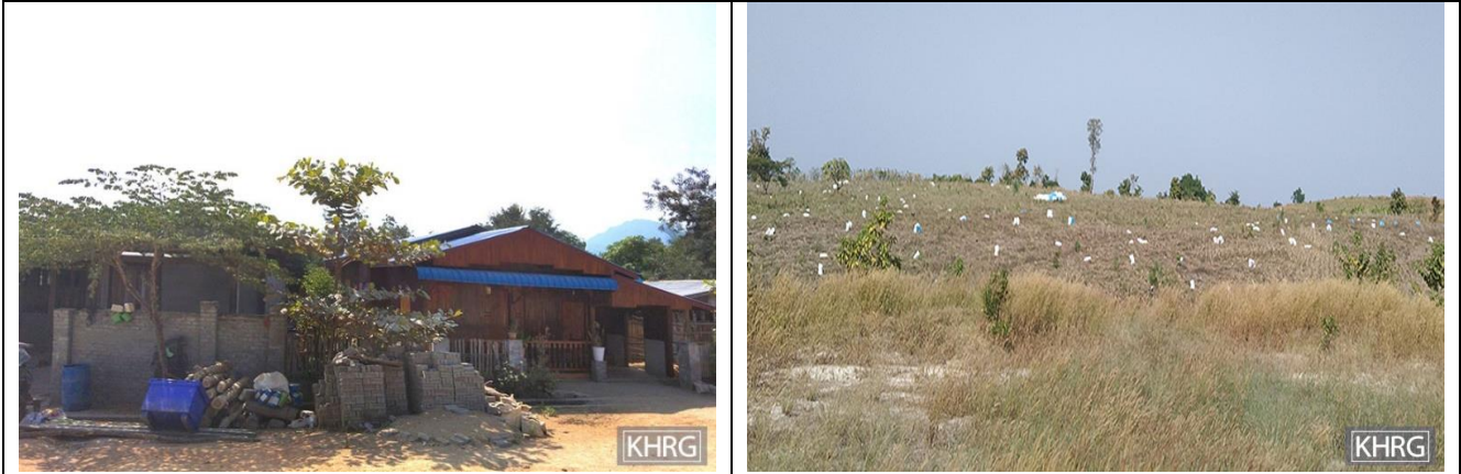
တၢ်ဂီၤသ့ၣ်တဖၣ်အံၤ ဘၣ်တၢ်ဒိန့ၢ်အီၤဖဲ လါဒိၣ်စဲဘၣ် ၂၇သီ, ၂၀၂၂န့ၣ် ဖဲထံးဝါခဲသဝီ, ဖလူကရူၢ်, ကီးတရံးကီၢ်ဆၢ, ဣသထူၣ်ကီၢ်ရူၢ်ပူၤန့ၣ်လီၤ. တၢ်ဂီၤလၢစုစ့ၣ်တကပပာ်ဖျါထီၣ်ဝဲ သဝီဖိသ့ၣ်တဖၣ်ဘၣ်ဟဲတ့ၢ်ကွံာ်အဟံၣ်အဃိ လၢထံးဝါခဲသဝီ မ့ၢ်လၢသဝီဖိသ့ၣ်တဖၣ် ဘၣ်ဃ့ၢ်မ့ၢ်ဟးဖျိး ဒီဖျါလၢ တၢ်ဒုးတၢ်ယၤဒီးတၢ်ခးလီၤကျိၣ်ဖျၢဒိၣ်အဃိန့ၣ်လီၤ. တၢ်ဂီၤလၢ စုထွဲတခီပာ်ဖျါထီၣ်ဝဲ သဝီဖိသ့ၣ်တဖၣ် ဘီးဘုခုဝံၤလံဘၣ်ဆၢ အဝဲသ့ၣ်ဘၣ်ဟဲတ့ၢ်ကွံာ် ဘုခုသ့ၣ်တဖၣ်အံၤလၢအကျိးပူၤ မ့ၢ်လၢအဝဲသ့ၣ်ဘၣ်ဃ့ၢ်မ့ၢ်ဟးဖျိးအဃိန့ၣ်လီၤ. (တၢ်ဂီၤ- KHRG)

အသီတဘျီကဒီးဖဲလါဒိၣ်စဲဘၣ် ၂၈သီ, ၂၀၂၂န့ၣ် ဖဲဟါခီ ဝဲးဝဲန့ၣ်ရံၣ်န့ၣ် SAC ကဘီယူၤသးခဲဘၣ်ဟဲတ့ၢ်လီၤမ့ၣ်ပိၢ်ကျိၣ်ဖျၢ ဒိၣ်ချံလၢ ကီးနွံၢ်အုၤရူၢ်ကျဲမ့ၢ်ခိၣ်န့ၣ်လီၤ. လီၤကစီၣ်ခိၣ်န့ၣ်သ့ၣ်တဖၣ်စံးဘၣ် KHRG လၢ ပှၤကညီ, ဟံၣ်ဃီ ဒီးတၢ်စုလီၢ်ခိၣ်ခိၣ် တၢ်ဘၣ်ဒိဘၣ်ထံးတအိၣ်နီတမံၤဘၣ်အဂ့ၢ်န့ၣ်လီၤ.