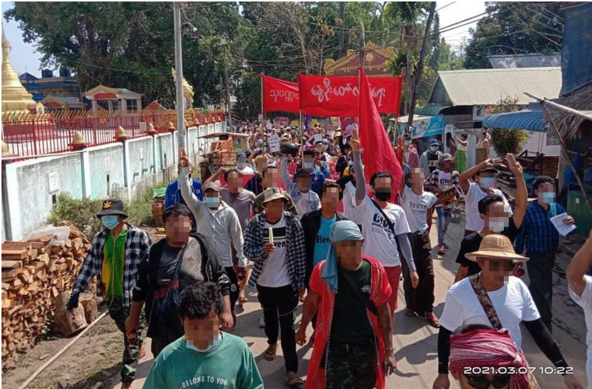
တၢ်ဂီၤတဘျီအံၤဘၣ်တၢ်ဒိအီၤဖဲ လါမးရှး ၅သီ, ၂၀၂၁နံၣ် ဖဲသ့ၣ်ဝနၣ်ဝတံၤဝဲၣ်, သထူၣ်ကီၢ်ဆၣ်, ဒုသထူၣ်ကီၢ်ရၣ်န့ၣ်လီၤ. တၢ်ဂီၤတဘျီအံၤဟံၣ်ဖျါထီၣ် ဝဲ သဝီဖဲလၢကွဲးကီၢ်ကရၢ်, သထူၣ်ကီၢ်ဆၣ်, ဒုသထူၣ်ကီၢ်ရၣ်တဖၣ် ဟံၣ်ဖျါထီၣ်အသးအါန့ၢ်ဒီး ၁,၀၀၀ ဂၤ ဒီးဟံၣ်ဖျါထီၣ်အတၢ်ဘၣ်သးလၢကျဲၣ်မုၢ်ဖီခိၣ် ထီဒါဝဲကီၢ်ပယီၤသူးမိၤစီရိၤတၢ်ဟံးန့ၢ်ဆူၣ် ထံကီၢ်တၢ်စိတၢ်ကမိၤအံၤန့ၣ်လီၤ.

တၢ်ဂဲၤပျုၢ်ဂဲၤဆူးသဟီၣ်လၢတၢ်မုၢ်တၢ်ခုၣ်ဂီၢ်ကတၢ်ကွံး:ဖဲ ၂၀၂၁ နံၣ် ကီၢ်ပယီၤသူးမိၤ စီရိၤ ဟံးန့ၢ်ဆူၣ်ထံကီၢ်တၢ်စိတၢ်ကမိၤဝံၤအလီၢ်ခံ တၢ်ဒူးတၢ်ယၤကဲထီၣ်လၢ KNLA ဒီး ကီၢ်ပယီၤသူးအဘၣ်စၢၤဖဲဒုသထူၣ်ကီၢ်ရၣ်အပူၤ (လါမးရှးဒီးလါအ့ၢ်ဖြ့ၣ် ၂၀၂၁ နံၣ်)