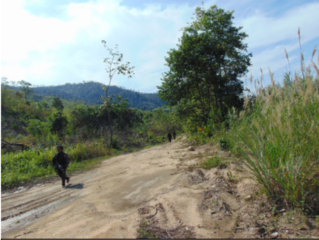
တၢ်ဂီၤအံၤဟံၣ်ဖျါထီၣ်ဝဲ KNLA သးခိးတၢ်ဘၣ်တၢ်ဘၢတဖၣ် ပးဆုၣ်တၢ်ဖဲ ဣပုၣ်ယၢ်ကီၢ်ရၣ်ခိး ဘျံးဒဲၣ်ကီၢ်ရၣ်အဆၢ ဖဲ လါအုၣ်ဖျါ ၂၀၁၈ နံၣ်န့ၣ်လီၤ.