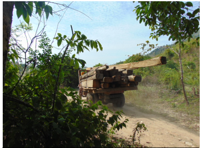
ဖဲတပ်မာသုဉ်တပ်ဂုဉ်လီဉ်ဘျီလီဉ်အံးကဲထီဉ် တပ်ဒုးစဲးပြဲးလါ KNLA ဒီး MNLA သုးအဘဉ်စါအဆါကတီဉ် MNLA အသုးဖိတဖဉ် ဖိဉ်န့ဉ်ဝဲသဝီဖဲလါ အတီဉ်ဆုးလီဉ်သုဉ်လါ သိ လုဉ်အလီတဖဉ်န့ဉ်လီဉ်.

ဖဲလါမးရှး ၄သီ, ၂၀၁၈ နံဉ်, ဂါခိ ၈ နဉ်ရံဉ် ၃၅ မံးနံး အဆါကတီဉ်, MNLA သုးဖိတဖဉ်ထီဉ်ဒုးဝဲ KNLA ဘဉ် ဘါအသုးလါ အခိးဟီဉ်ကဝါအဆါတဖဉ်ဖဲ ဖယါကိဟီဉ်ကဝါ, လါဒိဉ်စိကီဉ်ဆဉ်, ဘျဲးဒဲးကီဉ်ရှဉ်န့ဉ်လီဉ်. တပ်ဂုဉ်ကဲထီဉ်အသးဖဲလါ KNLA သုးတဖဉ်အိဉ် ဘျဲးကသုဉ်ကသီဖဲအကစါသုးကလါပူဉ်အဆါကတီဉ်န့ဉ်လီဉ်. ဘဉ် ဆဉ်တပ်ထီဉ်ဒုးတဘျီအံး တပ်ဘဉ်ဒိဘဉ်ထံးဒီး တပ်သံတပ်ပုဉ်တအိဉ်ဘဉ်န့ဉ်လီဉ်.