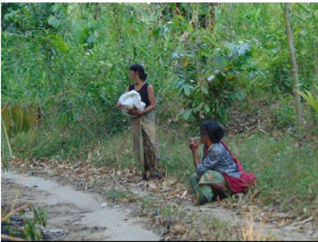
တၢ်ဂီၤအံၤဟံၣ်ဖျါထီၣ်ဝဲ တလၢၤသဝီဖိခံၤ အိၣ်ပတုၣ်လၢကျဲဖဲ အဝဲသ့ၣ်ကလဲၤဖဲလဲၤမၤတၢ်အခါ မ့ၢ်လၢအဝဲသ့ၣ်ပျံၤဘၣ်သး လၢအဟူးဂၢၤဘူးခိးသဝီတဖၣ်န့ၣ်လီၤ. တလၢၤနီၣ်သးတဖၣ်စံး ဘၣ်အဝဲသ့ၣ်လၢ ဖဲသးထံၣ်သးအခါ သုကဘၣ်ဆုၣ် နီၤခိးဟံၣ် ခုသ့ၣ်အသးန့ၣ်လီၤ.

အပူၤန့ၣ်လီၤ. ကညီၤခိးတလၢၤဖိလၢဟီၣ်ကဝီၤအံၤအပူၤ အိၣ်မူသကိးတၢ်လံၤဝဲလၢတၢ်ဘၣ်လိာ်ဖိဒုအပူၤလၢအနံၣ် တဖၣ်အနံၣ်လံၤန့ၣ်လီၤ. အဝဲသ့ၣ်ဘၣ်ယိၣ်ဝဲလၢတၢ်ဒုး တၢ်ယၢ်တဖၣ်ကမၤဘၣ်ဒိက့ၤ ကလုာ်န့ၣ်ခံဖုအတၢ်ရၢ လိာ်ဘၣ်ထွဲဘၣ်ဖုးန့ၣ်လီၤ.