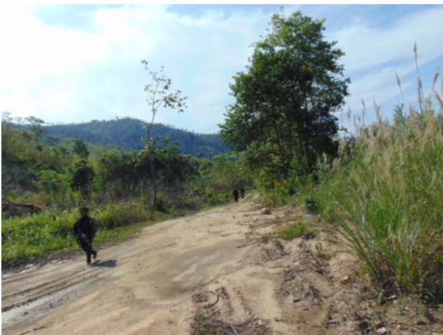
KNLA နယ်စပ်လုံခြုံရေးတပ်ဖွဲ့မှ စစ်သားများသည် ၂၀၁၈ ခုနှစ်၊ ဧပြီလတွင် ဒူးပလာယာခရိုင်နှင့် မြိတ်-ထားဝယ်ခရိုင် ကြားထိစပ်နေသည့်ဒေသ၌ လှည့်လည်လှုပ်ရှားနေသည်ကို တွေ့မြင်နိုင်ပါ သည်။

KNLA နှင့် MNLA တို့စပ်ကြားဖြစ်ပွားခဲ့သော လက် နက်ကိုင်ပဋိပက္ခကြောင့် မန်အောင်ကျေးရွာတွင် ရှိ ငွေသာမွန်နှင့် ကရင်ရွာသားများ စပ်ကြားတင်းမာမှု ဖြစ်မည်ကိုစိုးရိမ်ကြောင်း ဒေသခံရွာသားများက ကရင်လူ့အခွင့်အရေးအဖွဲ့ထံသို့ တင်ပြခဲ့ပါသည်။ မွန်နှင့်ကရင်ရွာသားများသည် နှစ်ပေါင်းများစွာအ တူတကွညီညွတ်စွာနေထိုင်လာခဲ့ကြပါသည်။ တိုက် ပွဲများကြောင့် တိုင်းရင်းသားလူမျိုးနှစ်စုအကြား ချစ် ခင်ရင်းနှီးမှုပျက်ပြယ်သွားမည်ကို၎င်းတို့က စိုးရိမ် ကြပါသည်။