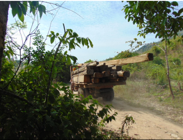
သစ်ထုတ်လုပ်မှုအငြင်းပွားခြင်းကြောင့် KNLA နှင့် MNLA တို့အကြား တိုက်ပွဲများ အနည်းငယ်ဖြစ်ပေါ်နေစဉ်အတွင်း ကားဖြင့် သစ်များကိုသယ်ယူနေသော ရွာသားများအား MNLA စစ်သားများကဖမ်းဆီးခဲ့ပါသည်။

"မန်အောင်ရဲ့အရှေ့ဖက်ဒေသမှာ သစ်ထုတ်လုပ်မှု လုပ်ငန်းတွေကို တားမြစ်ထားတယ်။ အဲ့ဒီမှာ သစ်လာလုပ်တယ်ဆိုတဲ့သတင်းလည်းကြားရော ကျွန် တော်တို့ရဲ့ စစ်သားတွေက ကင်းလှည့်နေရခြင်းဖြစ်တယ်။" 6