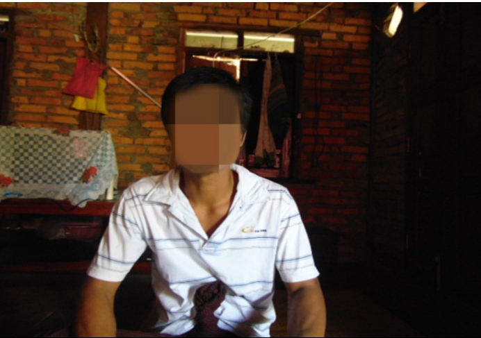
ဤပုံကို ၂၀၁၈ခုနှစ်၊ ဧပြီလ၊ ၁၂ရက်နေ့တွင်ရိုက်ယူခဲ့သည်။ ပုံ တွင် တ--- ကျေးရွာတွင်နေထိုင်သော ဆင်ထိန်းတစ်ဦး၏ပုံဖြစ် သည်။ သူသည် ၂၀၁၈ခုနှစ်၊ ဇန်နဝါရီလတွင်းသစ်ထုတ်လုပ်မှု တွင်ပါဝင်ခြင်းကြောင့် MNLA မှဖမ်းဆီးခံရသောအလုပ်သမား များထဲမှ အလုပ်သမားတစ်ဦးဖြစ်သည်။

MNLA ဗိုလ်မှူးပန်းခိုင်သည် ကျန်ရှိနေသေး သော သစ်တောများကို သစ်ထုတ်လုပ်ရန်အ တွက်၎င်းတို့အား (အလုပ်သမားများ) ခွင့်ပြုခဲ့ပါ သည်။ ဤကဲ့သို့သောဆုံး ဖြတ်ချက်ရှိသော်ငြား လည်းဘဲ ၂၀၁၈ခုနှစ်၊ ဖေဖော် ဝါရီ လ၊ ၂၄ ရက်နေ့တွင် MNLA စစ်သားအယောက် နှစ် ဆယ်သည် KNLA တပ်ရင်း (၁၆) မှ KNLA စစ်သားများအား ပစ်ခတ်တိုက်ခိုက်ခဲ့ကြပါသည်။ ထို့ပြင် သစ်ထုတ်လုပ်သော ဒေသခံရွာသားများ အား MNLA က ဒုတိယအကြိမ်ဖမ်းဆီးခဲ့ပြန် သည်။